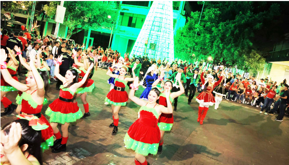
La magia decembrina iluminó las calles de Neiva durante el tradicional desfile navideño.