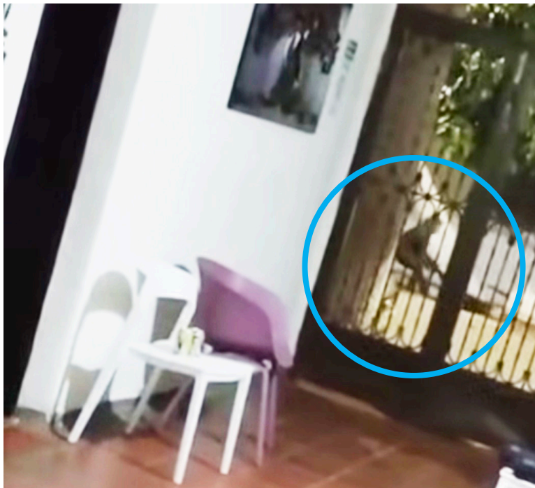
Un video que circula en redes sociales muestra el momento después del hostigamiento donde un sujeto arrastra a otro, quien sería alias El Flaco.

El fallecido, señalado de manera preliminar como alias El Flaco, habría perdido la vida después de resultar herido en medio de los hechos registrados en la noche del viernes 5 de diciembre en Tesalia.