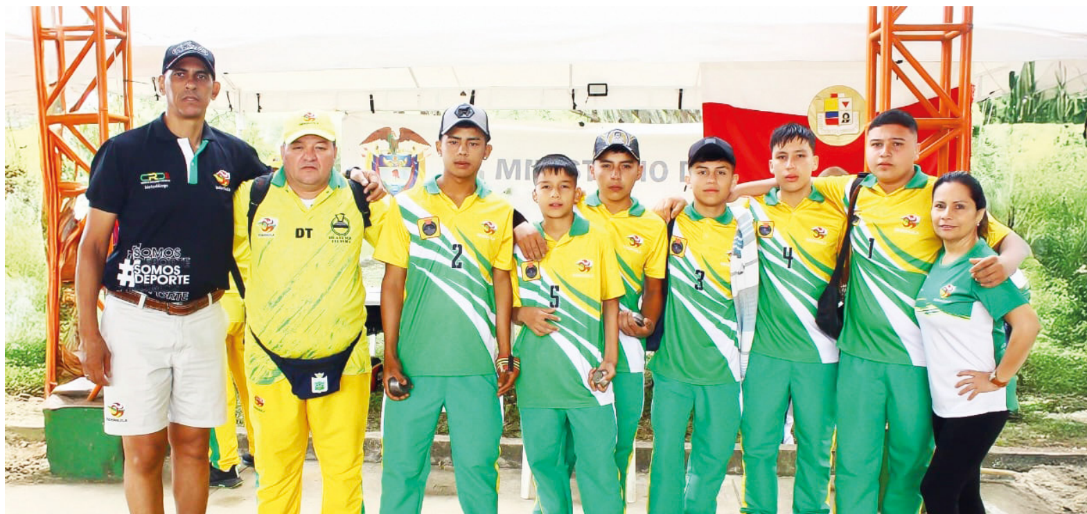
La Liga de Tejo del Huila participó en el Campeonato Nacional Juvenil de Tejo en el municipio de Garzon.

La participación del Huila en los torneos nacionales se dio en las categorías juvenil, sub 25 y mayores. Cada una representó un escenario con particularidades técnicas y niveles de exigencia diferentes, lo que permitió al cuerpo técnico observar el desempeño de los deportistas en contextos variados. La categoría juvenil tuvo relevancia por el trabajo de base que se adelanta en varios municipios, mientras que la sub 25 sirvió para proyectar atletas que se encuentran en