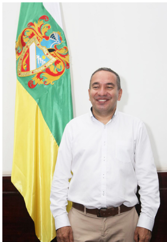
Reveló cuáles son sus prioridades en este nuevo cargo.

Vamos a estar muy comprometidos con estas circunstancias para aumentar esta responsabilidad que tenemos como estado. Y sin duda los procesos que tiene la Contraloría nos han pedido un control efectivo sobre la responsabilidad fiscal, algunos procesos que han terminado prescribiendo sin cumplir el objetivo de resarcimiento al daño patrimonial que genera.