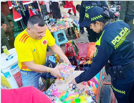
La Gobernación del Huila ordenó reforzar controles en Neiva, Pitalito y Acevedo por alto riesgo.

La distribución territorial del reporte evidencia que la problemática persiste prácticamente en