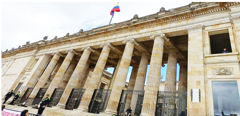
Congresistas analizando medidas para reducir privilegios y revisar remuneraciones.

Un congresista colombiano gana 35 veces más que un trabajador que devenga el salario mínimo, una brecha que reavivó las voces a favor de limitar los incrementos salariales de los altos cargos públicos.