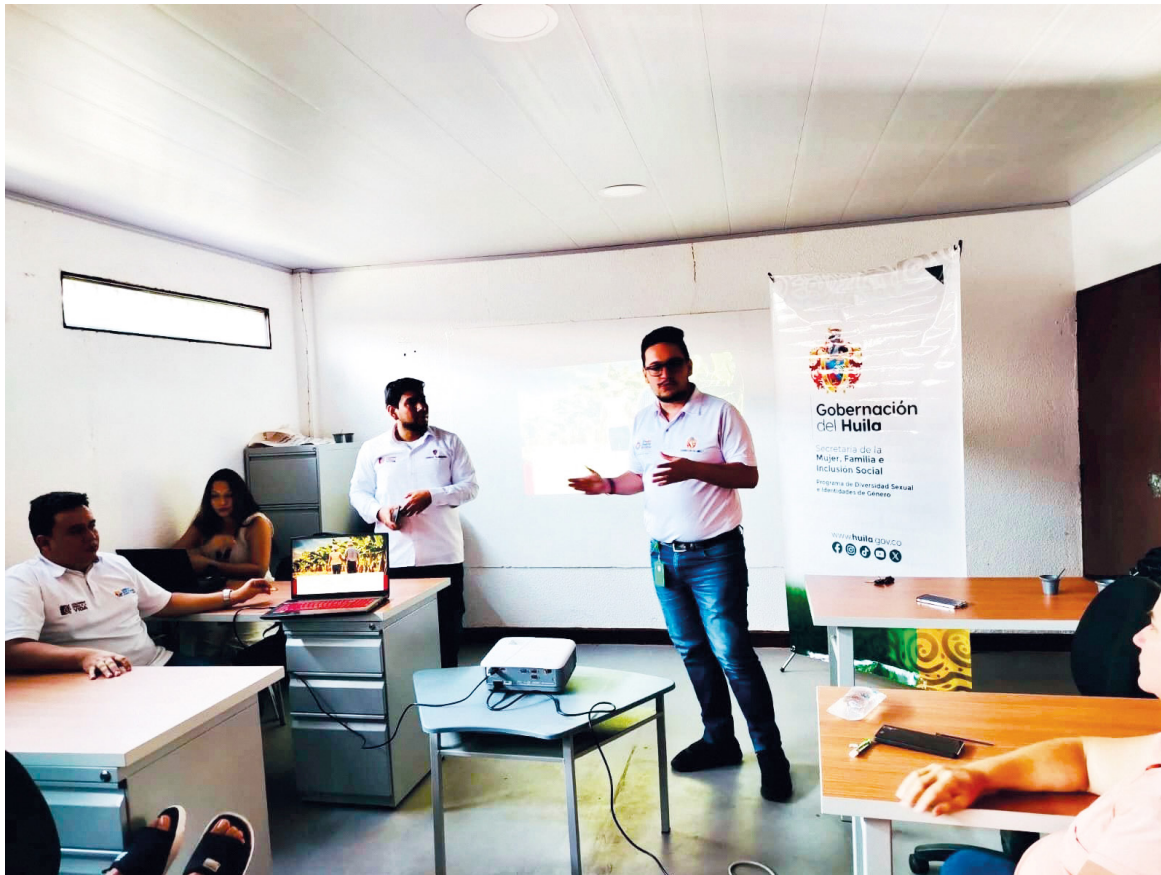
Realizan charlas de concientización.