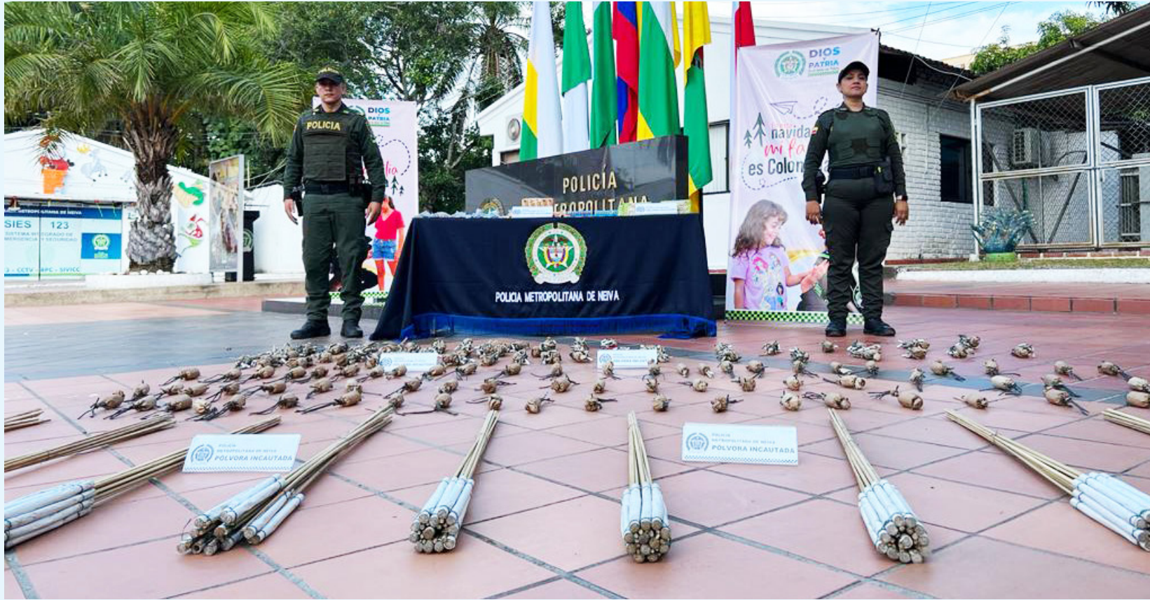
Operativos en vías del Huila buscan frenar el ingreso de pólvora ilegal durante la temporada decembrina.

El Huila suma cuatro lesionados por pólvora entre el 1 y el 8 de diciembre, ingresando al listado nacional de territorios en alerta temprana, según el INS.