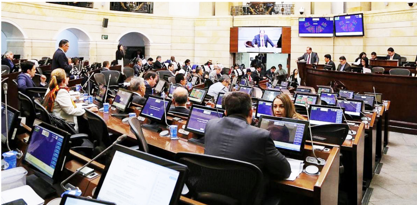
Debate en el Congreso sobre los incrementos salariales y la desigualdad económica.

■ Una vez más, el salario de los congresistas vuelve al centro de un debate nacional. La propuesta de la senadora Aida Avella de limitar el aumento de los legisladores al 1%, frente a incrementos superiores para los trabajadores que devengan el mínimo, revivió tensiones históricas entre partidos y abrió un nuevo capítulo en la discusión sobre desigualdad salarial y privilegios en el Congreso.