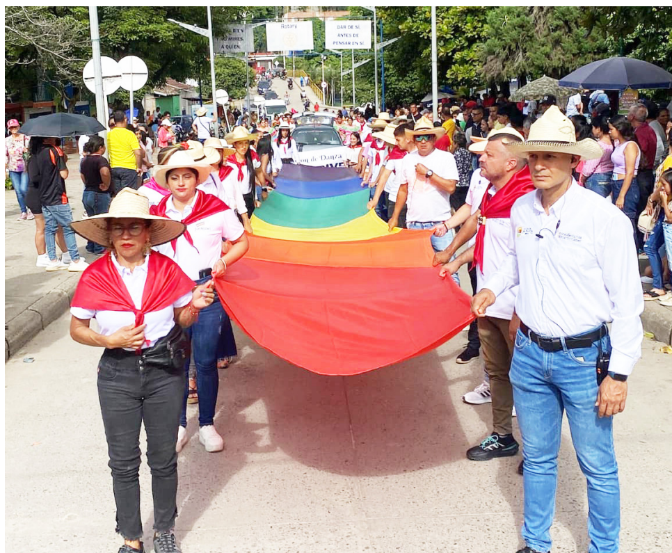
Reconocen que falta mucho por seguir trabajando para poder disminuir a cero la violencia.

De acuerdo con el funcionario, reconocen que falta mucho por seguir trabajando para poder disminuir a cero la violencia por prejuicio en razón a la orientación sexual de la entidad de género diversa.