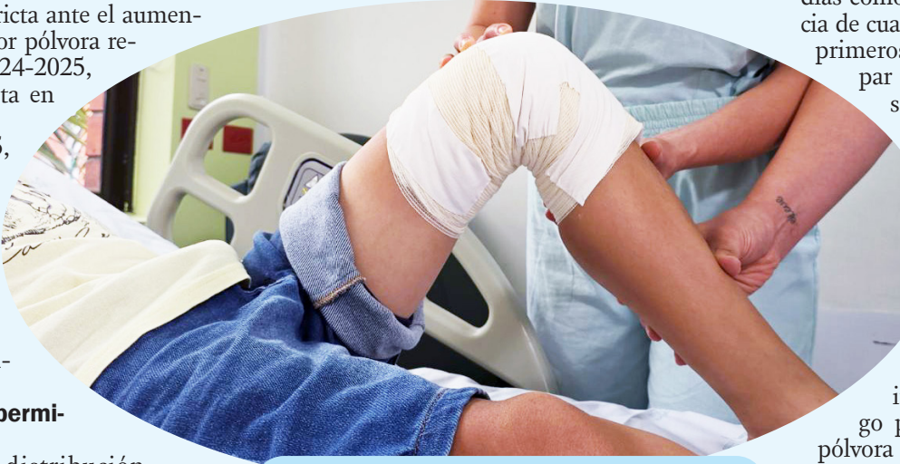
Artefactos como totes, voladores y cohetes se mantienen entre los de mayor riesgo de lesiones graves.

El gobierno departamental también hizo énfasis en el impacto ambiental y las afectaciones en animales domésticos y silvestres, un componente que ha venido tomando relevancia en la discusión pública.