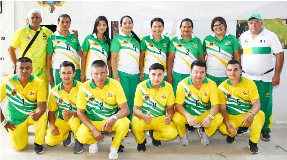
En Valledupar, la delegación huilense participó en el Campeonato Nacional en la categoría mayores.