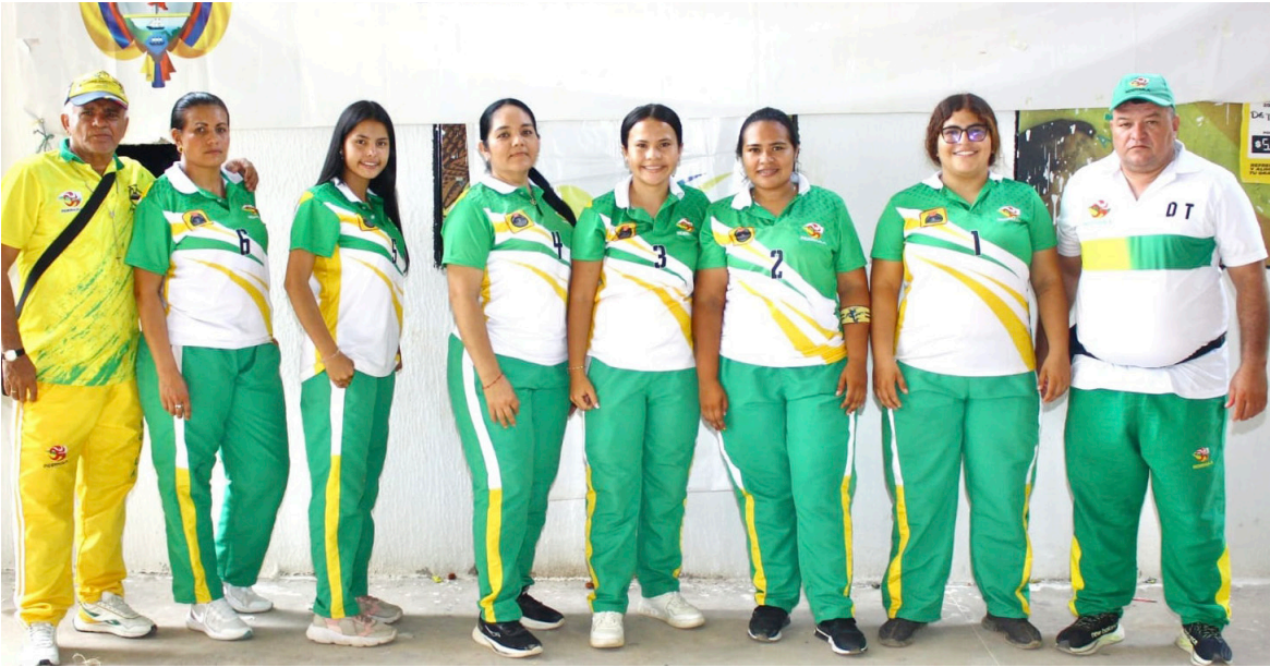
Deportistas opitas en el Campeonato Nacional de Tejo en la categoría mayores femenino en Valledupar.

petencia de las delegaciones participantes. En este certamen, el Huila obtuvo el subcampeonato en la competencia por equipos y una medalla de bronce en la modalidad general. Estos resultados se convirtieron en uno de los principales indicadores del rendimiento del departamento en la categoría más avanzada. La participación en la categoría de mayores permitió al cuerpo técnico evaluar la madurez competitiva del grupo y revisar las estrategias necesarias para enfrentar los clasificatorios del 2026. Los resultados también ofrecieron una motivación adicional para los deportistas que deberán sostener la preparación durante el siguiente año. El entrenador Sáenz destacó que estos torneos permitieron consolidar la proyección de la liga hacia el ciclo nacional. Cada competencia entregó información relevante sobre el rendimiento técnico y físico del grupo, lo que permitirá ajustar los procesos durante los próximos meses.