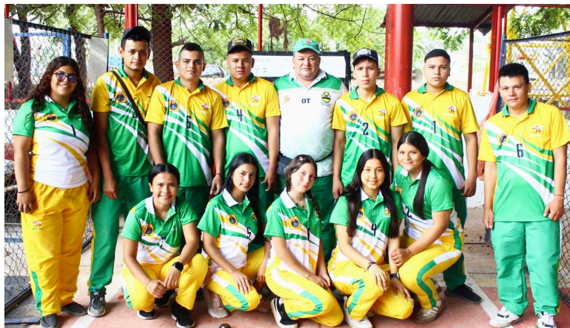
Huila presente en el Campeonato Nacional Sub 25 en categorías femenina y masculina.

La participación en los torneos nacionales se convirtió en uno de los ejes de evaluación del año, ya que permitió medir el rendimiento del departamento frente a delegaciones con procesos consolidados.