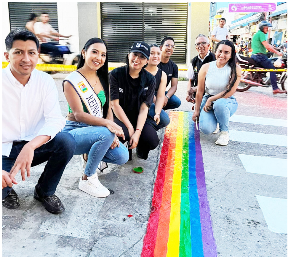
Han hecho actividades con la comunidad.

“Esperamos reforzar en el 2026 estas estrategias para que puedan beneficiarse de esos espacios seguros para las personas con orientaciones sexuales e identidad de género diversa a través de la sensibilización de la ciudadanía y de todas las formaciones que se hacen a los funcionarios públicos de las diferentes entidades territoriales”, concluyó el funcionario de la gobernación del Huila.