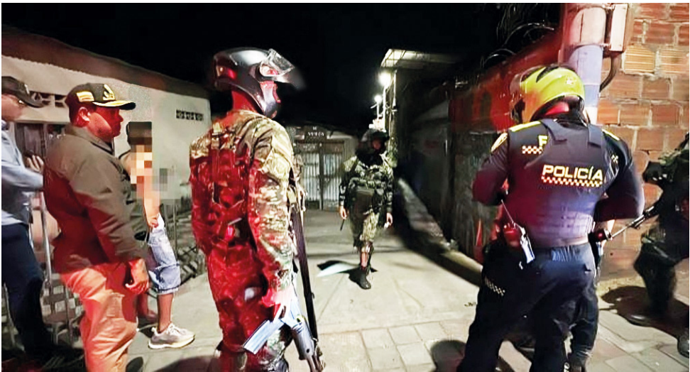
El decreto rige en las comunas 6, 8, 9 y 10, y restringe la presencia de menores de edad.