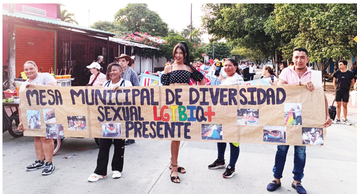
Estos actos violentos se manifiestan desde discursos de odio e incitación.

Del total de víctimas acreditadas, 322 corresponden al Subcaso 1, que reúne a mujeres y hombres de la población civil afectados por violencias de género cometidas por las Farc-EP (286 víctimas directas y 36 indirectas). En el Subcaso 2 se acreditaron 292 víctimas de violencias de género cometidas por integrantes de la fuerza pública (234 directas, 55 indirectas y tres colectivas: un colectivo de mujeres, un colectivo LGBTIQ+ y una organización de hombres). En el Subcaso 3 han sido acreditadas 21 víctimas (19 directas y 2 indirectas)