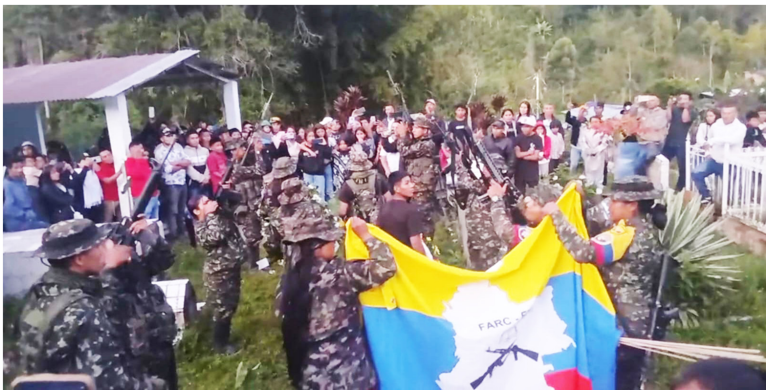
El sepelio se realizó en Rionegro, zona rural del municipio de Íquira, en el occidente del Huila.