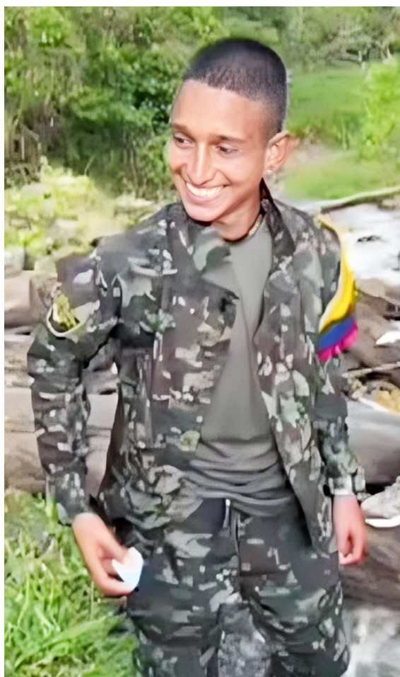
El fallecido, señalado de manera preliminar como alias El Flaco.

La despedida incluyó un grupo numeroso de personas armadas que realizaron disparos al aire mientras acompañaban el entierro en el corregimiento de Rionegro, jurisdicción del municipio de Íquira.