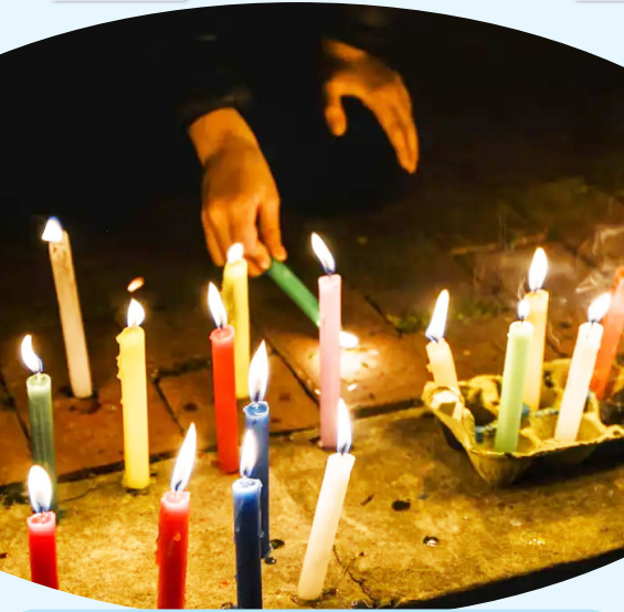
El INS confirmó que 86 menores resultaron lesionados en la noche de Velitas en el país.

La capital huilense entró en vigilancia intensificada desde el 1 de diciembre, medida que se extenderá hasta el 15 de enero. Durante este periodo, la