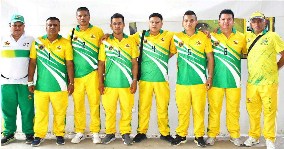
El equipo masculino de mayores durante el evento nacional realizado en Valledupar, Cesar.