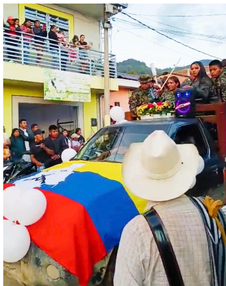
Así acompañaron presuntos integrantes de las disidencias a alias El Flaco, en su sepelio.

Las autoridades también informaron que durante la noche del ataque un integrante del grupo armado incendió dos vehículos en