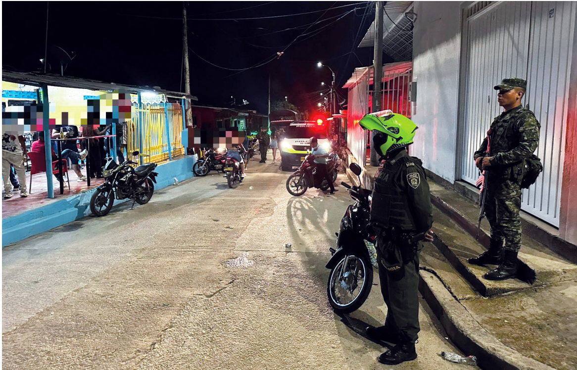
La Administración Municipal confirmó que continuará con los operativos.