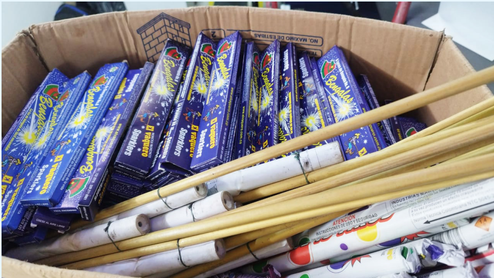
Las autoridades de Neiva mantienen vigilancia intensificada desde el 1 de diciembre hasta el 15 de enero.

El Huila suma cuatro lesionados por pólvora entre el 1 y el 8 de diciembre, ingresando al listado nacional de territorios en alerta temprana, según el INS.