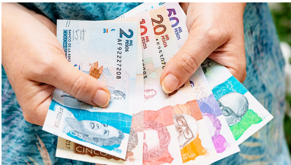
Sesión legislativa en la que se discutieron propuestas sobre topes salariales.

La cifra contrasta de manera abismal con el salario mínimo vigente, ubicado en $1.623.500 mensuales, es decir, $19.482.000 al año. Un congresista gana 35 veces más que un trabajador que devenga el mínimo. Y la brecha se hace más evidente cuando se consideran las cifras del Ministerio del Trabajo: de los 22 millones de trabajadores formales del país, el 80% gana menos de $3 millones mensuales.