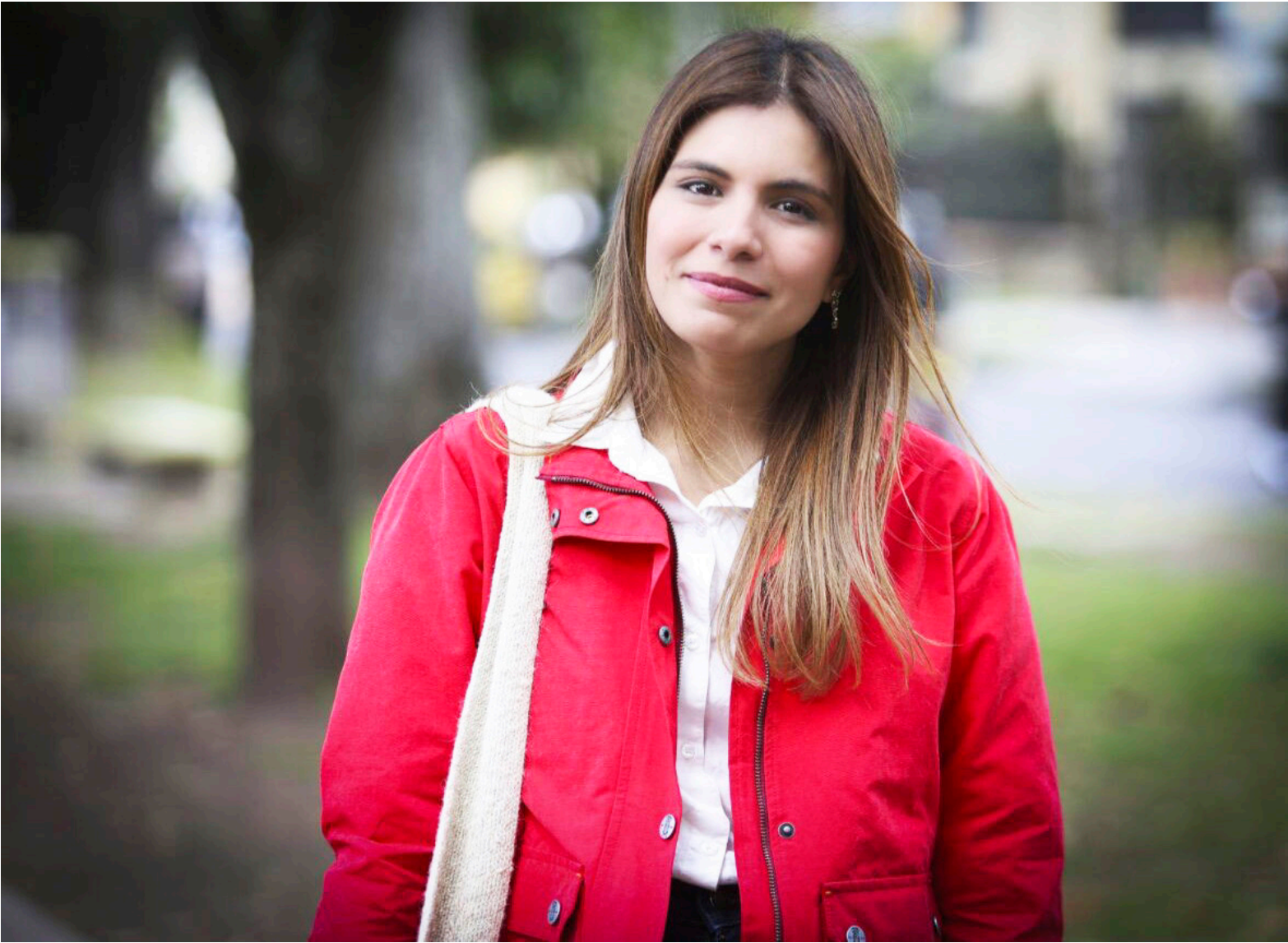
Villalba afirma que el Congreso debe recuperar su independencia y dejar atrás la política del espectáculo.

“Necesitamos un Congreso que devuelva la confianza en las insti-