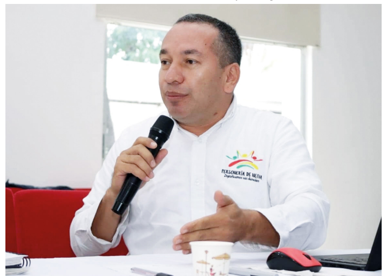
Ha tenido una larga trayectoria en el sector público.

Había visitado el Ministerio Público un encuentro entre personeros del centro y el sur del departamento de Huila he estado en la Procuraduría lide-