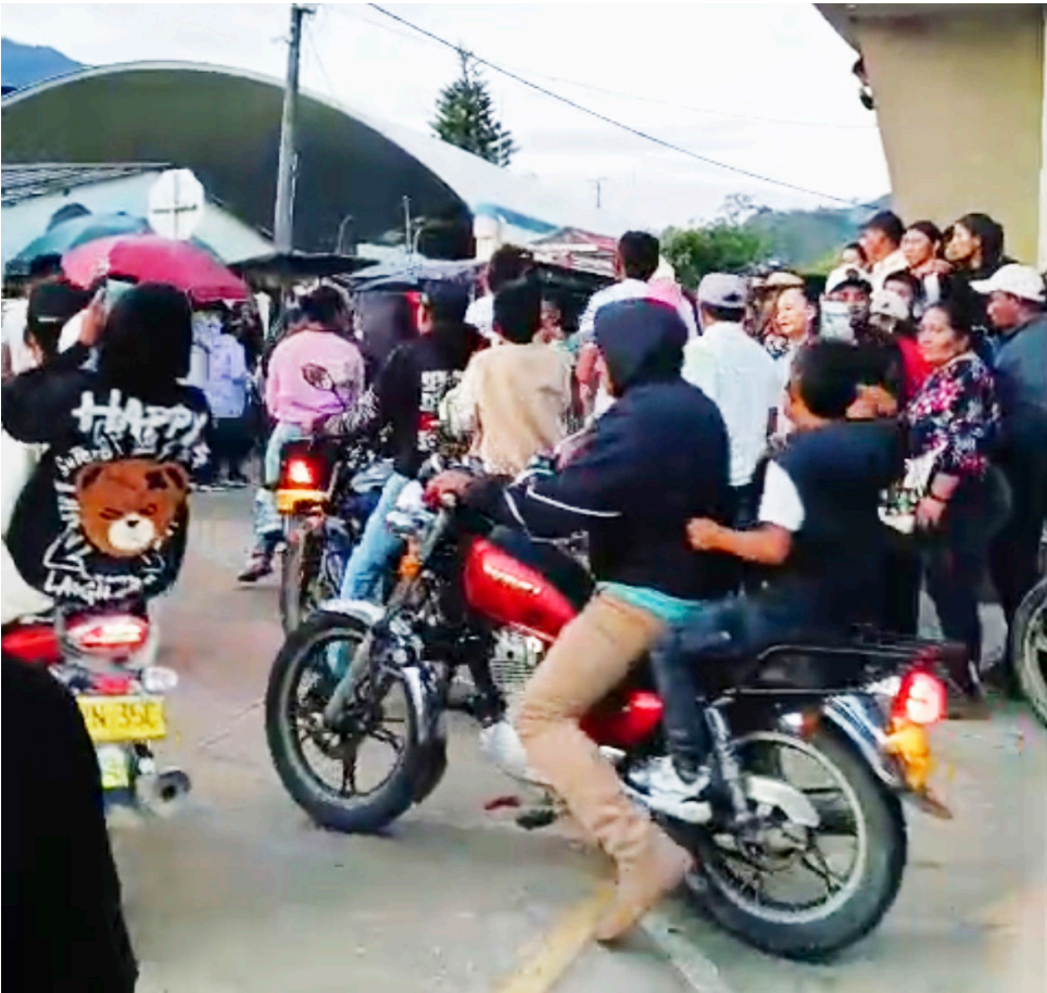
La caravana registrada en las calles del municipio de Íquira.

el municipio. Se trataba de un camión y un automóvil que fueron prendidos en llamas en una vía del casco urbano. Según versiones institucionales, la acción habría sido ejecutada para facilitar la huida de los responsables, pues el hostigamiento a la estación fue contenido rápidamente por los uniformados que se encontraban prestando servicio en la zona. Mientras se desarrollaba el operativo en respuesta al ataque y se aseguraban los alrededores, fue registrado un video en el que aparece un hombre gravemente herido siendo arrastrado por otro individuo. Las imágenes circularon en redes digitales y entre habitantes, quienes las relacionaron con las acciones de los disidentes que participaron en la incursión. Pocas horas después comenzaron a circular versiones que señalaban que el hombre herido habría muerto como consecuencia de las lesiones sufridas durante el enfrentamiento.