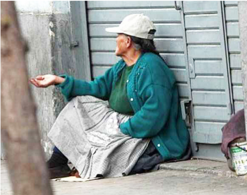
Buscan que las personas puedan terminar una vejez con dignidad.

El hogar de larga estancia es en donde se acogen a las personas mayores que por algún motivo han sido abandonados o no tienen las condiciones para continuar con un envejecimiento digno, estos espacios nacieron precisamente para eso, para que las personas puedan terminar una vejez con dignidad.