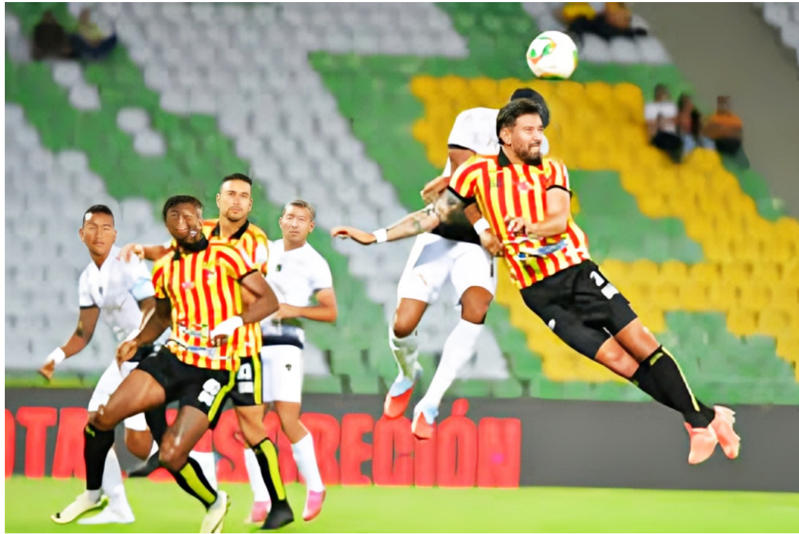
La crisis del Pereira domina la agenda previa a la asamblea de la Dimayor.