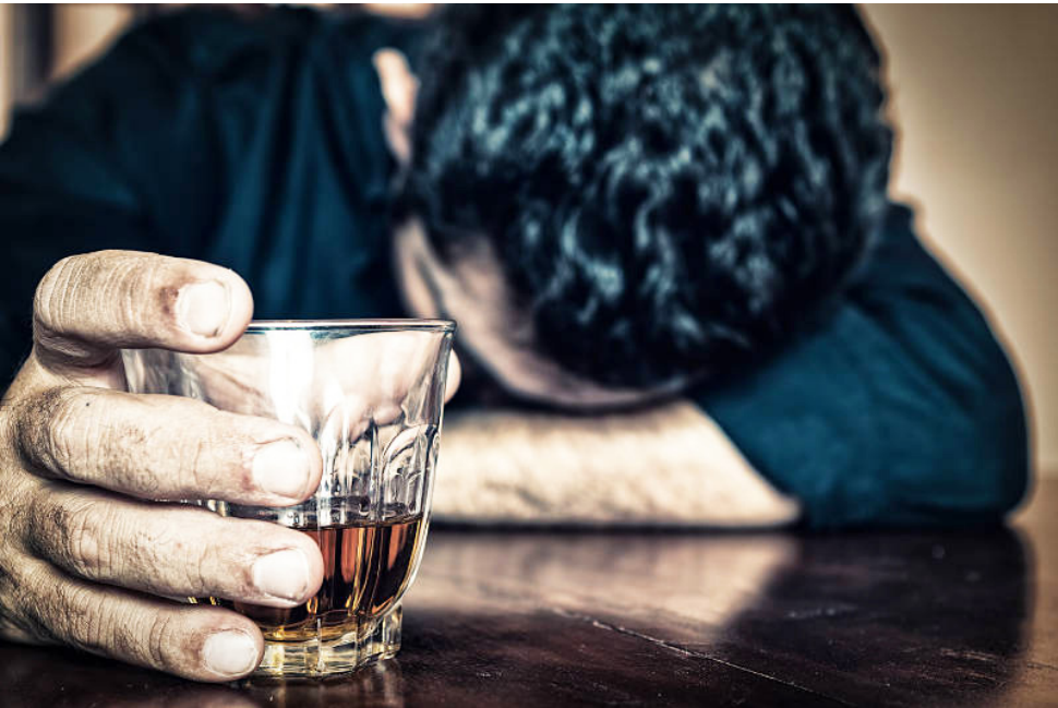
Realmente quien representaba un peligro para los menores era su padre. Era alcohólico.

gación y apelación, el 6 de junio de 2025, el Juzgado Primero Promiscuo de Familia de Garzón modificó la medida y estableció custodia compartida, fijando tiempos de cuidado alternos en-