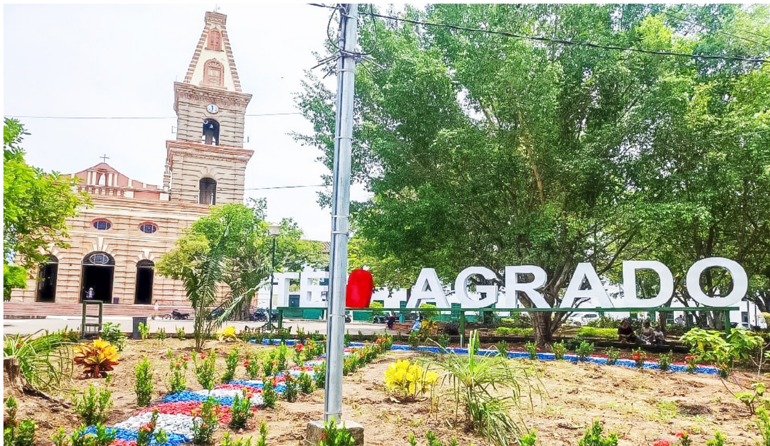
El Comisario de El Agrado se le compulsaron copias para investigar su actuación en este caso.