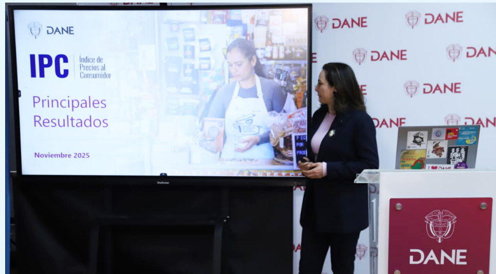
El más reciente reporte del IPC presentado por el Dane, uno de los insumos centrales para determinar el ajuste del salario mínimo.

Aunque la inflación ha mostrado reducciones paulatinas, los precios de bienes y servicios esenciales aún presentan niveles superiores a los observados antes de la pandemia. Este comportamiento ha generado presiones en los hogares, pero también en las empresas, que deben asumir aumentos en los costos de producción, transporte, energía y materias primas.