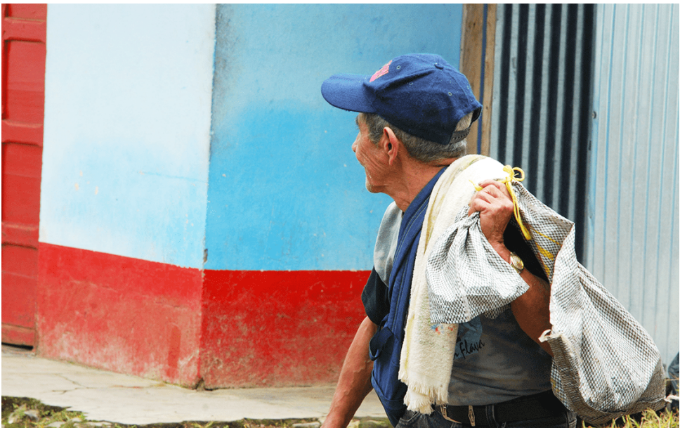
Según las estimaciones del DANE, tiene 56.000 personas mayores de 60 años.

necesidades de las personas mayores, frente a todo esto, la secretaría ha estado muy pendiente, se ha brindado actividades de capacitación, de socialización. Se ha estado siempre atento a garantizar el restablecimiento de los derechos de las personas mayores que han asistido y preguntado por algún tipo de servicio o por algún tipo de inquietud frente a alguna situación que esté viviendo”, indicó.