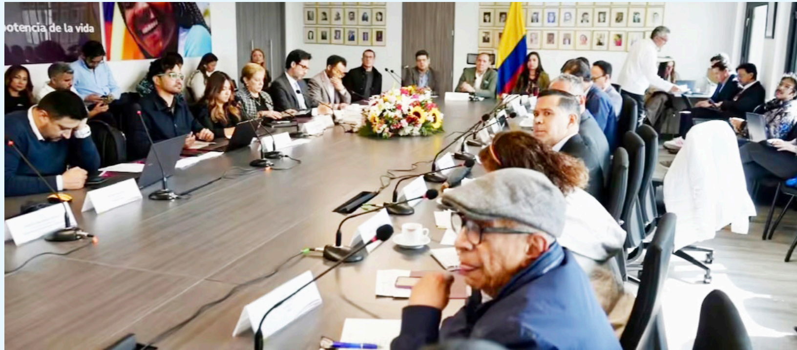
Mesa de negociación y concertación para definir incremento del salario mínimo para 2026.