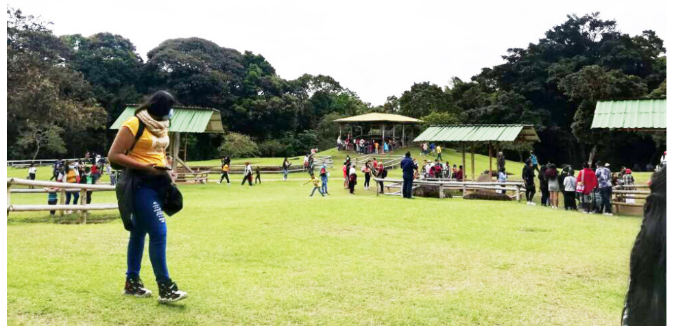
Diciembre es uno de los meses de mayor movimiento comercial en el Huila.