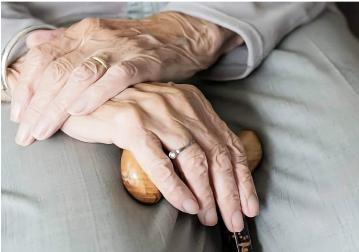
El municipio de Neiva enfrenta el desafío del envejecimiento poblacional.

de larga estancia es en donde se acogen a las personas mayores que por algún motivo han sido abandonados o no tienen las condiciones para continuar con un envejecimiento digno, estos espacios nacieron precisamente para eso, para que las personas puedan terminar una vejez con dignidad.