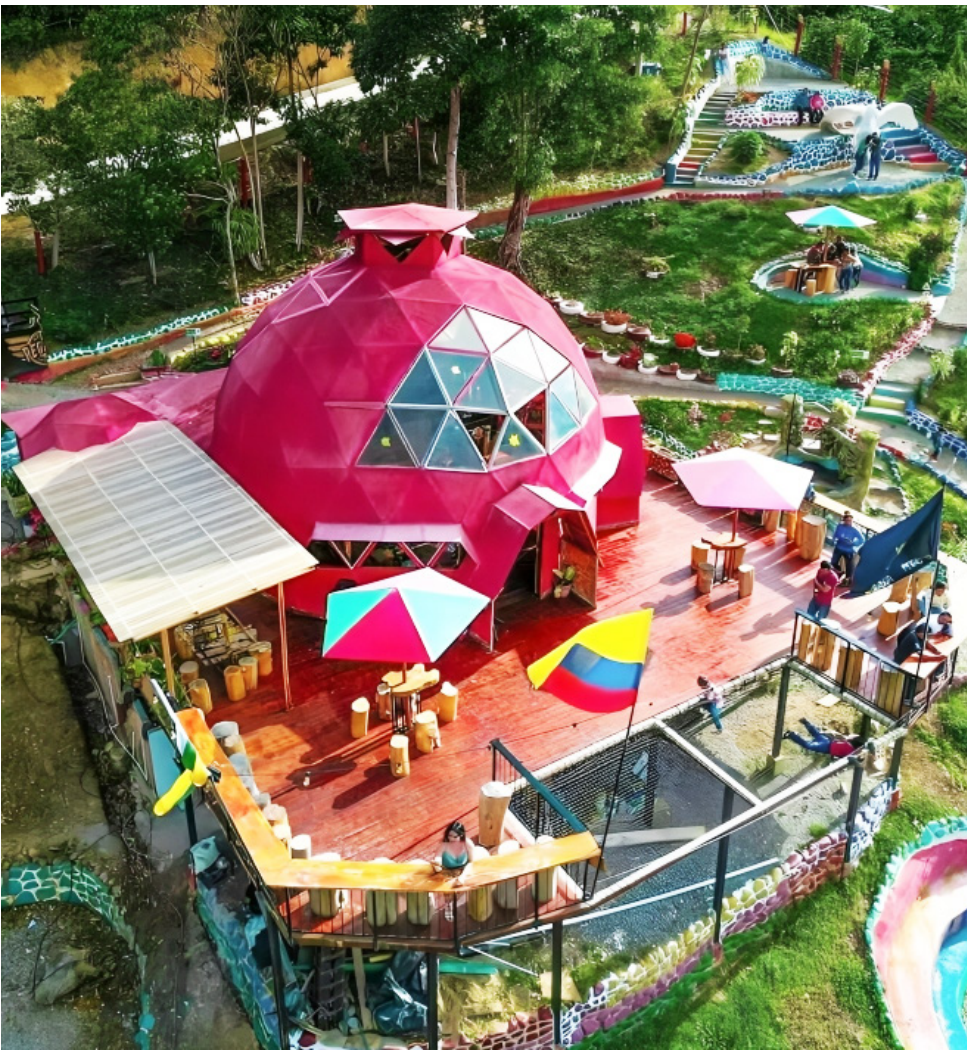
Huilenses viajando dentro del departamento es fundamental para dinamizar la economía.

La seguridad ha sido uno de los elementos que más ha influido en la decisión de viaje dentro del departamento. La percepción en zonas rurales se ha visto afectada por fenómenos como extorsión carcelaria, intimidaciones a empresarios y presencia de grupos armados en áreas aisladas.