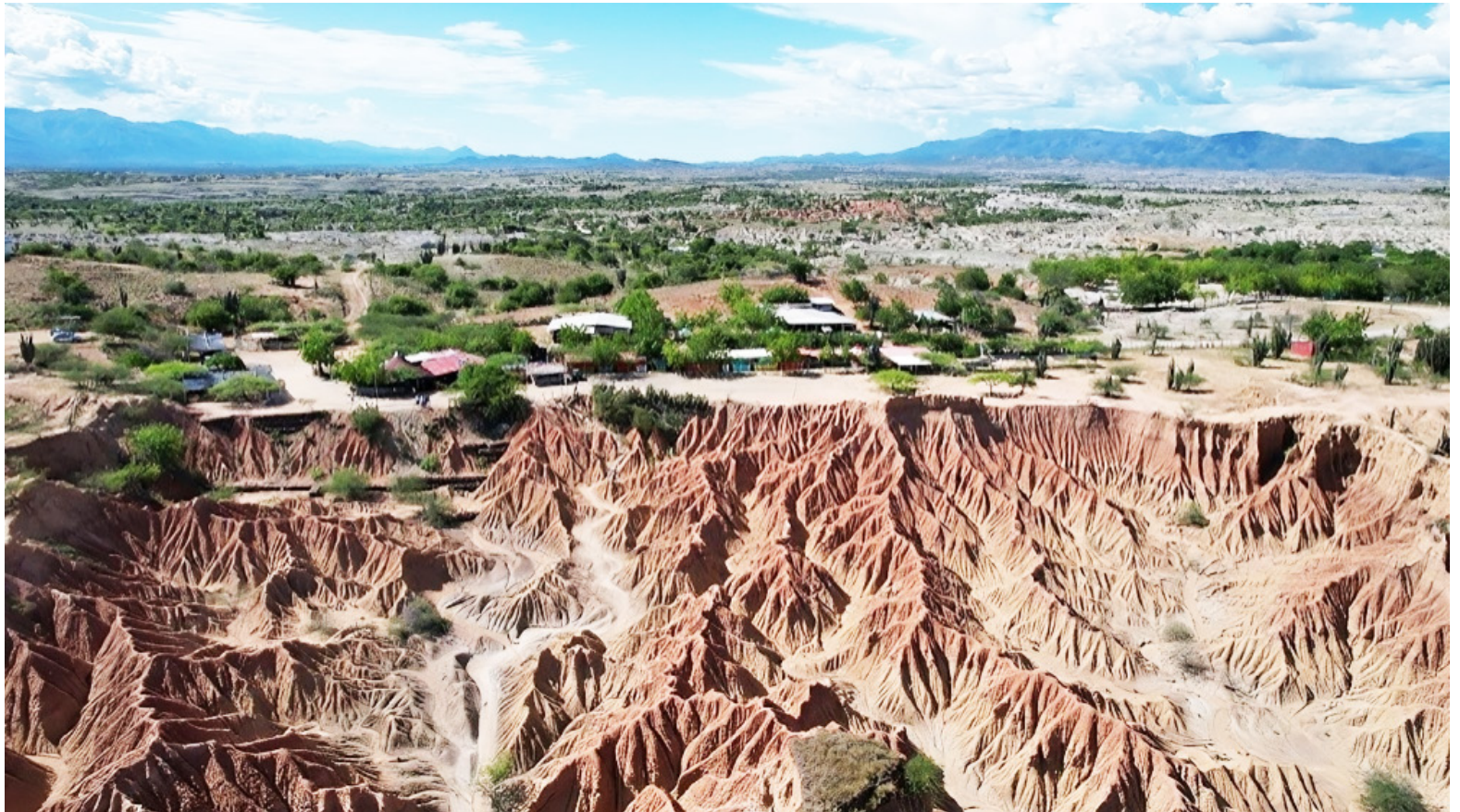
Huila se prepara para vivir una de las temporadas turísticas de diciembre y enero más dinámicas de la última década.

El comportamiento del turismo en el Huila ha mostrado una recuperación progresiva tras las afectaciones causadas por la desaceleración económica de los últimos años, las tensiones sociales y los desafíos de seguridad que impactaron zonas rurales y corredores viales estratégicos. Sin embargo, el 2025 se ha consolidado como un año de reactivación, especialmente en municipios con vocación turística como Neiva, San Agustín, Rivera, Villavieja, Paicol y La Plata.