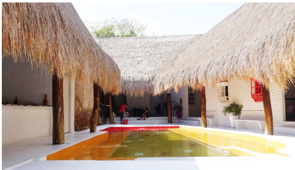
La seguridad ha sido uno de los elementos que más ha influido en la decisión de viaje.

Los atractivos del Parque Arqueológico, las rutas de naturaleza, la gastronomía local y la hotelería campestre consolidan a este destino como uno de los preferidos de quienes buscan descanso, cultura y experiencias de aventura en el sur del país.