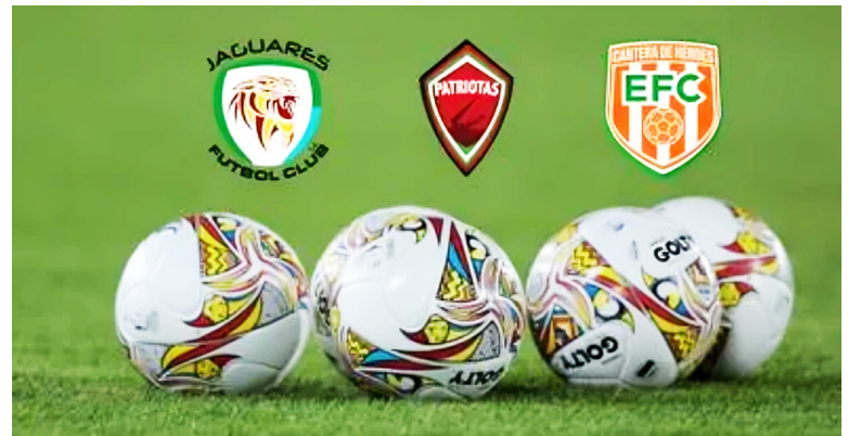
Clubes como Envigado, Unión y Patriotas siguen de cerca el posible cupo en la A.

Lo único claro es que los días 11 y 12 de diciembre serán determinantes para el destino de varios clubes y, quizá, para el rumbo de toda la liga.