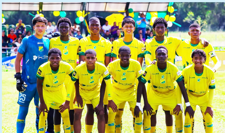
Atlético Huila sub 15 jugó el partido de ida en su sede de Rivera.

El resultado permitió cerrar el compromiso con ventaja mínima, pero valiosa, teniendo en cuenta que la serie se definirá fuera de casa en el duelo de vuelta.