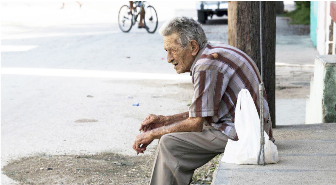
El cupo con el que cuenta el municipio es cerca de 60.

“Eso también es lo otro, no solamente es la familia, a veces la que maltrata, sino que también a veces suele evidenciarse un maltrato institucional por algunas EPS que le niegan o ignoran las