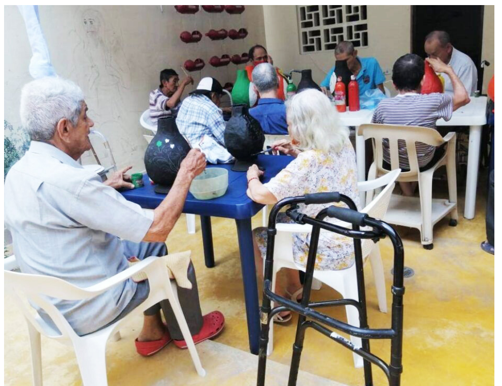
Autoridades apoyan a los adultos mayores.

“Son alrededor de 300 los casos identificados, esto no quiere decir que se deba bajar la guardia ni que se deba quitar la responsabilidad que se tiene como sociedad, familia y Estado en el cuidado de los adultos, nosotros somos una población que está mostrando un acelerado envejecimiento pobla-