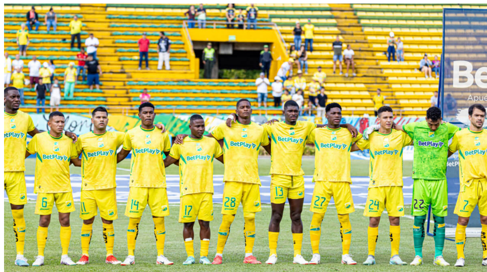
Atlético Huila define su futuro entre la mudanza y la polémica.

La suspensión del reconocimiento deportivo al Pereira y la posible mudanza del Huila pondrán a prueba a la Dimayor en una asamblea que promete decisiones históricas.