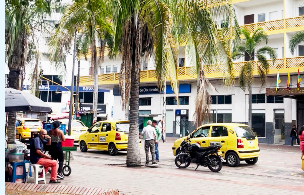
Comercio y empleo en Neiva, atentos al ajuste del salario mínimo.

Por su parte, los gremios empresariales han mantenido su postura de respaldar ajustes que estén alineados con la productividad. Consideran que un incremento superior podría afectar a sectores que