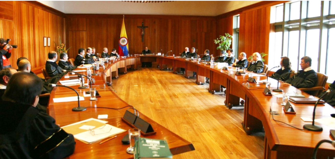
La Corte Constitucional ordenó rehacer el proceso con enfoque de género y una valoración completa de las pruebas.

La Corte reafirmó que en asuntos que impliquen posibles violencias de género, las autoridades deben evitar la neutralidad que perpetúa estereotipos, y actuar con diligencia reforzada considerando la especial vulnerabilidad de las mujeres.