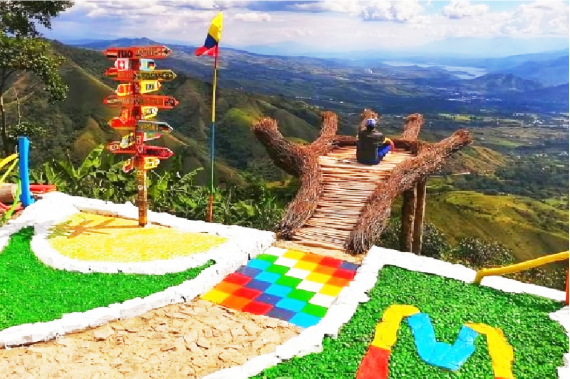
Tanto la Policía como el Ejército han articulado operativos para garantizar la tranquilidad de los viajeros.

“Diciembre y enero son meses de oportunidades. Necesitamos que los huilenses y turistas compren aquí, viajen aquí y vivan aquí sus experiencias. Hacer grande al Huila depende de todos”, concluyó Gechem.