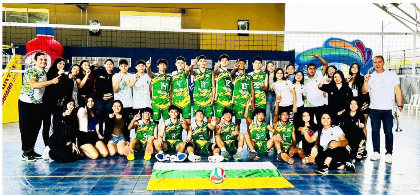
El equipo masculino Sub 15 se había consagrado recientemente campeón del Torneo Nacional Interligas.

El evento tenía como sede principal el Coliseo Menor de Voleibol, un escenario que había sido intervenido recientemente para corregir las fallas de energía y agua ocasionadas por un daño en su transformador. Las adecuaciones quedaron listas antes del inicio previsto de la competencia.