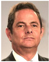
Germán Vargas Lleras

Los escándalos que día a día marcan el paso de este nefasto gobierno no pueden hacernos perder de vista la decisión inequívoca del señor Petro de atropellar el Estado de derecho, la justicia y sus instituciones. Ya nadie se sorprende de que el señor Petro y sus funcionarios controviertan los fallos, no los acaten, ni mucho menos los cumplan. No les importa que los declaren en desacato ni las sanciones que de esa conducta se puedan derivar. Con esta forma de gobernar buscan erosionar la legitimidad del Poder Judicial y fracturar la independencia de los poderes públicos. Y lo están consiguiendo.