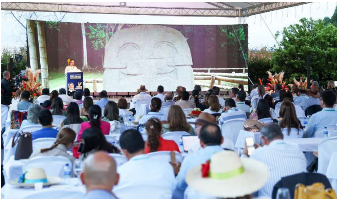
Encuentro Nacional de Género de la Rama Judicial se realizó en San Agustín, escenario que celebra 30 años como Patrimonio de la Humanidad.