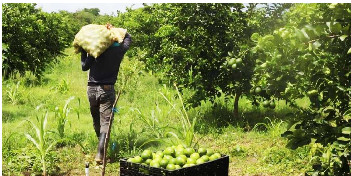
Muchas personas han dejado abandonado sus cultivos.

“Desafortunadamente, en el departamento del Huila no hay una planta donde podamos maquilar, pues esto se va para el Eje Cafetero, Tolima o Valle del Cauca, que es donde se ha venido trabajando últimamente la maquila de este producto. Y de allí, pues de allí parte hacia el comercializador que es el quien lo lleva a Países Bajos”.