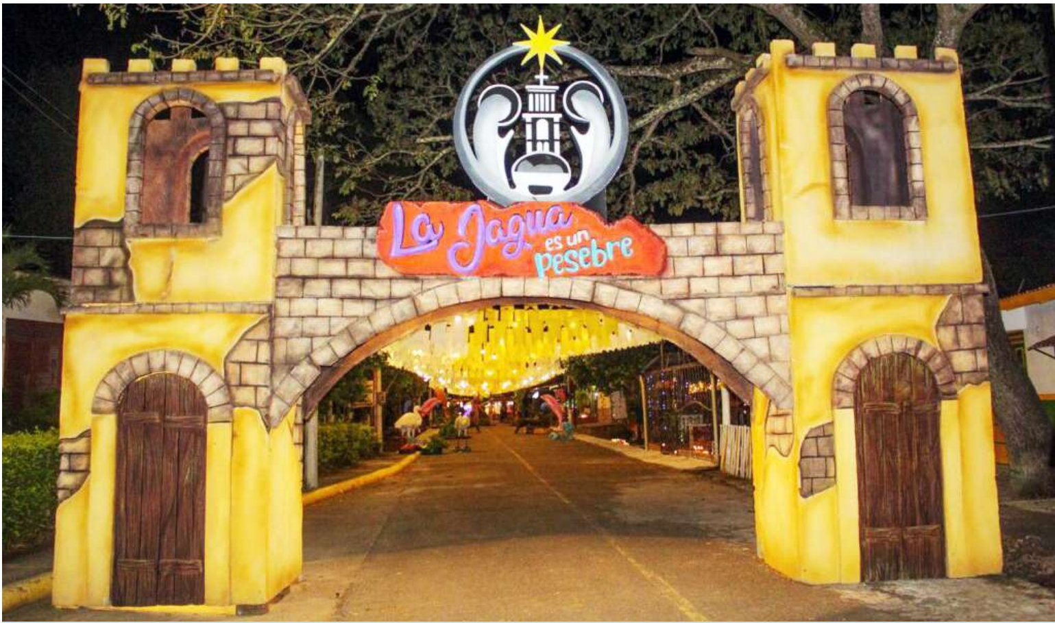
La Jagua se posiciona como uno de los pesebres más hermosos del Huila.

“Hemos logrado tener una dinámica muy importante, primero, trabajar con la Junta de Acción Comunal y segundo, va a tener 13 estaciones nuestro pesebre, hemos ampliado más la ruta, hemos continuado con la