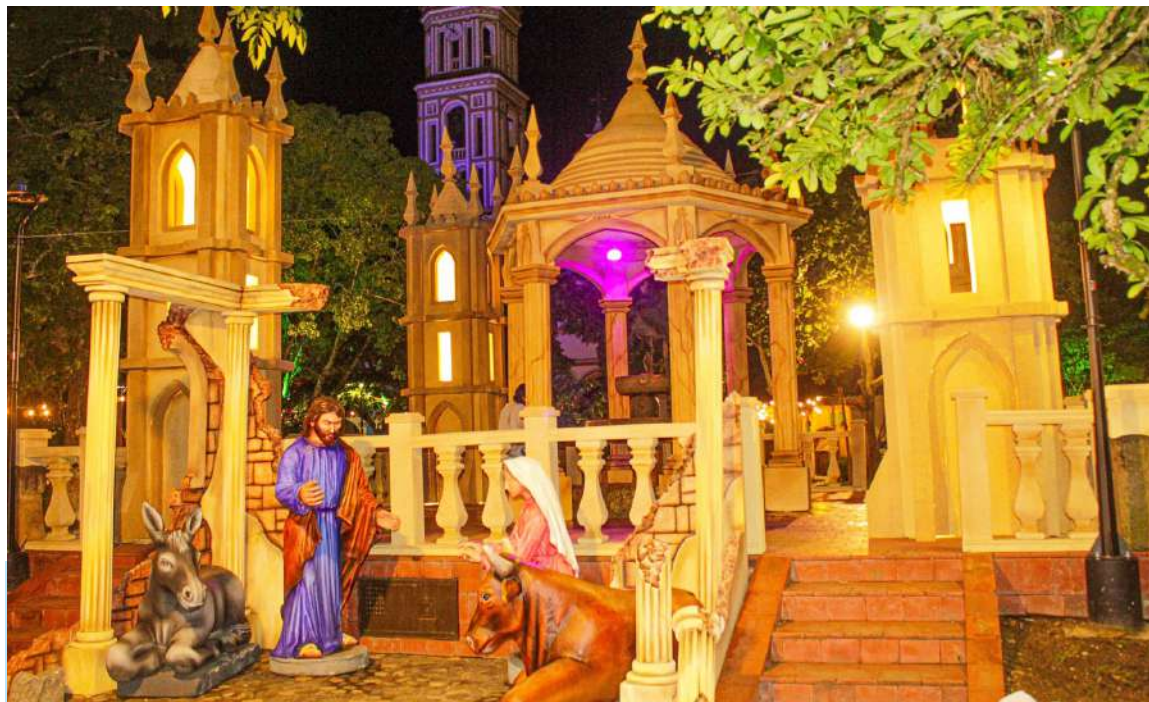
Estará desde el 16 de diciembre y que se extenderá hasta el 12 de enero del próximo año.

Esta nueva versión se inaugurará el 16 de diciembre, el primer día de la novena y van hasta el 12 de enero, realizarán cada día la novena del 16 al 24, donde será un evento social, familiar y participativo para todos, tanto propios como visitantes.