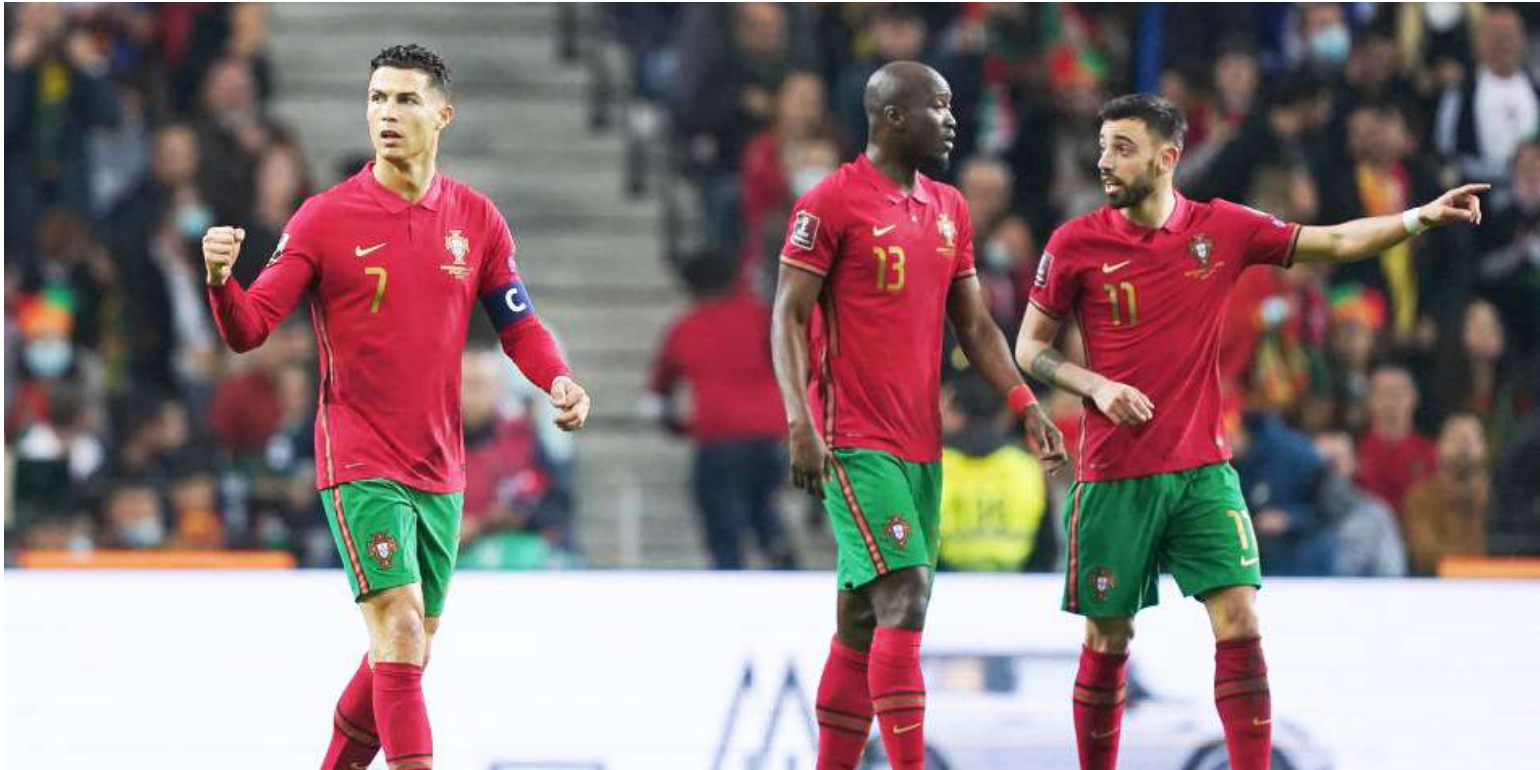
Colombia comparte el grupo K con Portugal, Uzbekistán y el ganador del repechaje intercontinental A.

>> El sorteo del Mundial 2026 dejó oficialmente definidos los doce grupos de una edición que será inédita por su formato de 48 selecciones. El evento se disputará en Estados Unidos, México y Canadá entre el 11 de junio y el 19 de julio