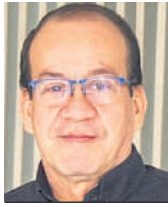
JOSÉ ELISEO BAICUÉ PEÑA

Luego de los resultados de una encuesta dentro de la campaña política para elegir al próximo presidente de Colombia, el temario nacional en medios de comunicación, redes sociales y demás círculos del país, gira en torno a esa medición.