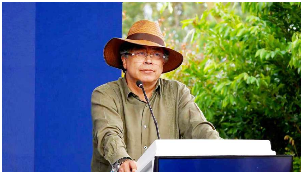
San Agustín celebra 30 años como Patrimonio Mundial de la UNESCO.