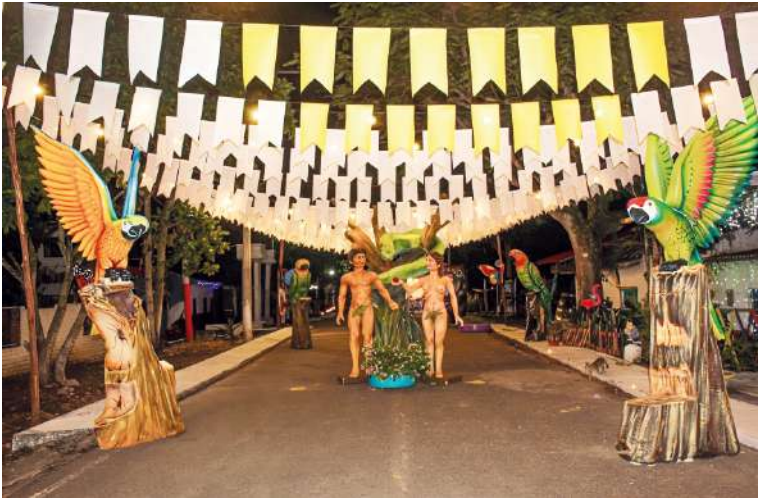
Las autoridades locales esperan tener entre 250.000 y 300.000 visitantes.

la organización, tanto de la ruta, como de los puntos de servicio, como también de los puntos de comercializaciones que eso es lo que permite lograr tener un buen ambiente para hacer de este evento algo muy familiar, algo muy autóctono, algo muy regional y lo más importante, que se continúe con la magia de nuestro centro poblado”, sostuvo el mandatario garzoneño.