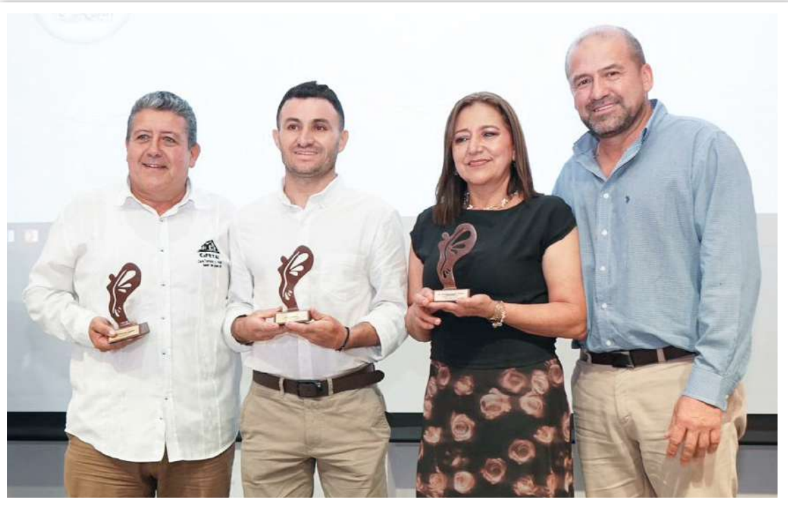
Categoría por el medio ambiente.

Premios Alas reconocieron a empresas que están impulsando la transformación tecnológica y energética en el Huila.