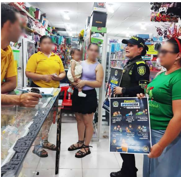
Autoridades locales desarrollan campañas de prevención para evitar que los derechos de niños y adolescentes sean vulnerados durante la temporada decembrina.

El boletín del DANE detalla que la población de 5 a 14 años tiene una tasa nacional de trabajo infantil de 1,1 %, mientras que en el grupo de 15 a 17 años el indicador asciende a 8,7 %. El comportamiento por edad con-