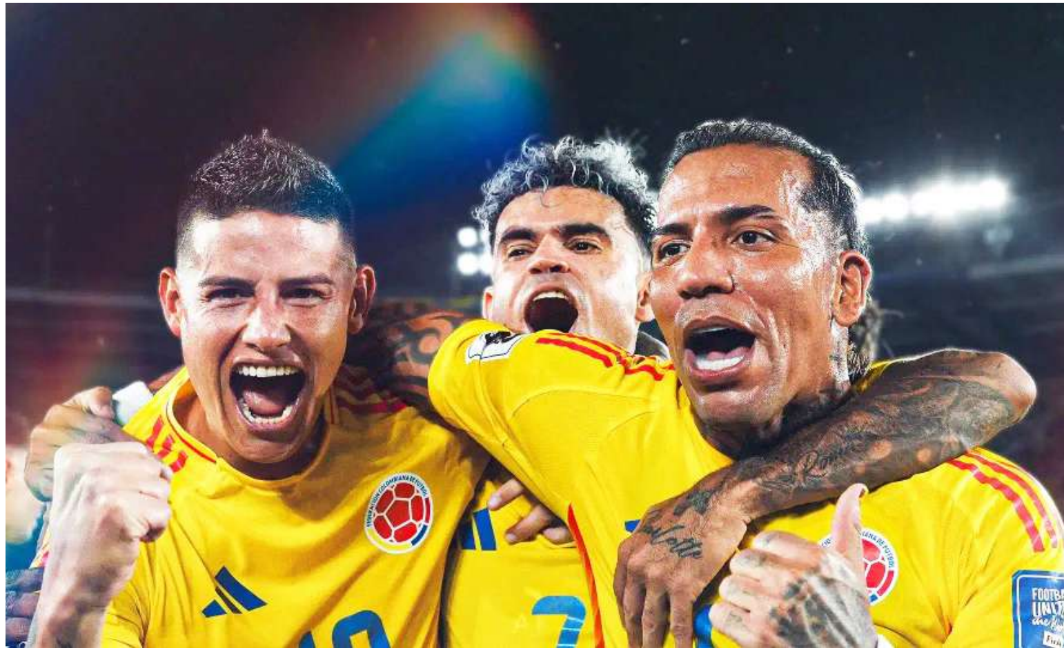
Tras la realización del sorteo del Mundial de fútbol 2026, Colombia quedó ubicada en el Grupo K.

Canadá asumió su condición de anfitrión en el grupo B, acompañado por Suiza, Qatar y el clasificado desde el repechaje