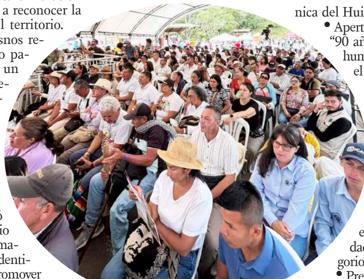
Isnos y San Agustín serán epicentro de actividades culturales y académicas.

El gobernador Rodrigo Villalba Mosquera subrayó que este aniversario es también un llamado a fortalecer la identidad huilense y a promover el patrimonio como motor de desarrollo sostenible para la región.