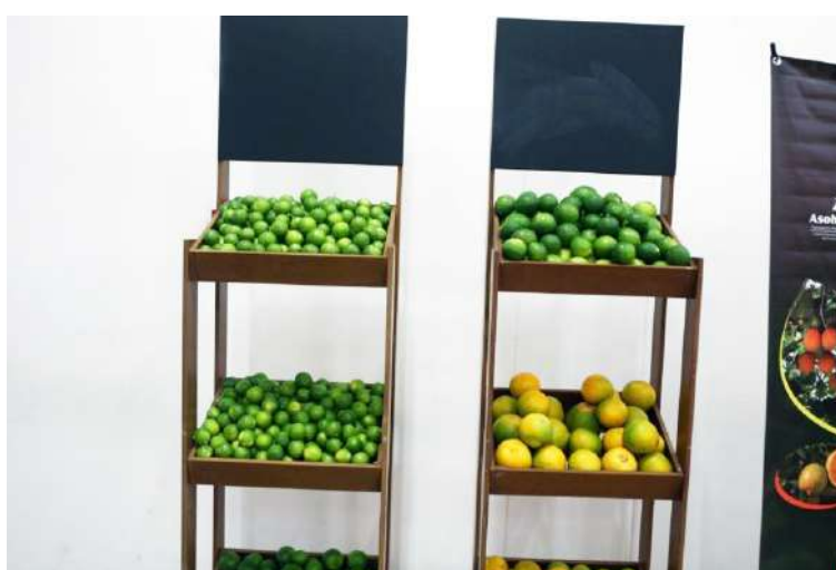
Los municipios productores en el Huila son Paicol, El Pital, Villavieja, La Plata, Tesalia, y Guadalupe.

no no solo al consumo nacional, sino también a mercados de Europa y Estados Unidos. Los municipios productores en el Huila son Paicol, El Pital, Villavieja, La Plata, Tesalia, y Guadalupe.