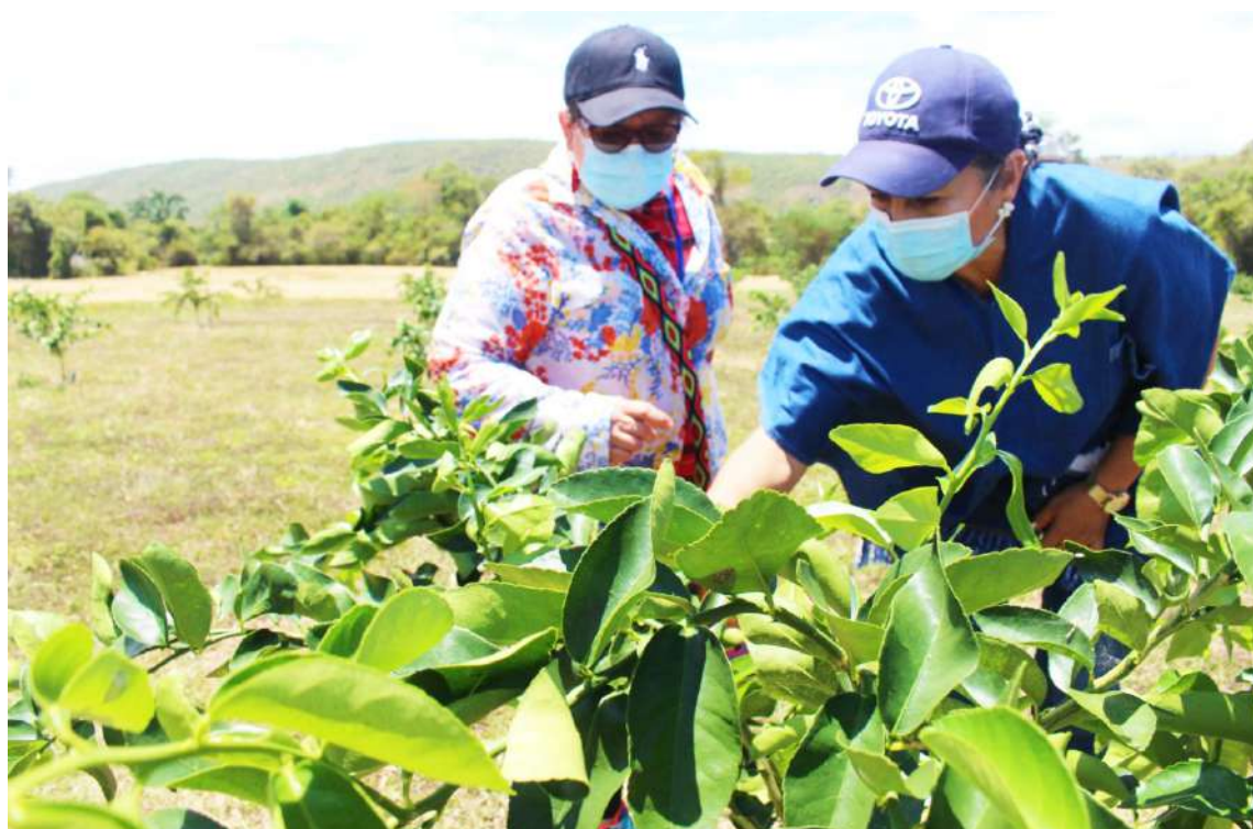
La intermediación y los bajos precios los está agobiando.

La producción anual es cercana a las 28.000 toneladas, con desti-