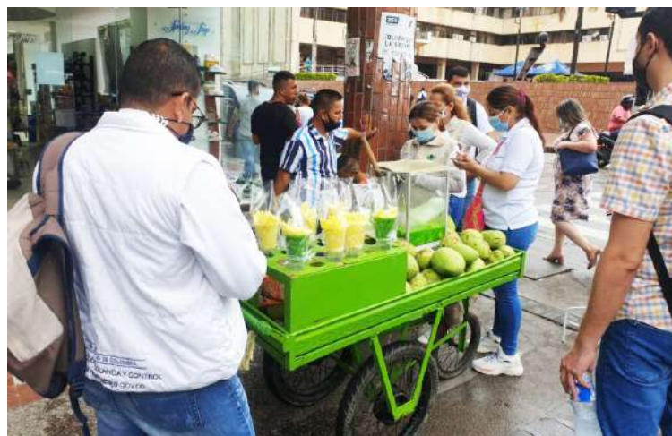
Los recorridos institucionales buscan identificar situaciones de riesgo y orientar a las familias que recurren al trabajo informal para sostenerse.

mente, la actividad de menores se vuelve más notoria en diciembre. Las ventas de dulces, los espectáculos callejeros, el acompañamiento a adultos en la venta de productos o la participación en actividades de reciclaje se incrementan. Aunque las autoridades realizan operativos de sensibilización y remisión a programas institucionales, la constante afluencia de personas dificulta la intervención.