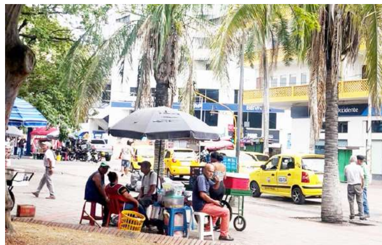
Vendedoras informales afirman que muchas madres llevan a sus hijos a trabajar por falta de opciones de cuidado durante las vacaciones escolares.

El boletín técnico del DANE sobre trabajo infantil correspondiente al periodo octubre a diciembre de 2024 confirma que el país