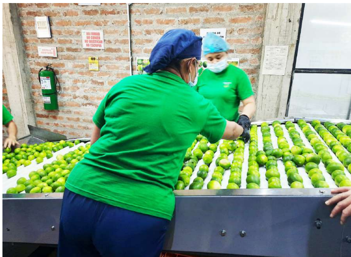
Los precios del limón evidencian la gravedad del problema.

Como lo explicó el citricultor, esto contrasta con el valor internacional, donde el producto orgánico tipo exportación se paga entre 0,80 y 0,90 dólares