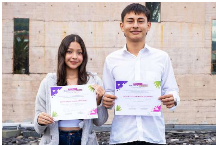
Los tres ganadores huilenses recibieron su reconocimiento en el Centro de Memoria Histórica.

Tres escritores huilenses hacen parte de los 40 ganadores del Concurso Nacional de Escritura Historias de Paz 2025, un certamen que reunió a más de 3.000 participantes y que reconoce la palabra como herramienta para construir memoria, diálogo y reconciliación.