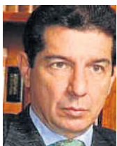
JOSÉ FÉLIX LAFAURIE RIVERA