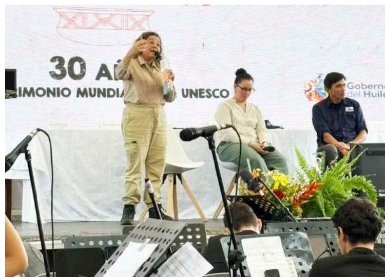
La estatuaria megalítica, símbolo ancestral del Alto Magdalena.

En Isnos, como parte de la celebración por los 30 años de la declaración UNESCO en Alto de los Ídolos y Alto de las Piedras, se desarrollarán: