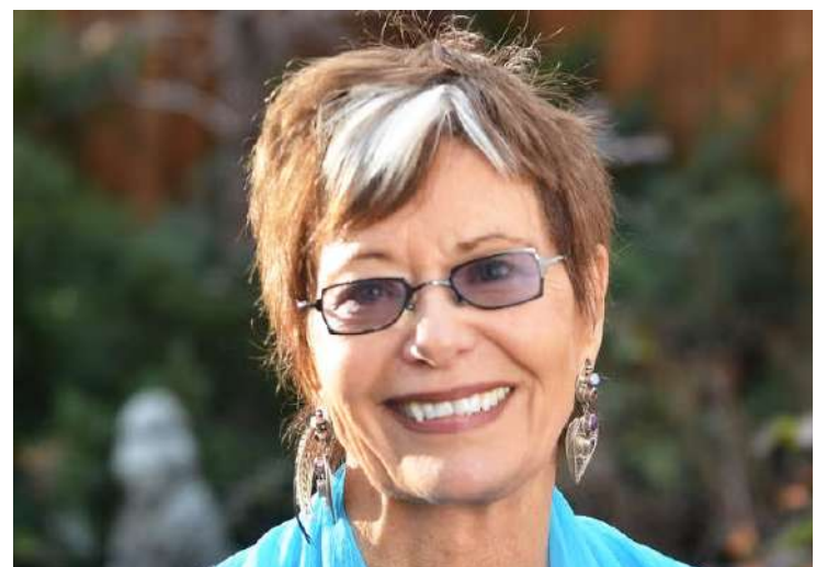
Figura de la semana

Vea columna completa en www.diariodelhuila.com