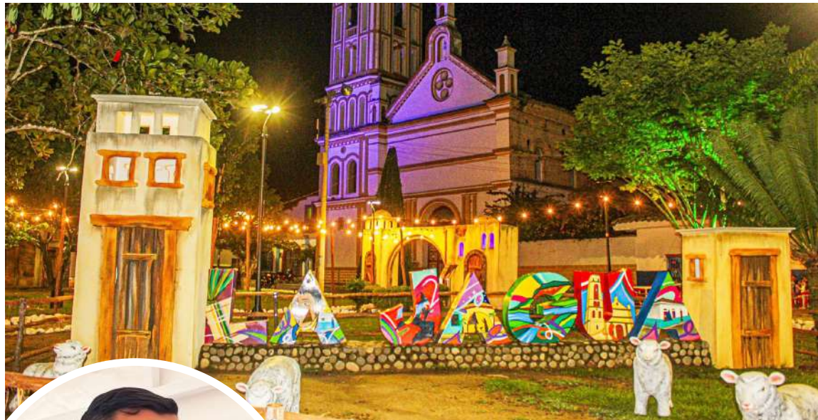
Esta será la VIII versión de La Jagua es un Pesebre.