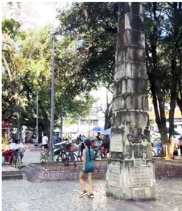
Niños y adolescentes son vistos con mayor frecuencia en las calles de Neiva durante diciembre, especialmente en zonas de alto flujo comercial.