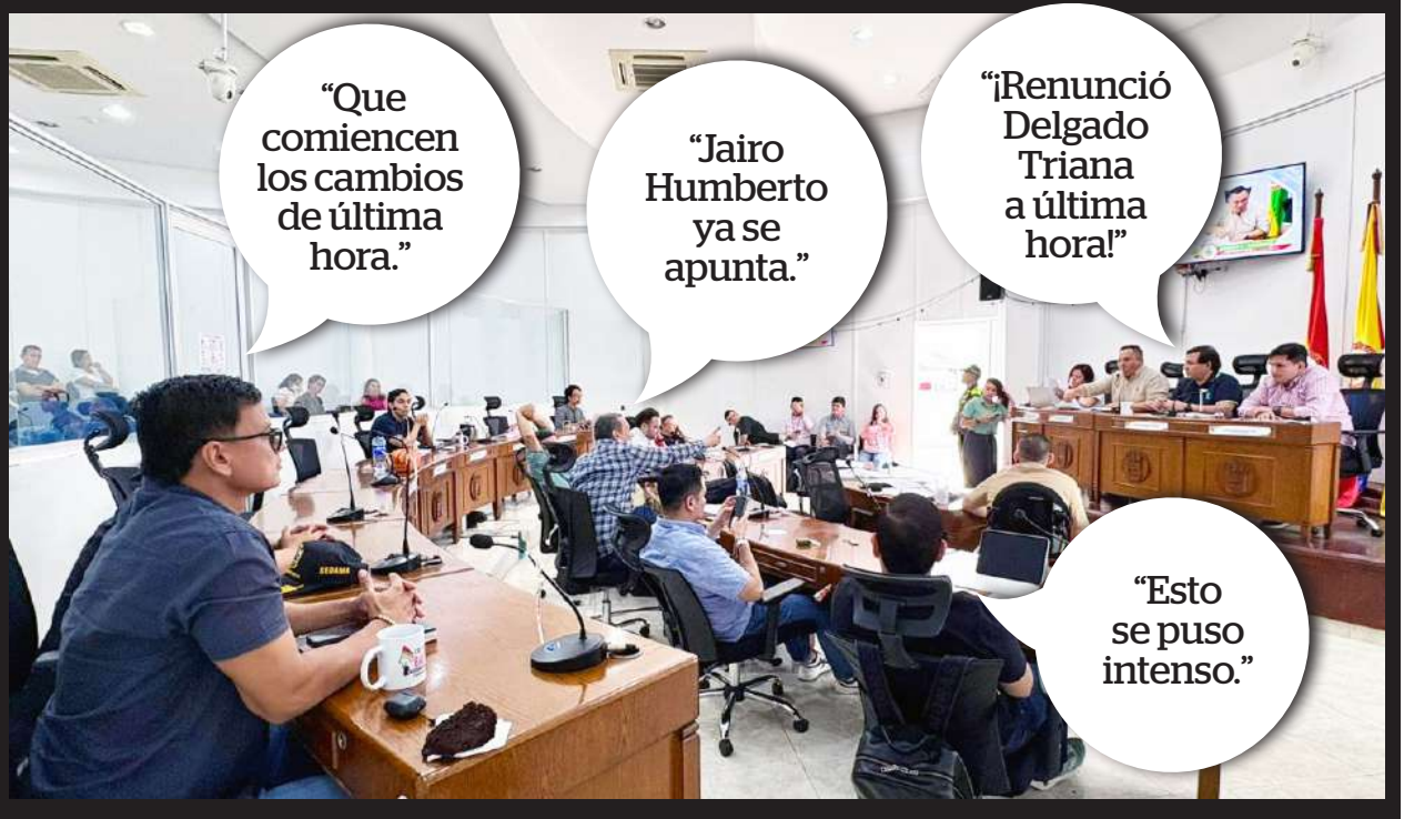
IMAGEN DE LA SEMANA