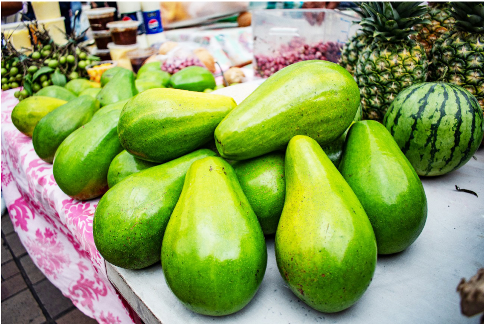
38 productores locales participaron del segundo mercado campesino realizados en el 2025

El dinero no se queda en grandes cadenas de distribución ni sale del departamento: circula y se reinvierte en la economía rural del Huila. Los $12,6 millones obtenidos se destinan a la educación de los hijos, la compra de semillas, la mejora de la infraestructura productiva y el consumo local, generando un efecto multiplicador vital para