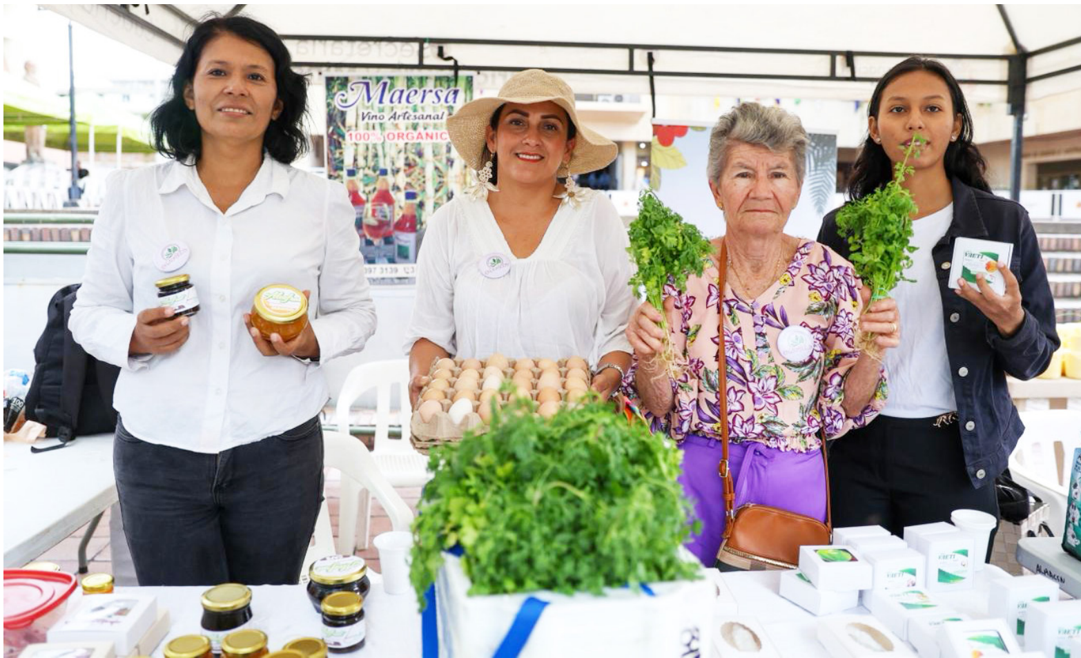
Mercado campesino interinstitucional, desarrollado en el Parque Santander de Neiva.

■ El Parque Santander de Neiva se llenó de aromas, colores y esperanza. En solo siete horas, 38 productores rurales lograron ventas por más de $12,6 millones en el segundo Mercado Campesino Interinstitucional del año, una estrategia que elimina intermediarios y devuelve al campo huilense lo que le pertenece: dignidad, ingresos justos y reconocimiento.