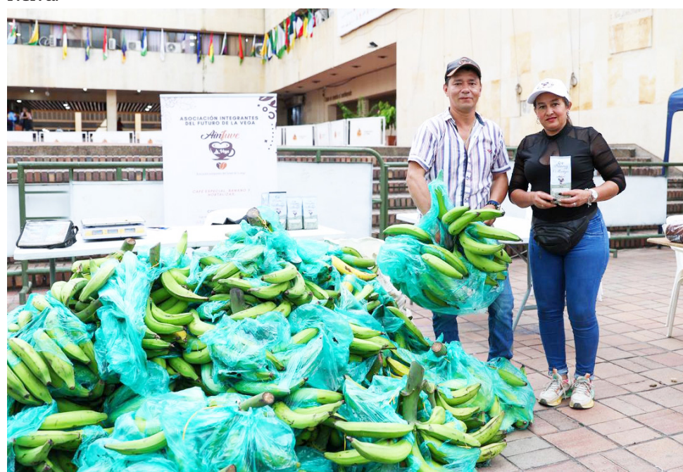
12,6 Millones lograron reunirse en ventas.

Esta cifra, obtenida en apenas siete horas, confirmó a los organizadores que, aunque no se trata