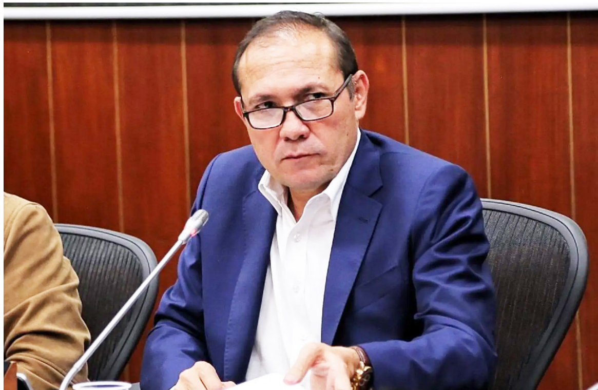
El ministro de Trabajo, Antonio Sanguino, es investigado por presunta participación en política.