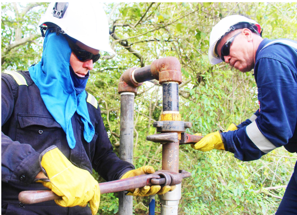
Trabajadores han sufrido de amenazas.