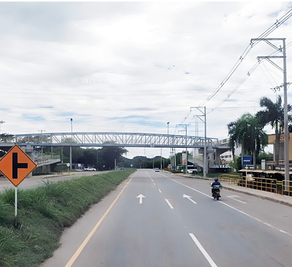
La comunidad reclamaba iluminación en este sector.

“Desde que se adjudicó en el año 2015 el contrato de concesión para en este caso llevar a cabo el proyecto de la doble calzada de la autopista Neiva Girardot, la comunidad del sector de Amborco que reúne tanto conjuntos residenciales, entre otros establecimiento y además de los barrios propiamente como Santa