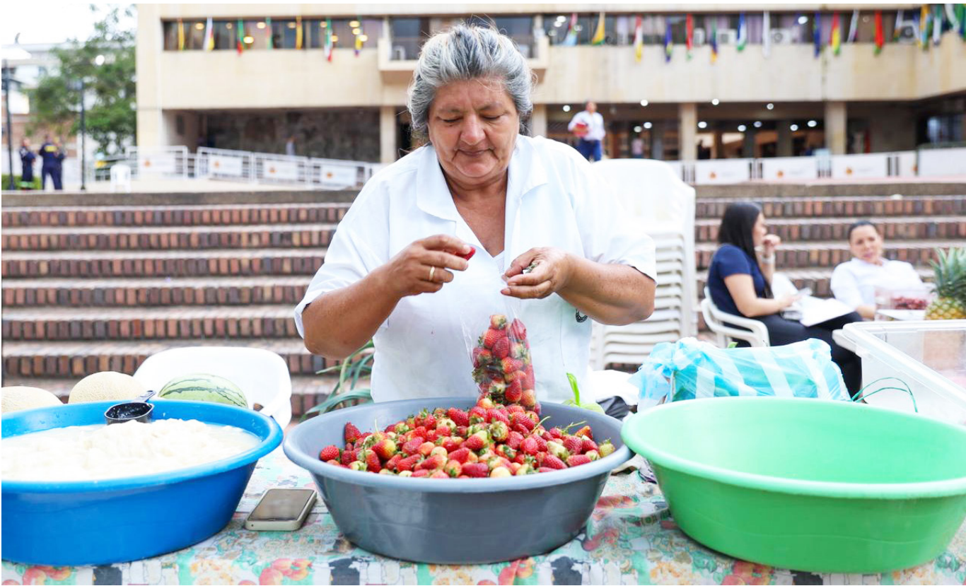
La gobernación del Huila, se comprometió a invertir en la logística.

medianos y grandes, pero los pequeños son los que sacan productos cada mes o cada dos meses. Ellos no tienen canales de comercialización estables, como supermercados o restaurantes. Por eso buscan nuestro apoyo para que lo que producen pueda ofertarse en los mercados campesinos.”