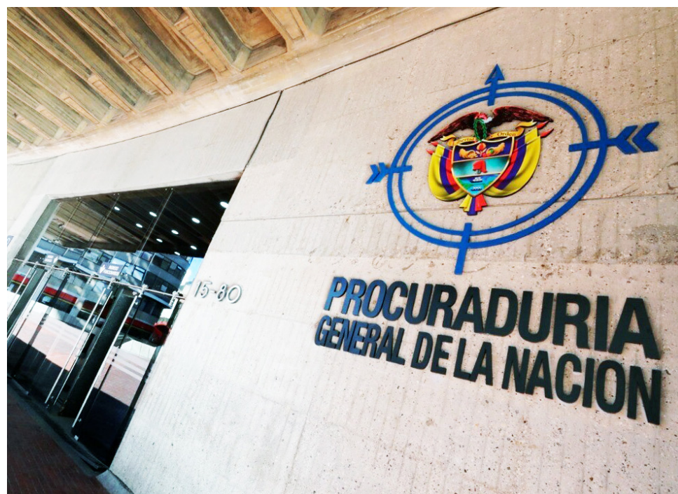
La Procuraduría avanza en la indagación previa contra el titular de la cartera laboral.

Mientras avanza la investigación, el caso pone nuevamente sobre la mesa el debate acerca de los límites de la expresión personal de los funcionarios públicos en redes sociales y la delgada línea entre la opinión política y la participación prohibida por la ley.