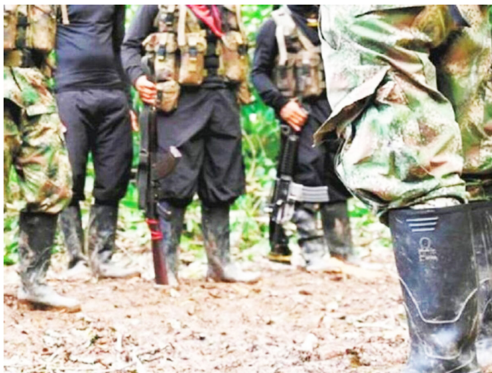
Los grupos al margen de la ley estarían amedrentado a los trabajadores.

jo agropecuario que se ve sumamente afectado por el tema de violencia en los territorios, son ellos, la población campesina, quienes han venido presentando todas estas situaciones y obviamente se vienen afectando de manera directa por la violencia en los territorios, desplazándose a las cabeceras urbanas tanto en La Plata como en los diferentes municipios y obviamente a Neiva que es un receptor de la población desplazada por la violencia”, dijo el enlace de Derechos Humanos de la Central Unitaria de Trabajadores CUT, Huila.