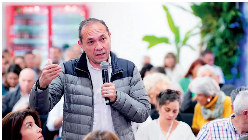
El caso reaviva el debate sobre los límites de la expresión política de los funcionarios públicos.

Entre las primeras actuaciones, el procurador delegado ordenó oficiar al Ministerio de Trabajo para que aporte al expediente el decreto de nombramiento, el acta de posesión, la hoja de vida y la certificación laboral del ministro Antonio Sanguino. Además, se dejó constancia de que contra la decisión de apertura no procede recurso alguno.