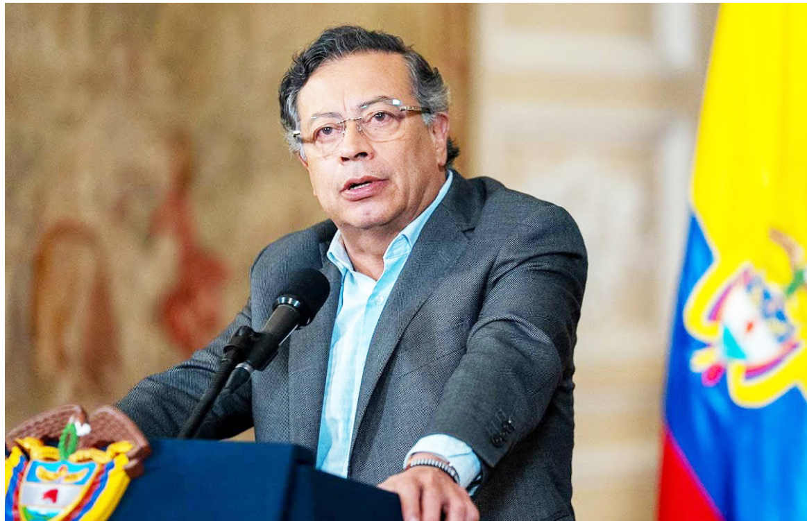
El presidente Gustavo Petro fue denunciado ante la Comisión de Acusaciones por presunta falsedad en documento público.