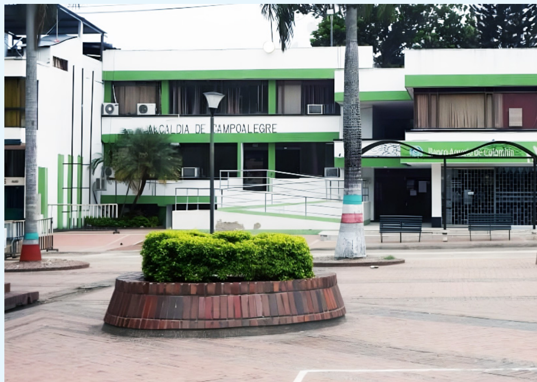
La administración de Campoalegre también se ha visto involucrada en escándalos.

cisión judicial y, por tanto, requiere de un examen detallado sobre la posible configuración de una vía de hecho judicial o la presencia de defectos que justifiquen la intervención del juez constitucional. De igual forma, se ordenó la