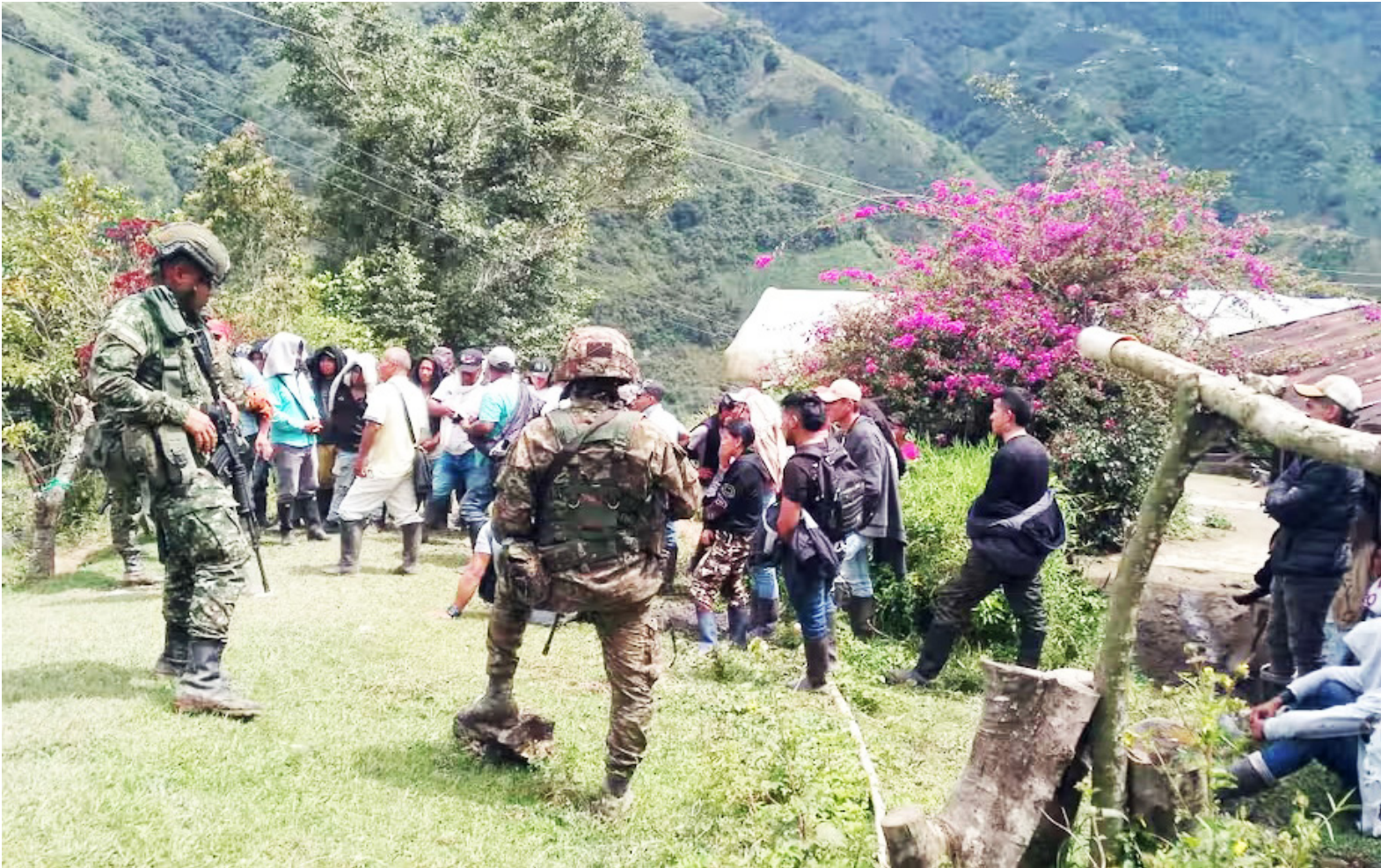
La situación de orden público en el departamento del Huila continúa dejando graves secuelas.

Esta situación también está afectando a los trabajadores de la electrificadora del departamento del Huila, a los empleados del Sena y afiliados a las organizaciones sindicales como SINDESENA, ANTHOC, Y ADIH.