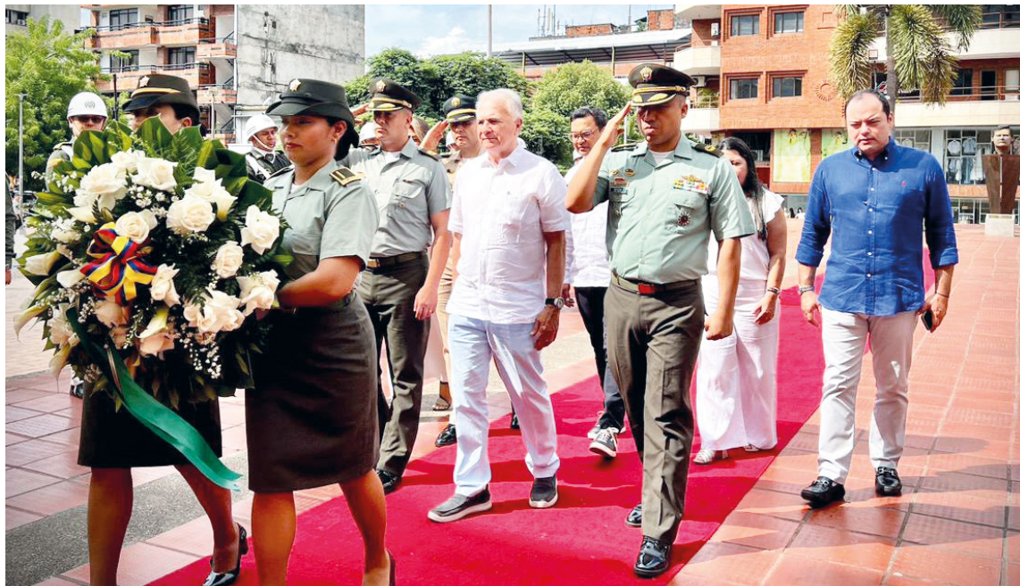
La Policía Nacional de Colombia conmemora 134 años de servicio al país, reafirmando su compromiso con la integridad, la disciplina y la protección de los ciudadanos.