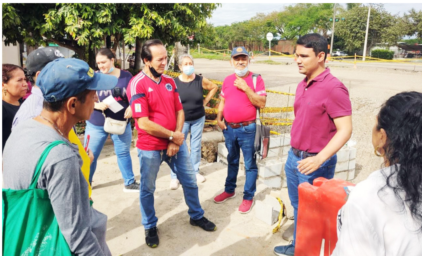
Reunión del personero de Palermo con la comunidad en el año 2022.

decisión, el alto tribunal dispone que la Agencia Nacional de Infraestructura (ANI) adelante la construcción e instalación del sistema de alumbrado público en su totalidad.