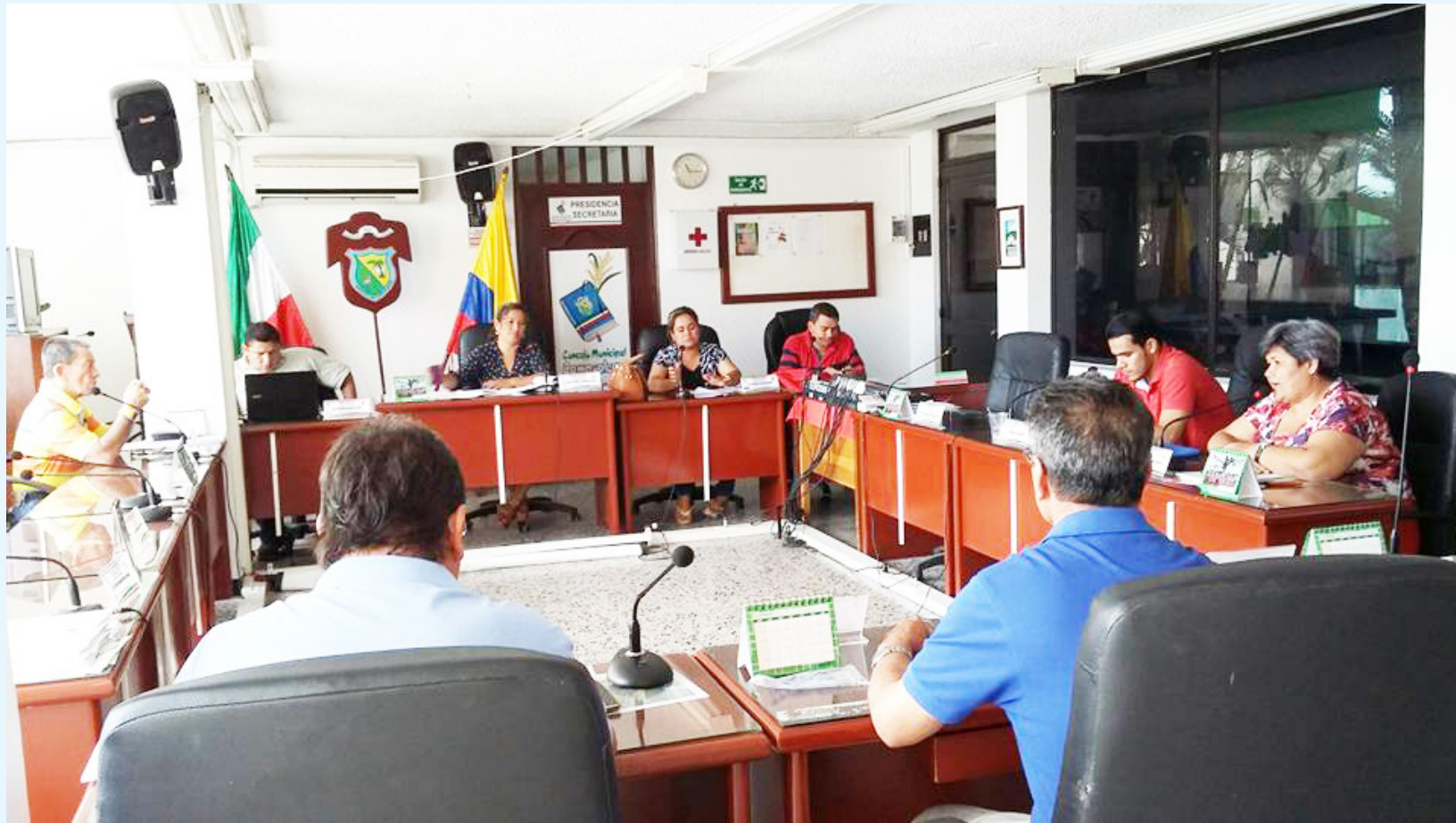
Campoalegre atraviesa un periodo de reconfiguración institucional tras la salida de varios de sus concejales por decisiones judiciales y disciplinarias.

El exconcejal argumenta que dicha decisión vulneró sus derechos fundamentales al debido proceso, a elegir y ser elegido, al acceso a cargos públicos, a la participación política, al buen nombre, a la igualdad y a la dignidad humana. Según el demandante,