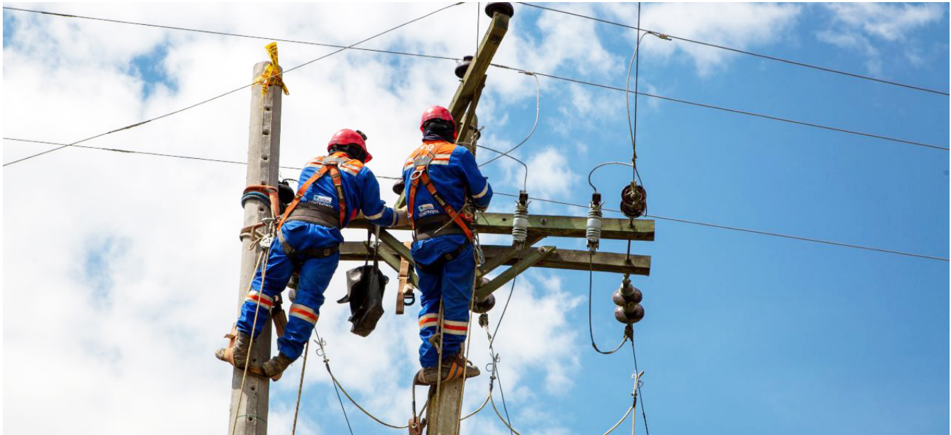
Trabajadores del Sena, electrificadora, y sector de la salud son los más afectados.

a los accidentes o enfermedades laborales tradicionales, sino que hoy también incluyen amenazas, intimidaciones y coacción por motivos laborales, sindicales o comunitarios. Esta dimensión pone en evidencia que la protección del trabajador debe entenderse de manera integral, incluyendo no solo condiciones de trabajo seguras en términos físicos, sino también un entorno laboral libre de violencia, presión y riesgo para la integridad personal. Para que el Huila avance hacia un desarrollo sostenible con empleo digno, es imperativo que se aborden las amenazas como parte de la agenda laboral. Solo así podrá garantizarse que el trabajo no solo sea fuente de sustento, sino también de seguridad, dignidad y tranquilidad para quienes lo ejercen a diario en todas las zonas del departamento, es el llamado que realizan desde la CUT.