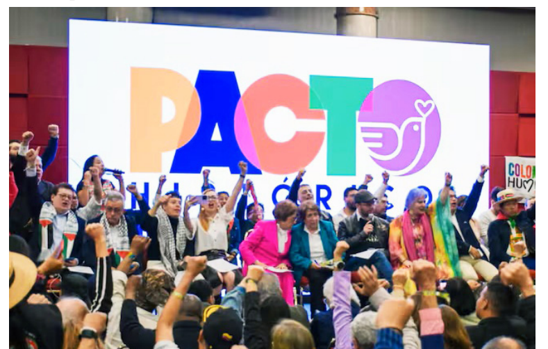
Flórez respondió que el Pacto debe mantenerse como un movimiento plural y rechazó los ataques personales.

El intercambio ha generado gran inquietud dentro del Pacto Histórico, especialmente en un momento en que la coalición busca consolidar su estructura nacional de cara a las próximas elecciones. Las divisiones internas y las denuncias de corrupción amenazan con debilitar la imagen de unidad que el bloque de gobierno intenta proyectar.