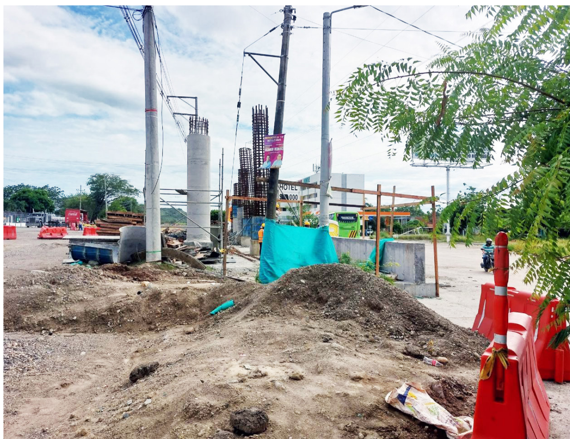
Cuando estaban en las obras en el año 2022.

El sector Amborco, por su ubicación estratégica y su vocación industrial, debería contar con una infraestructura de alumbrado público de alta calidad. Sin embargo, la insuficiente iluminación nocturna representa un obstáculo para su desarrollo seguro, eficiente y humano. Mejorar el alumbrado no es solo una cuestión técnica, sino una inversión en seguridad, movilidad, calidad de vida y competitividad.