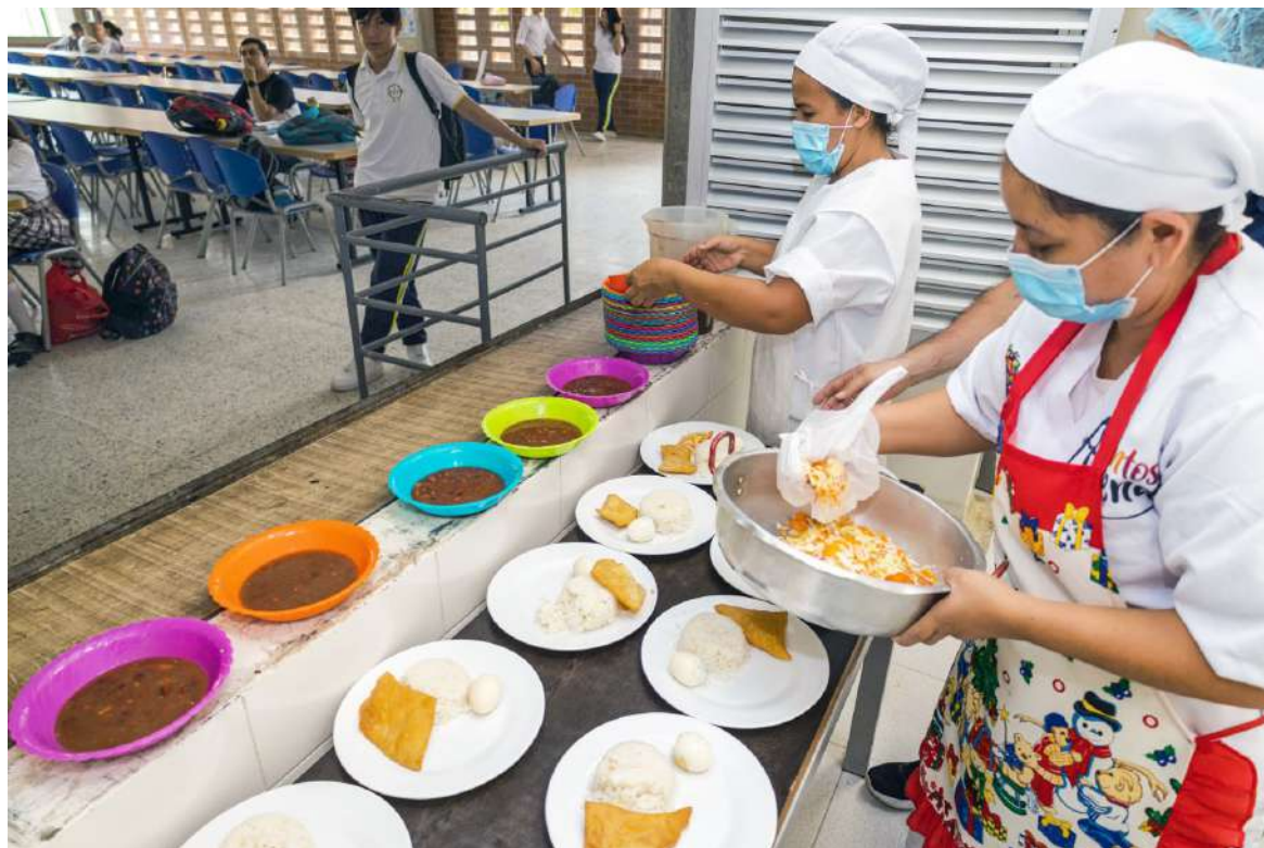
Buscan garantizar la entrega de raciones desde el primer día del calendario escolar.