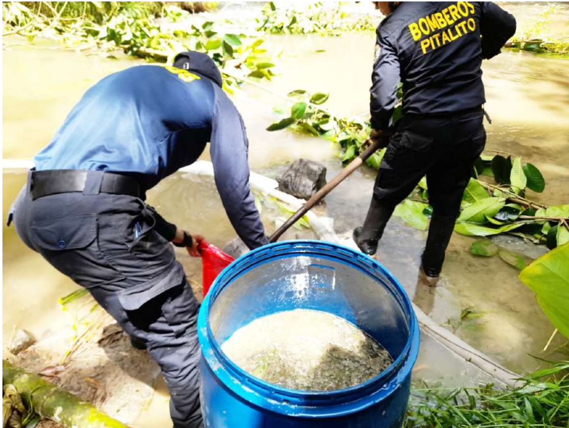
Volcamiento de camión cisterna dejó sin servicio de agua potable a Pitalito