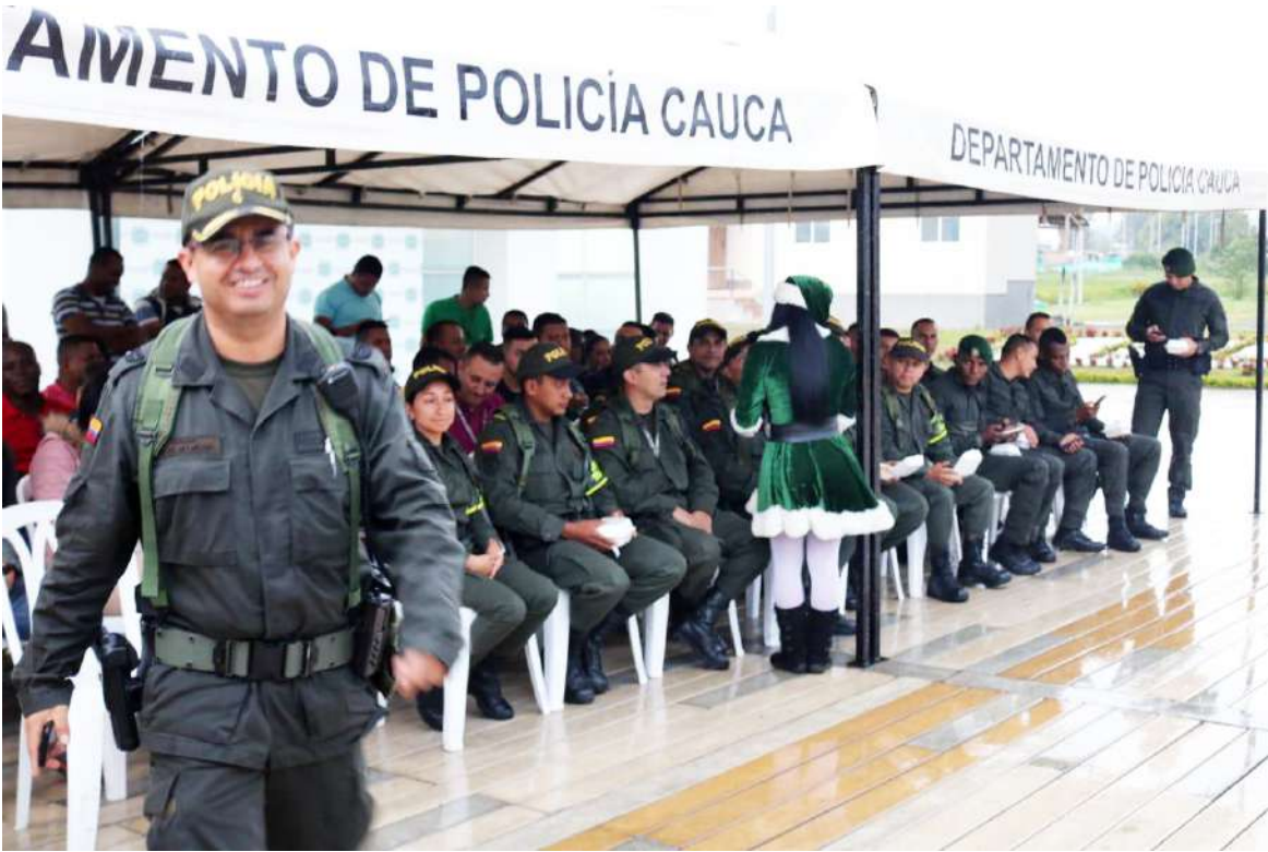
Ha estado al mando en diferentes departamentos.

Yo tengo la fortuna de que me casé con una hija de esta región entonces, puedo decir que conozco y fui adoptado y ello me ha facilitado, es muy enriquecedor cada una de las experiencias que se tienen al momento de desarrollar nuestras funciones. Sin embargo, es entendible por la idiosincrasia y algunos momentos de sobre todo de efervescencia o de animosidad que se generen malos entendidos, confío mucho en la humildad, en el trabajo en equipo y yo sé que independiente de lo difícil que pueda sonar la tarea, si todos lo hacemos de una forma juiciosa, si no nos recargamos solamente a buscar un responsable, que ya habrán quienes y para eso existen las instancias judiciales que se encargan de juzgar, quienes no nos corresponde, si aportamos nuestro granito de arena, podemos sacar nuestros objeti-