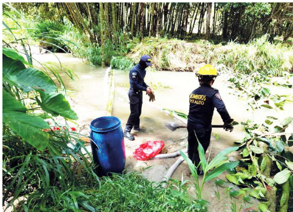
Nueve horas tardó en llegar el plan de contingencia por parte de la empresa de transporte responsable del desastre.

Nueve horas después del accidente llegó el plan de contingencia por parte de la empresa responsable Cootranskilli, las autoridades locales iniciarán la debida investigación. Por su parte, la comunidad exige sanción y soluciones.