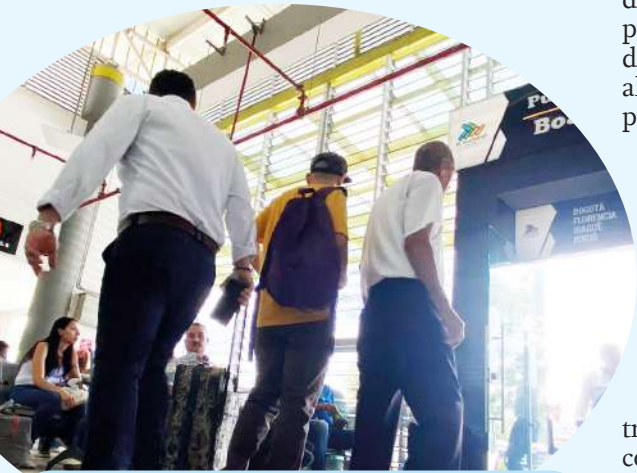
El transporte terrestre continúa siendo el eje de conexión entre los municipios del Huila.

En este contexto, la ciudad de Neiva enfrenta el reto de fortalecer sus sistemas de movilidad sostenible. Aunque el ICTIP se enfoca exclusivamente en el