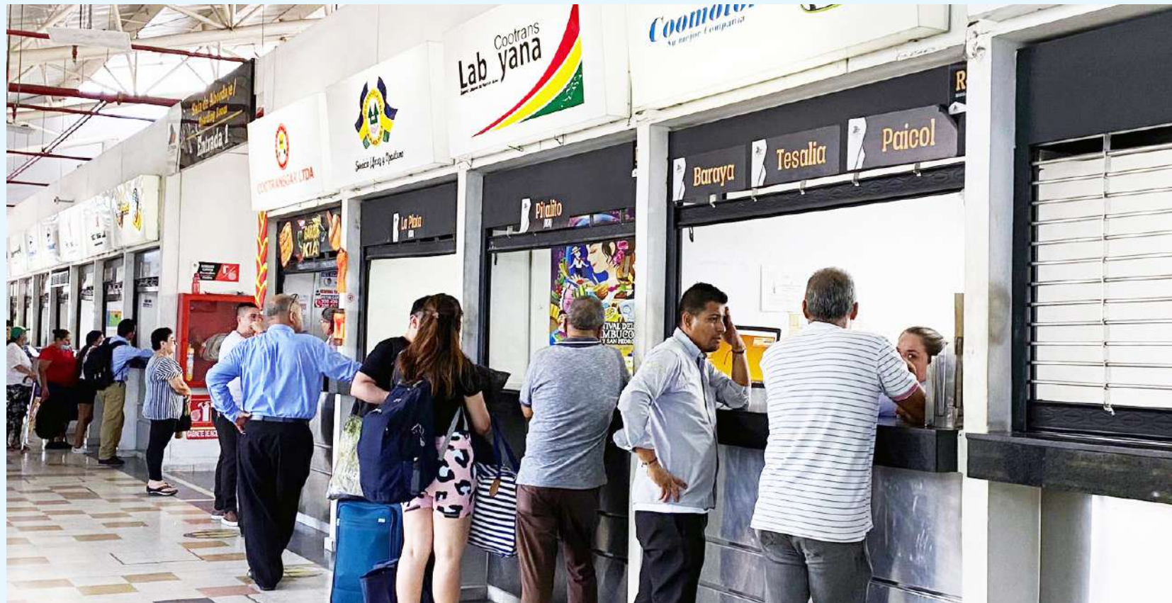
Terminal de Transporte de Neiva, punto clave para la movilidad intermunicipal en el Huila.