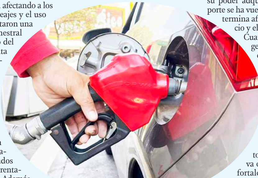
Los combustibles siguen siendo el principal factor que impulsa los costos operativos.