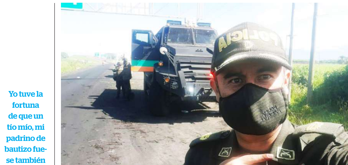
En la actualidad cuenta con más de 27 años de trayectoria institucional.

tunidad que se me brindaba porque él también me ofreció de pronto estudiar lo que yo quisiera, sino que después de haber prestado servicio en el Ejército me llamó mucho la atención el trabajo que se hacía desde la Policía Nacional y teniéndolo a él como referente, quise seguir sus pasos por así decirlo y cuando nos reunimos me dice, que le dejó el legado de él o dejó su reemplazo y una de mis metas es hacerlo con honor y dejar en alto el nombre de él de lo que él hizo.