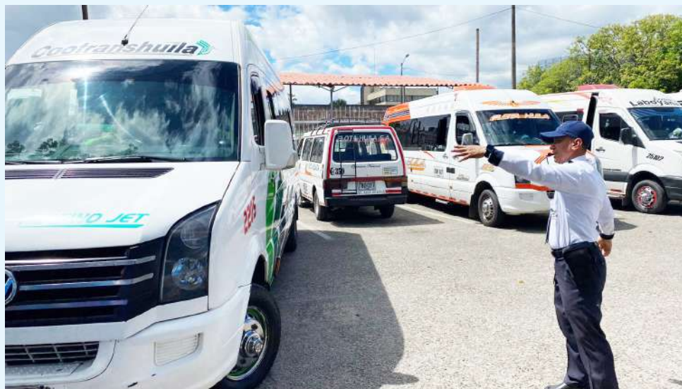
El aumento en los costos del transporte preocupa a empresas y pasajeros en la región.

tamento, las empresas de transporte como Coomotor, Cootranshuila o Flota Huila movilizan diariamente miles de pasajeros hacia municipios como Pitalito, La Plata, Garzón y Campoalegre.