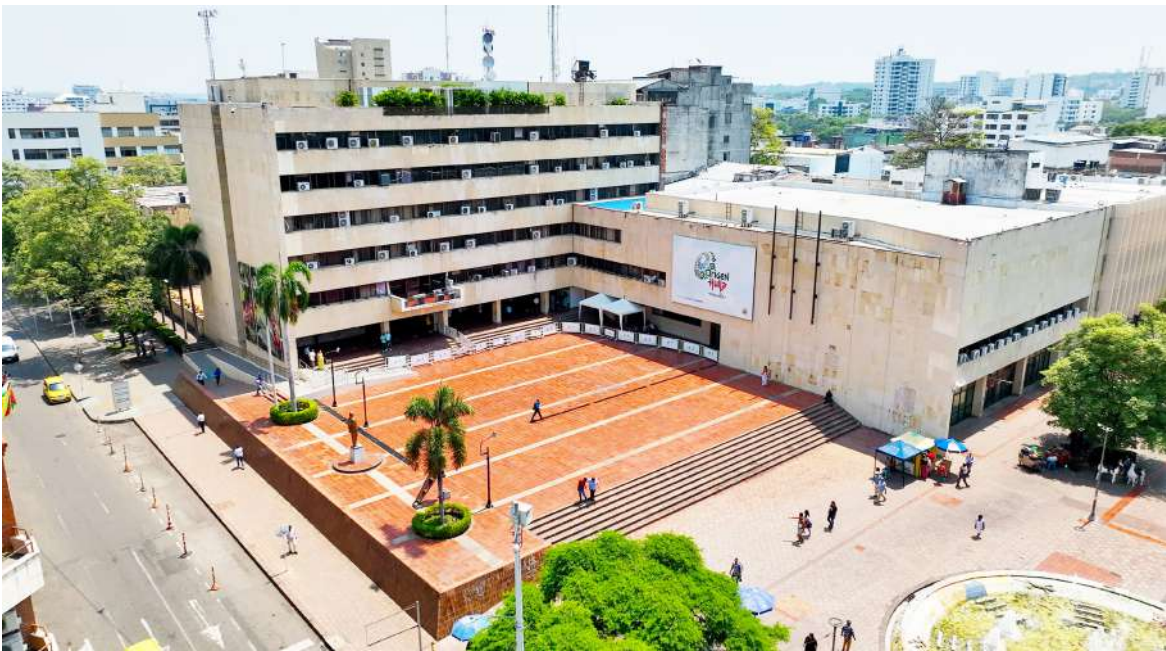
Existe una desfinanciación de 600.000 millones.

Aunque la mayor parte de los recursos se dirige a educación y salud, el presupuesto también contempla sectores estratégicos como desarrollo económico y turismo, que cuentan con una asignación cercana a $5.000 millones, cifra ligeramente superior a la del año anterior. Esto demuestra el esfuerzo por mantener o incrementar el apoyo a las actividades productivas regionales. Asimismo, los sectores de agricultura y cultura mantienen su participación presupuestal general, con inversiones que apuntan al fortalecimiento de la productividad rural, la identidad cultural y la sostenibilidad económica. En materia de deporte y recreación, el POAI incluye recursos por $9.667 millones, de los cuales $4.751 millones se destinarán a la construcción, mejoramiento o rehabilitación de escenarios deportivos, mientras que $4.915 millones financiarán programas de recreación, deporte formativo y aprovechamiento del tiempo libre.