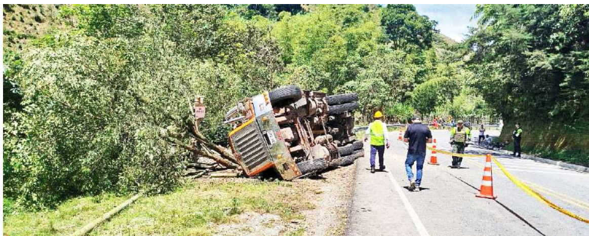
Las autoridades locales, iniciarán la debida investigación, para la empresa de transporte Cootranskilli, por los costos y daños ocasionados.

El impacto de este retraso fue directo: durante esas nueve horas, el Cuerpo de Bomberos Voluntarios de Pitalito, junto a la CAM y las autoridades locales, “asumió de manera directa todas las labores necesarias para proteger el recurso hídrico y evitar una afectación mayor al medio