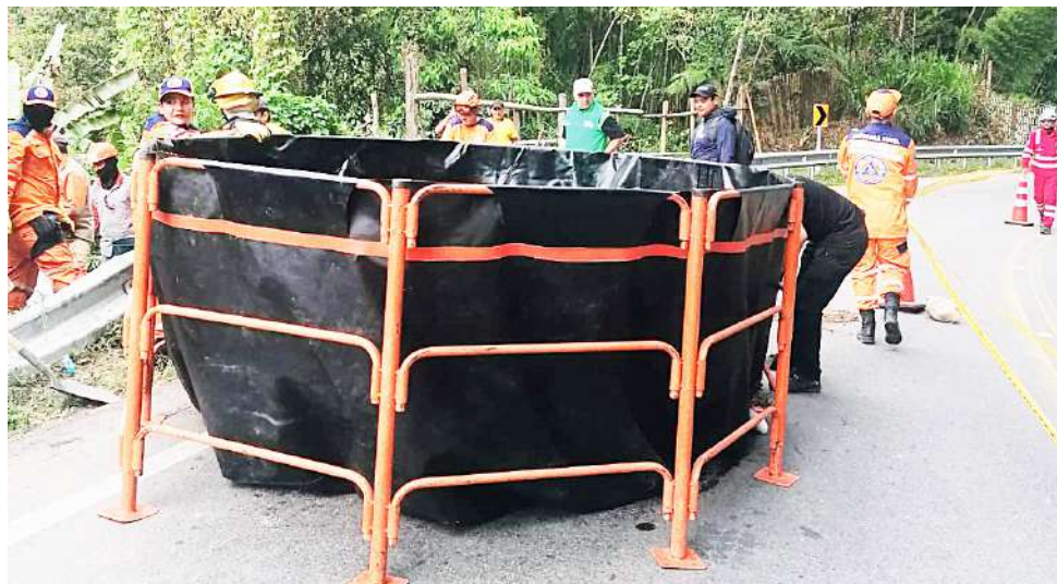
Las empresas de transporte de hidrocarburos, no cuentan con planes de contingencia en el Huila.

Los planes de contingencia para atender este tipo de emergencias en el Huila están ubicado en Puerto Asís Putumayo y en Ibagué, lo que genera un fuerte debate frente al impacto ambiental que puede representar un hecho como el ocurrido este lunes con el volcamiento del carrotanque cargado con Diésel.