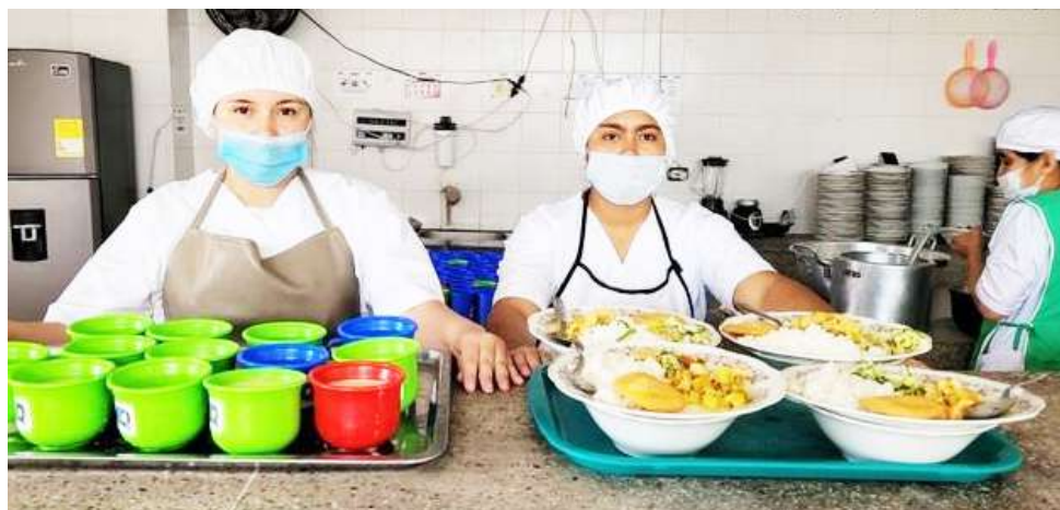
El Huila también tiene asegurados los recursos.

Frente a cómo les ha ido en lo corrido de este año 2025, la funcionaria de la Secretaría de Educación de Neiva indicó que por fortuna tienen asegurados los recursos hasta el último día de calendario escolar.