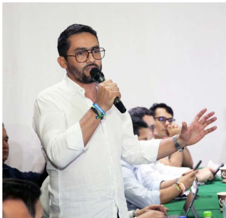
El diputado Virgilio Huergo, mencionó las dos secretarías con mayor destinación presupuestal es Salud y Educación.

La gobernación del Huila, presentó el proyecto de ordenanza por medio del cual se establece el presupuesto General del Departamento del Huila para la vigencia fiscal del 1° de Enero al 31 de diciembre de 2026.