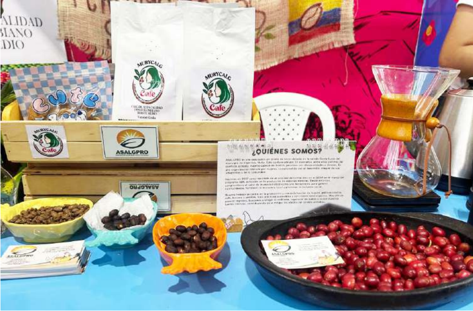
El personal se capacita constantemente en mejores prácticas.