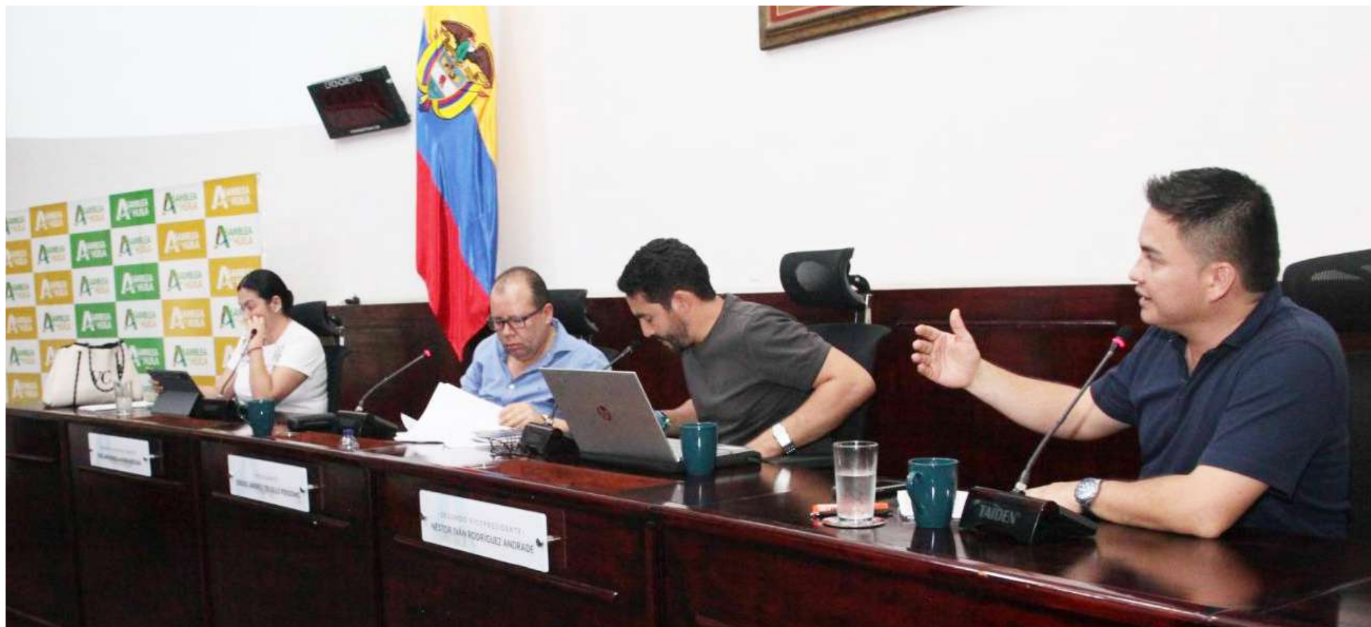
La comisión primera de hacienda y asuntos económicos, tendrán la gran tarea de estudiar el presupuesto para la vigencia 2026.

■ La Asamblea Departamental del Huila inició el estudio del proyecto de ordenanza que define el presupuesto general para 2026, una cifra que supera los $1,3 billones y que enfrenta el reto de una posible desfinanciación de más de $600.000 millones, poniendo a prueba la planeación fiscal del departamento.