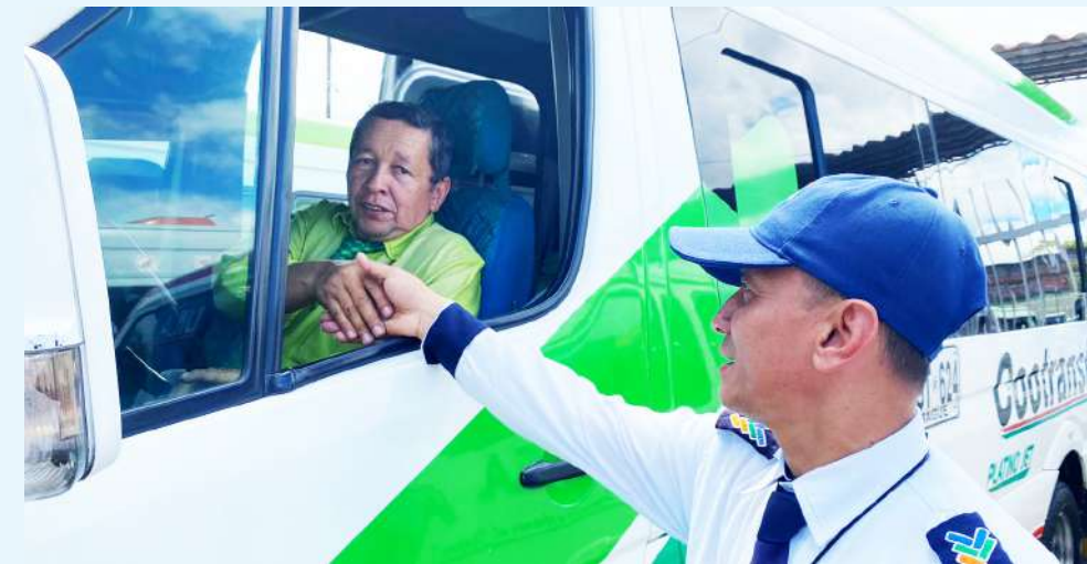
Conductores y ayudantes enfrentan mayores gastos en mantenimiento y peajes.

tiene consecuencias directas para los ciudadanos del Huila. En la medida en que las empresas enfrentan costos más altos, los pasajes intermunicipales tienden a ajustarse. Aunque el Ministerio de Transporte regula los incrementos de tarifas, las empresas argumentan que el rezago entre los costos operativos y las tarifas autorizadas genera un desequilibrio económico que podría afectar la prestación del servicio.