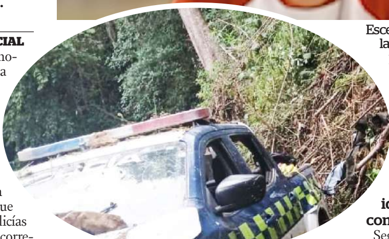
Las víctimas fueron despedidas con honores por la Policía Nacional y la comunidad huilense.

2022 cuando una patrulla de la Policía Nacional fue emboscada en la vereda Corozal, jurisdicción del corregimiento de San Luis. Los uniformados regresaban de una actividad de bienestar social organizada por la Policía Metropolitana de Neiva, cuando al pasar por un camino rural fueron sorprendidos por la detonación de un artefacto explosivo, seguido de ráfagas de fusil.