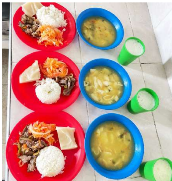
Se ampliará la cobertura a 32.500 raciones.

Para el año 2026 se ampliará la cobertura a 32.500 raciones donde los estudiantes recibirán desde el primer día de clases, con productos locales, infraestructura renovada y supervisión estricta.