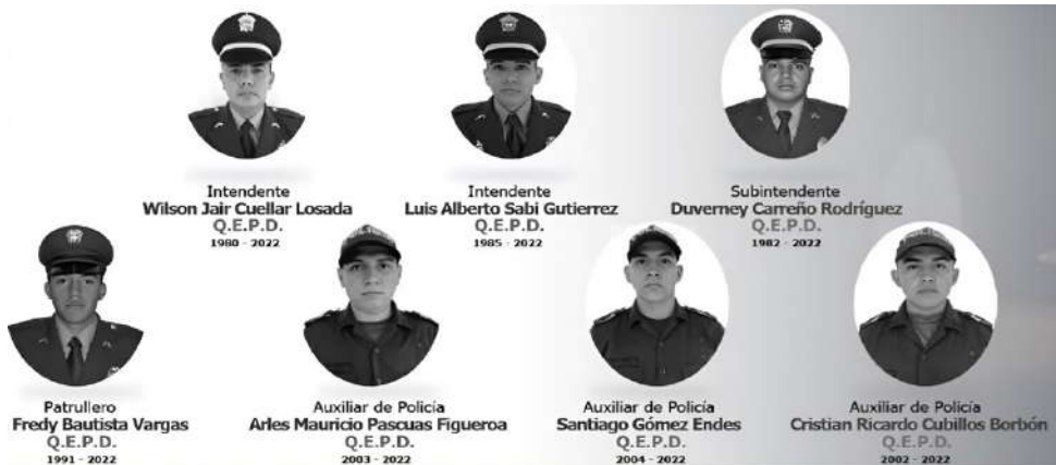
La tragedia en San Luis generó conmoción nacional y múltiples pronunciamientos de rechazo.

Hoy, tres años después de aquella tragedia, el recuerdo de los siete policías asesinados sigue presente en la memoria de los huilenses, como símbolo del sacrificio y la entrega de quienes dedican su vida a proteger a los demás.