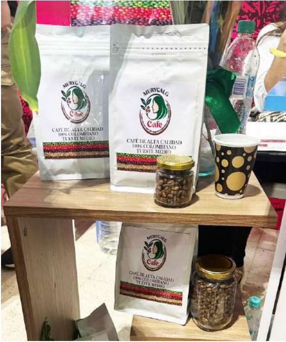
Gran variedad de cafés comercializa este grupo de mujeres.

así a mitigar los efectos del cambio climático. Además, rebuscan hacer a un lado el conflicto armado que tanto se ha percibido en este municipio del Huila, expresan que esto no ha sido un obstáculo