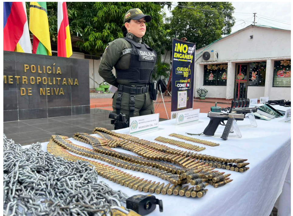
Con este rescate, el Huila queda momentáneamente sin personas secuestradas por estructuras criminales.

pacidad operativa en el occidente del departamento.