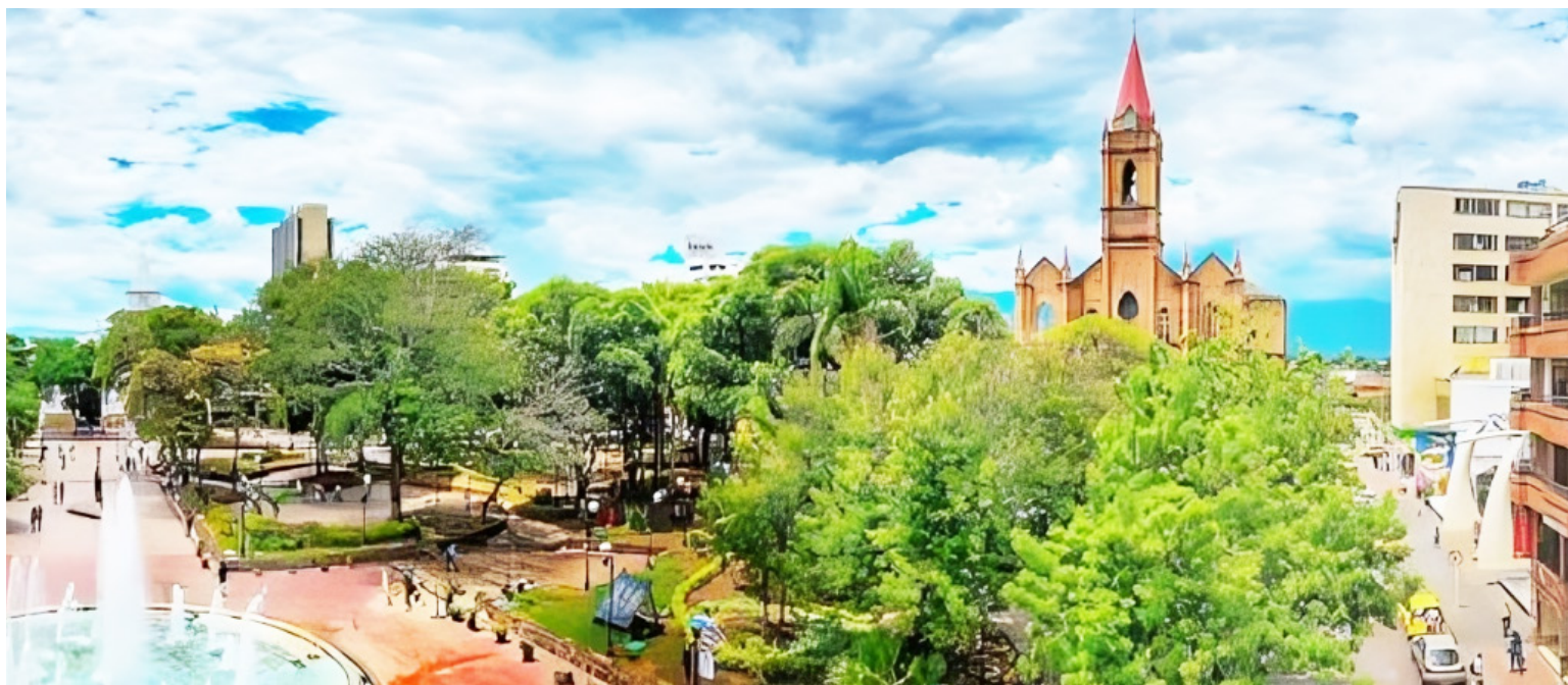
Neiva registró una de las tasas de desocupación más bajas para este trimestre desde que existen datos comparables.

El movimiento en el indicador se relaciona con ramas que aumentaron su capacidad de contratación durante los meses