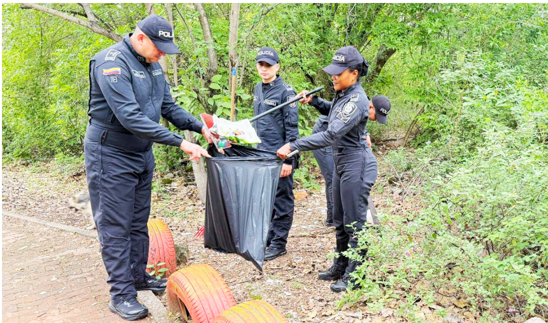
Vecinos y policías trabajan juntos en la limpieza de la laguna El Curibano, promoviendo el cuidado del entorno y el bienestar de la comuna.