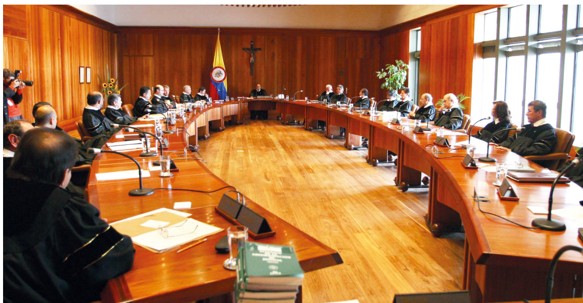
La Corte Constitucional reiteró que la salud infantil exige atención inmediata y sin barreras administrativas.

La Corte Constitucional volvió a poner en la mira a las EPS: un reciente fallo dejó claro que ningún trámite interno puede convertirse en barrera para acceder a servicios médicos urgentes, especialmente cuando está en juego la salud de un menor.