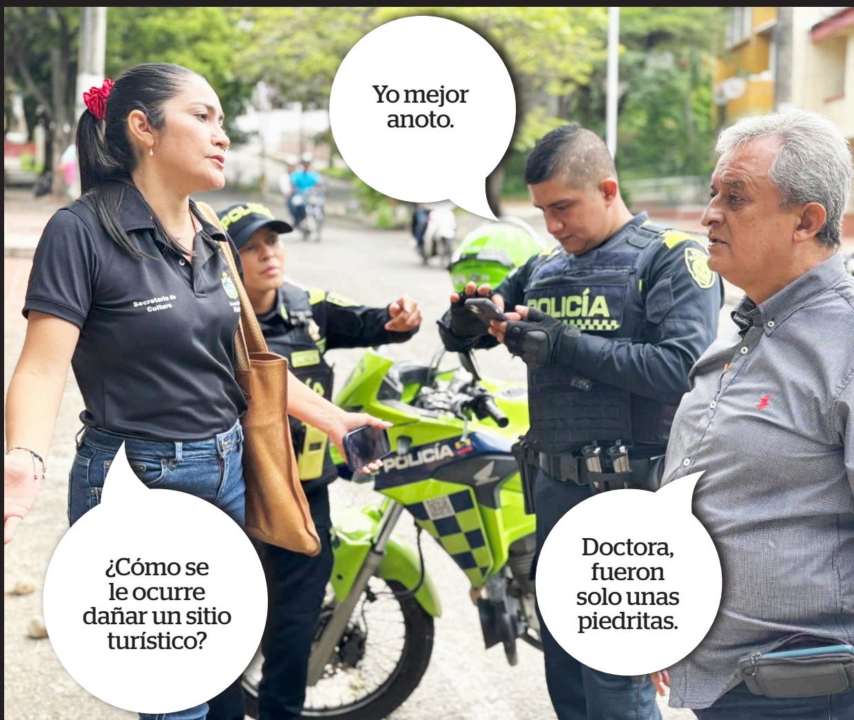
IMAGEN DE LA SEMANA

La reunión privada del Centro Democrático en el