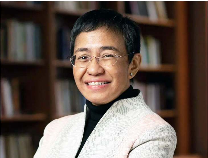
Figura de la semana

María Ressa Periodista filipina y cofundadora del medio digital Rappler, es una de las voces más influyentes y valientes en la defensa de la libertad de prensa en el mundo; ganadora del Premio Nobel de Paz 2021, ha dedicado su carrera a investigar la desinformación, denunciar el autoritarismo y enfrentar campañas de persecución judicial impulsadas por el gobierno de Rodrigo Duterte, convirtiéndose en símbolo global de resistencia frente a los ataques a la prensa y en una defensora incansable del derecho de las sociedades a estar informadas.