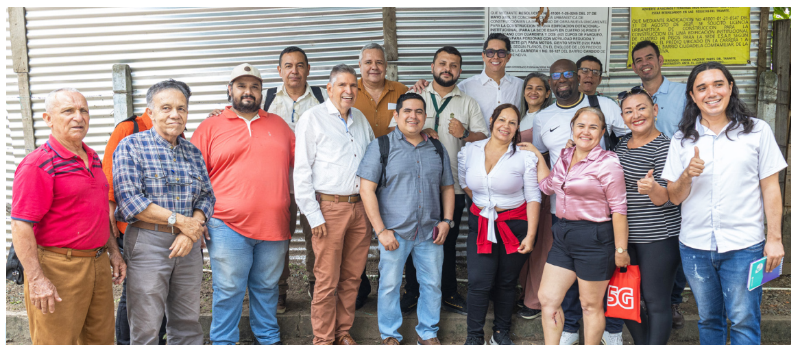
Las veedurías ciudadanas participaron en la jornada y continuarán realizando seguimiento de la construcción de la sede.

Después de más de catorce años de avances mínimos y de incertidumbre, la sede de la ESAP en Neiva vuelve a estar en la ruta de ejecución. Las fechas de inicio y entrega ya están definidas. El reto ahora es que este compromiso se mantenga hasta completar la obra y entregarla a los estudiantes, docentes y servidores públicos de la región.