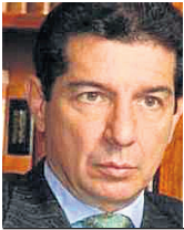
JOSÉ FÉLIX LAFAURIE RIVERA