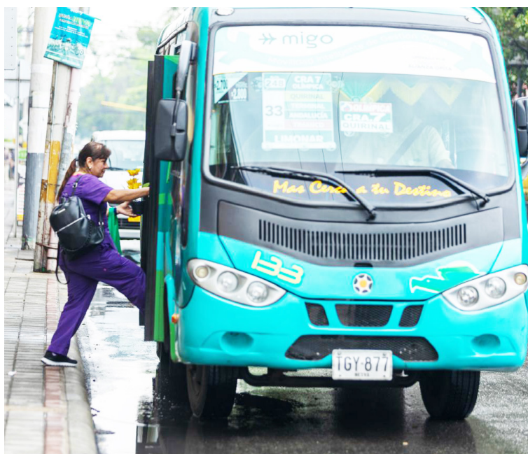
El transporte y los servicios relacionados sumaron empleo y contribuyeron a la reducción de la desocupación en la capital del Huila.

evaluados y con otras que redujeron su aporte. La combinación de ambos comportamientos dio como resultado una tasa menor a la del año anterior.