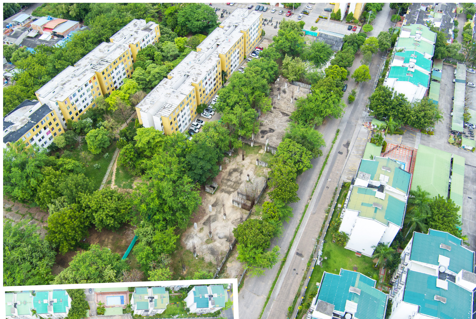
La sede de la Escuela Superior de Administración Pública está ubicada en el predio de la antigua Licorera del Huila.