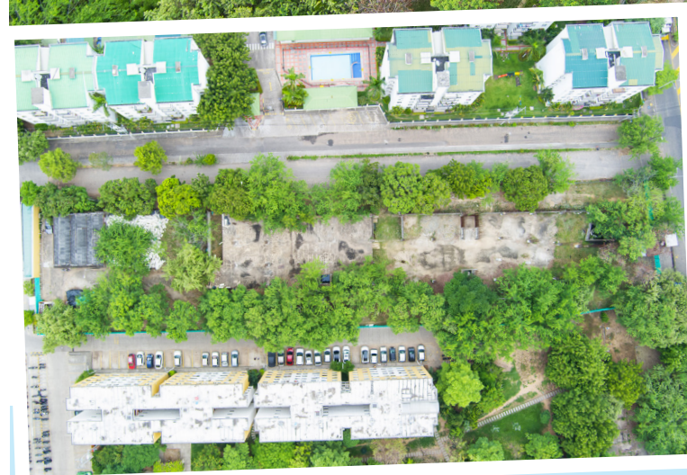
La obra, ubicada en el norte de la capital huilense se entregará a finales de año 2027.

tractuales, las pólizas necesarias y la confirmación de recursos para garantizar la intervención.