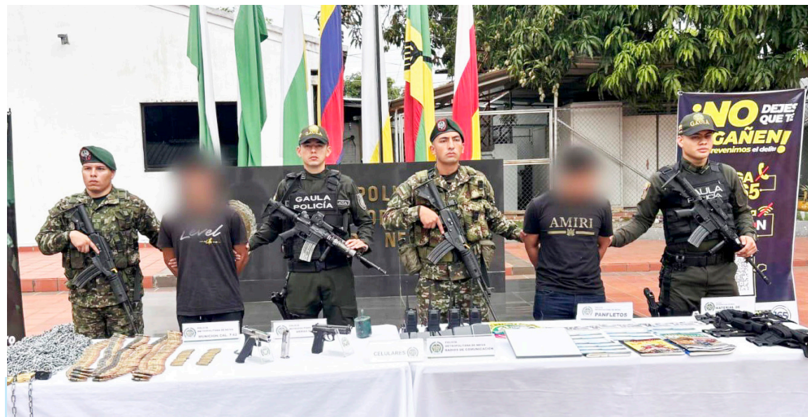
El Gaula Militar de la Policía realizó el operativo en la madrugada, sorprendiendo a los captores.

La operación no solo logró la liberación de las nueve personas, sino que permitió dar un golpe decisivo a la estructura criminal, debilitando sus finanzas y su ca-