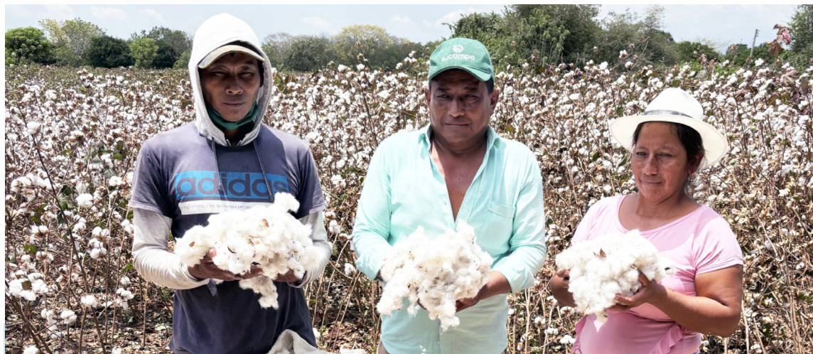
Más de 40 productores del Huila se verán afectados.