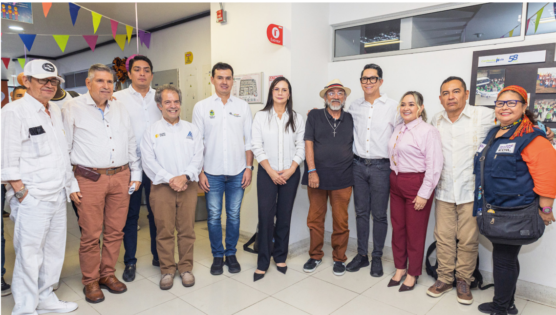
Asistentes a la jornada de socialización del avance de la obra de la sede de la Esap en Neiva.

zación administrativa indispensable para que el proyecto pueda avanzar sin nuevos tropiezos. Estas labores incluyen modificaciones contractuales, revisión de la interventoría, reestructuración del plan de obra y actualización de las pólizas.