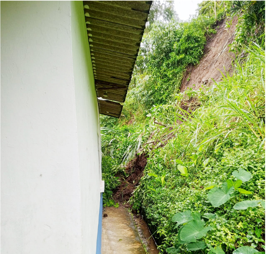
Gobierno trabajan en la reubicación.

Según la comunidad, en estos momentos hay dos realidades que