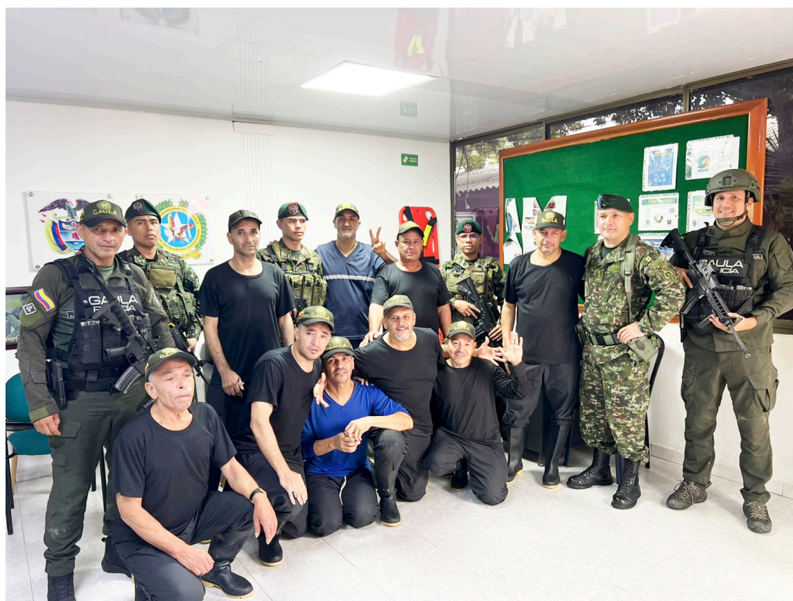
Nueve personas fueron rescatadas de una vivienda rural donde permanecían encadenadas y vigiladas.

gación minuciosa e inteligencia sostenida durante semanas, las autoridades lograron localizar el sitio exacto en el que eran custodiados, lo que permitió la planeación de un ingreso rápido y estratégico para recuperar a las víctimas con vida.