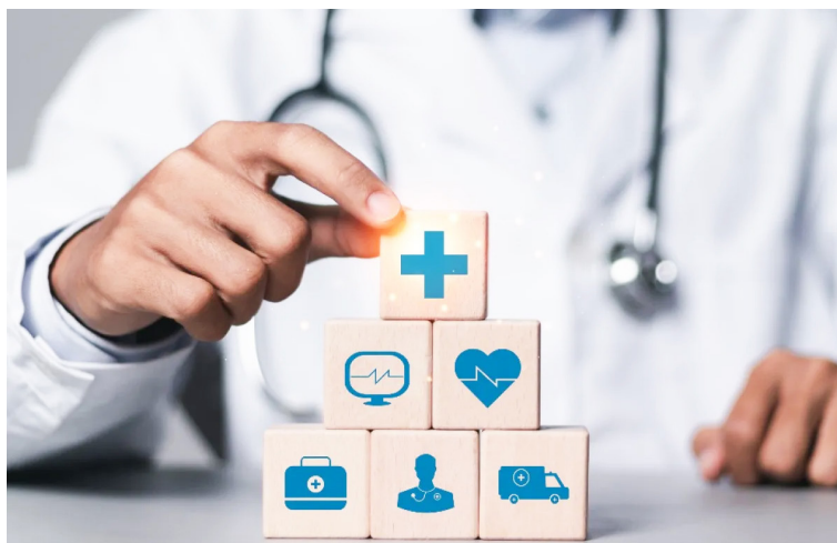
El caso fue analizado por la Sala Sexta de Revisión, integrada por tres magistrados del alto tribunal.

La madre de la recién nacida interpuso la tutela argumentando que, desde el nacimiento de la bebé, la EPS exigió trámites y autorizaciones que nunca llegaron a tiempo, lo que ocasionó la pérdida de citas fundamentales, retrasos en terapias especializadas y dificultades para acceder