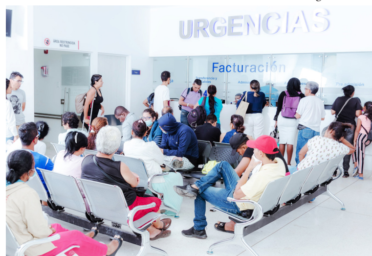
El fallo recordó que la salud es un derecho fundamental y un servicio esencial que no admite dilaciones.

El alto tribunal también señaló que las EPS deben garantizar logística eficaz: entrega puntual de insumos, disponibilidad de citas, confirmaciones previas, recursos para traslados y cobertura total de los servicios ordenados por los médicos tratantes. La Sala citó ejemplos como la falta oportuna