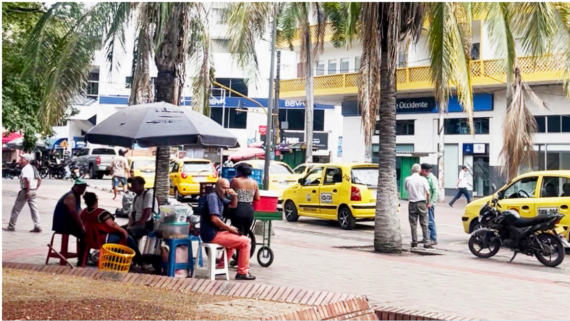
El trabajo por cuenta propia continúa siendo una de las principales formas de ocupación en el país.

El informe comparó las tasas de desocupación en 23 ciudades y áreas metropolitanas. Florencia registró una de las mayores reducciones con una caída de 4.8