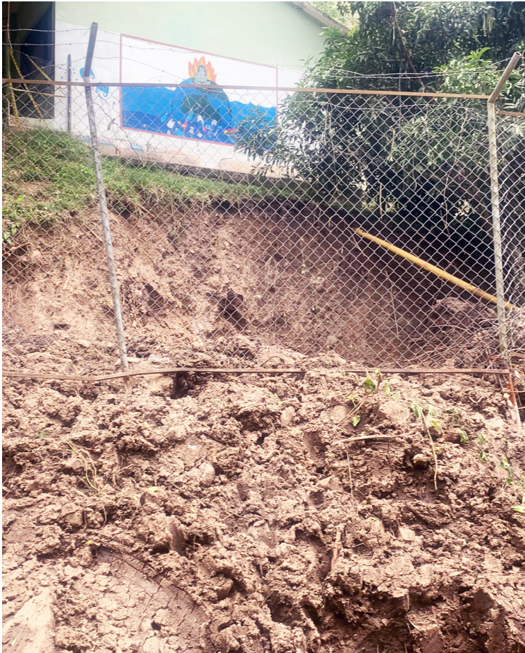
El plantel es reconocido por su rendimiento en las Pruebas Saber.

Ha sido la comunidad la que ha tenido que solucionar e invertir en los últimos años, pero ya la situación esta insostenible