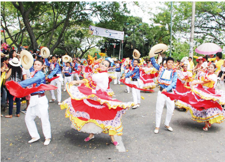
Los servicios artísticos y de entretenimiento también influyeron en el crecimiento de la ocupación en la ciudad.

puntos porcentuales respecto al mismo trimestre de 2024. Pereira también presentó una disminución amplia con 4.3 puntos porcentuales. Barranquilla Pasto y Tunja formaron parte de las ciudades con reducciones significativas.