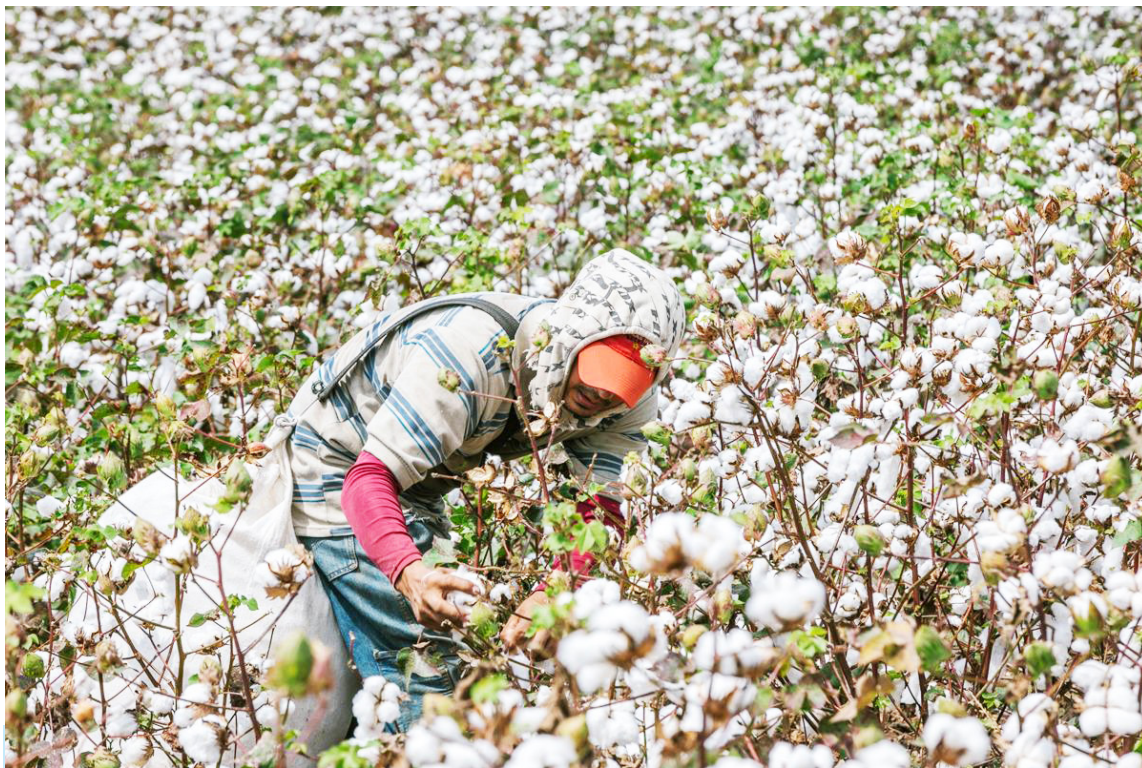
El algodón se cultiva en municipios de Aipe, Tello, Villavieja y Campoalegre.

Los expertos también destacan que el decreto refleja el