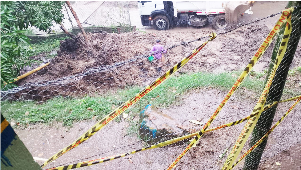
Más de 800 estudiantes y alrededor de 20 docentes llevan años exigiendo reubicación.