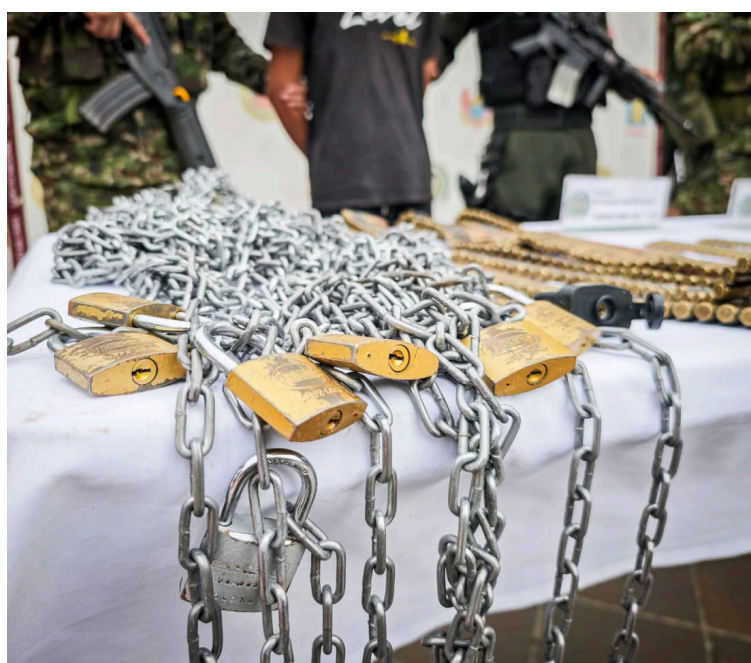
Las autoridades revelaron que el secuestro inició con un falso negocio minero.

Durante el anuncio del rescate, el coronel Téllez Betancourt destacó que este operativo es ejem-