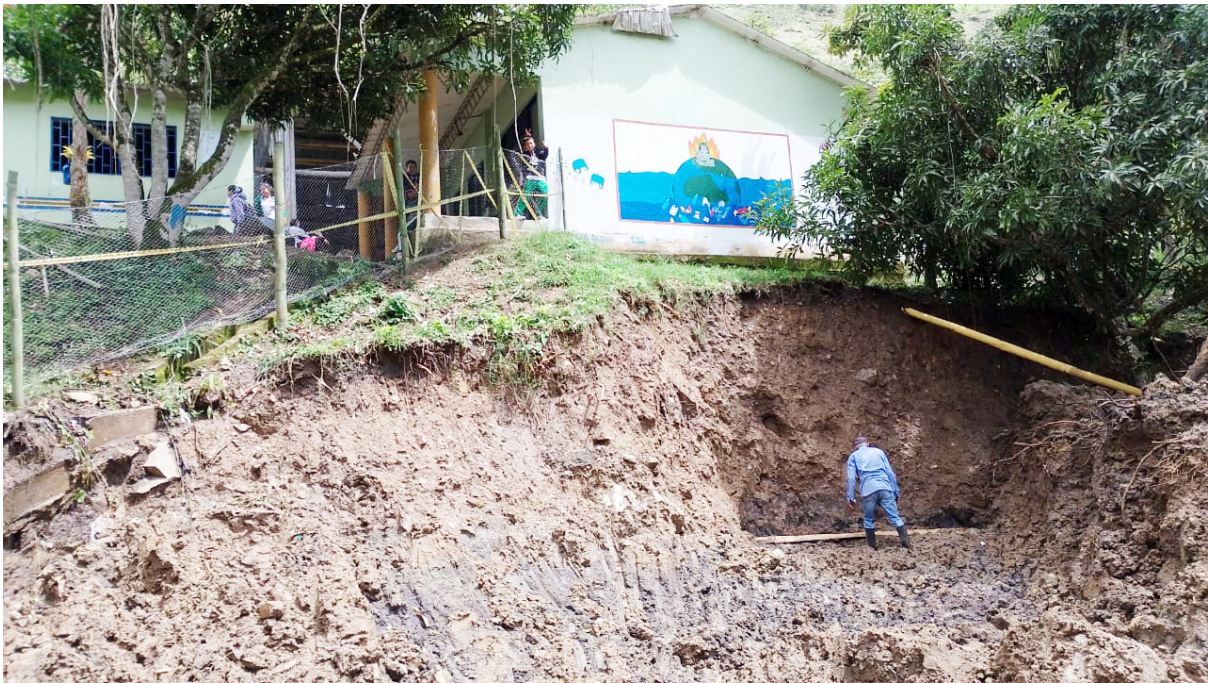
Institución educativa La Planta sede rural ubicada en el municipio de Guadalupe.

Más de 800 estudiantes y 20 docentes se encuentran en un peligro latente desde hace muchos meses, la institución educativa La Planta se encuentra solo a 50 cm de un alud de tierra, la infraestructura está construida cerca de la montaña. Gobierno indica que ya realiza acciones para reubicar el plantel educativo.