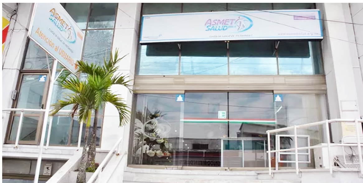
Asmet Salud EPS negó responsabilidad y planteó varias excepciones, entre ellas la inexistencia de falla en la prestación del servicio.

El 17 de julio, Ortiz presentó dolores abdominales y acudió al Hospital Arsenio Repizo Vanegas, donde se ordenó su remisión al