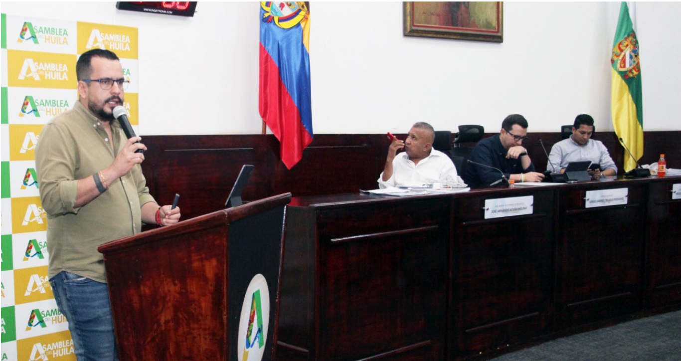
La Asamblea aprobó el presupuesto para el departamento para la vigencia de 2026.

La aprobación del Presupuesto General del Departamento permite a la Gobernación iniciar 2026 con la base financiera definida. Esto evita retrasos en la contratación y permite programar la ejecución desde el comienzo de la vigencia. La Asamblea destacó que la decisión fue tomada tras un análisis técnico que incluyó revisión de proyectos de inversión, socialización con dependencias y verificación del plan financiero del departamento. La corporación reiteró que el compromiso es mantener un uso responsable, equilibrado y orientado al territorio de los recursos. Con la aprobación del presupuesto, el departamento queda habilitado para dar continuidad a obras en marcha, ejecutar programas sociales y cumplir compromisos del Plan de Desarrollo en su última etapa de vigencia. El reto será convertir los 1,1 billones de inversión en resultados visibles para el territorio y garantizar que los 1,3 billones del monto total se ejecuten de manera eficiente durante el año.