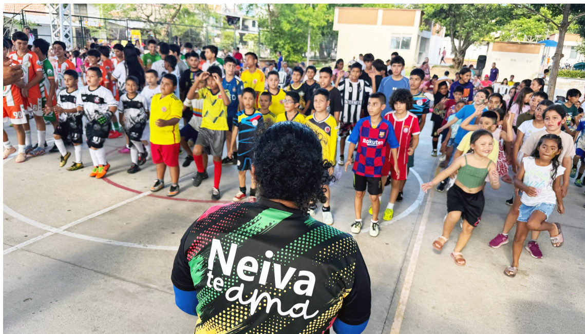
Jornada de apertura de la estrategia Jóvenes en Paz y Amor por Neiva, con actividades lúdicas y espacios de diálogo.