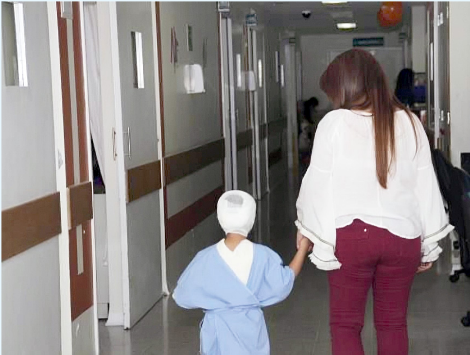
Las autoridades avanzan en prevención de campañas para evitar quemados.

Con la llegada de diciembre las autoridades piden a la población prudencia y responsabilidad. La prevención la atención oportuna y la colaboración de la comunidad son, según los responsables de salud, las herramientas para reducir la ocurrencia de quemaduras