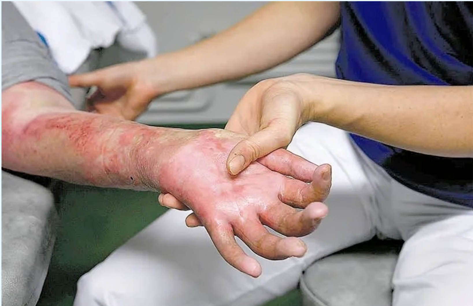
En el 2025 se presentaron 20 casos de quemados con pólvora en el Huila.

Con la llegada de diciembre las autoridades piden a la población prudencia y responsabilidad. La prevención la atención oportuna y la colaboración de la comunidad son, según los responsables de salud, las herramientas para reducir la ocurrencia de quemaduras