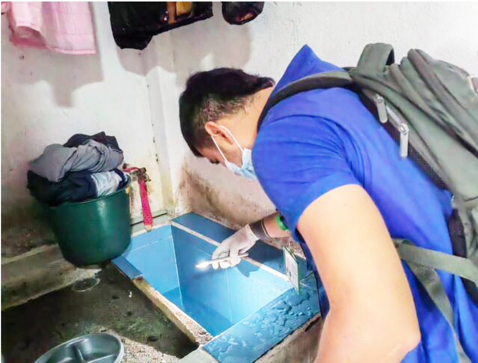
Autoridades continúan haciendo controles a las albercas.

Con la llegada de los primeros fríos y la temporada invernal acercándose, las autoridades se encuentran alertas ante un posible aumento del dengue donde se disipará junto con los mosquitos que lo transmiten.