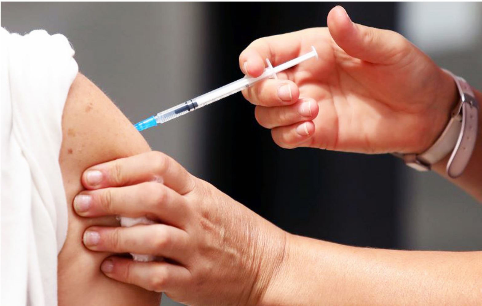
Huila incluido en la implementación de la vacuna contra el dengue.

“Es una gran noticia para toda la población de Neiva, nosotros hemos sido un municipio hiperendémico porque llevamos muchos brotes de dengue en el municipio, en lo cual hemos hecho la solicitud al Ministerio de Salud y Protección Social que se nos