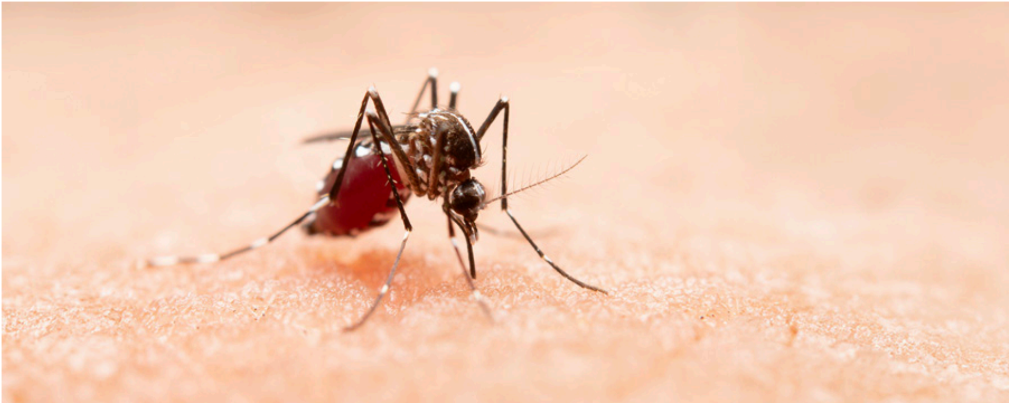
Las autoridades de la salud destacaron una baja sustancial de casos de dengue.

■ Esta noticia es muy positiva para el departamento teniendo en cuenta que el dengue ha sido una enfermedad que siempre ha estado presente, sobre todo afecta a los menores de edad, el Huila ya reporta cinco fallecidos en este 2025 y en el 2024, se registraron 19 fallecimientos. La implementación iniciará el próximo año entre los meses de enero y febrero.