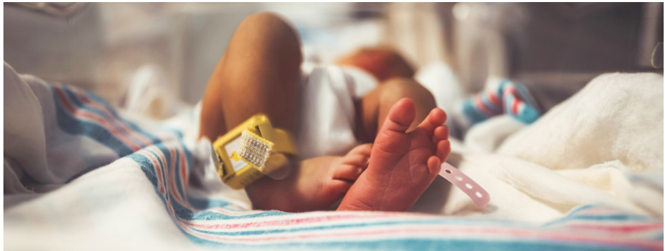
La demanda atribuyó la muerte de las gemelas a la falta de autorización y práctica del examen ecográfico ordenado el 2 de julio de 2015.

En cuanto a la supuesta demora en la remisión, el dictamen pericial concluyó que la oportunidad fue óptima, pues la paciente fue referida dentro de la primera hora, y para ese momento los fetos ya habían fallecido. El Consejo de Estado condenó a la familia al pago de las costas en ambas instancias.