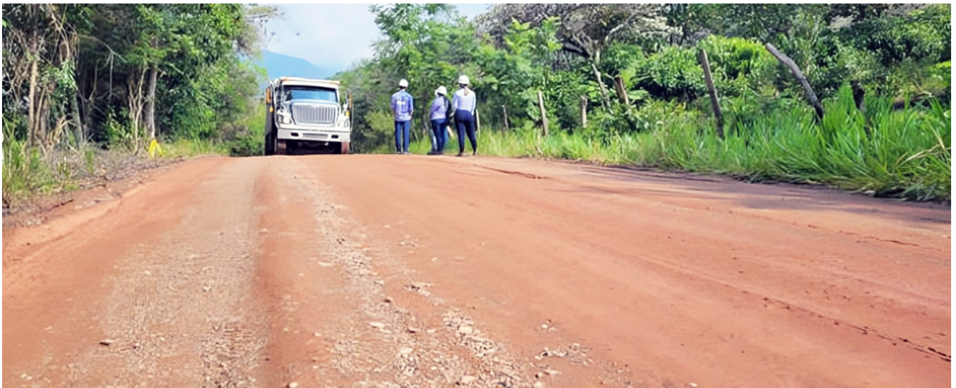
Está prevista la segunda fase de la vía Íquira - Yaguará.

El reto será convertir los 1,1 billones de inversión en resultados visibles para el territorio y garantizar que los 1,3 billones del monto total se ejecuten de manera eficiente durante el año.