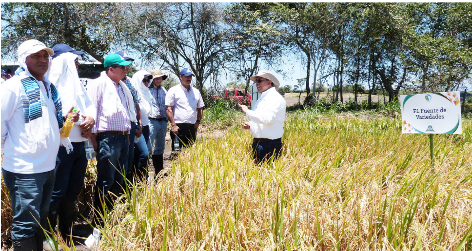
Se priorizarán inversiones en programas de agricultura en los municipios.