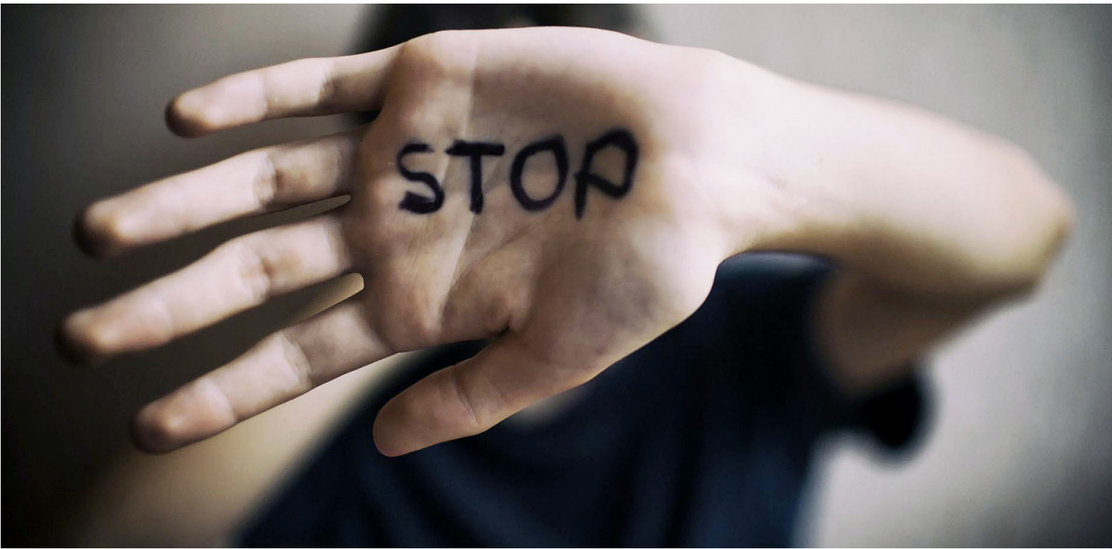
Estos datos reflejan una realidad compleja.

Limitación de recursos: Comisarías, ESEs y redes de protección muchas veces priorizan programas dirigidos a mujeres, lo