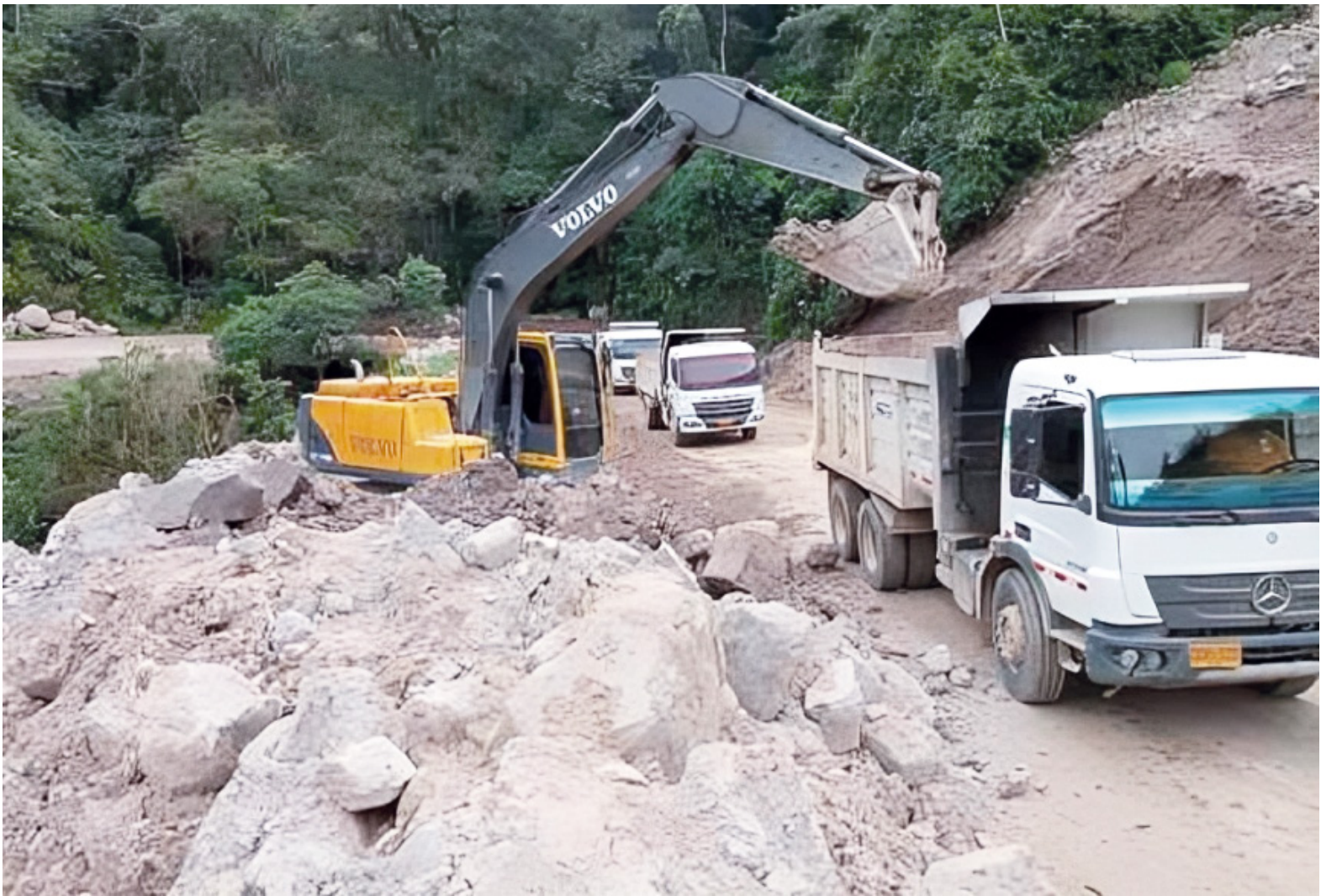
La inversión incluye el corredor Saladoblanco - Oporapa.

Dentro de los 1,3 billones, la Asamblea aprobó 1,1 billones para inversión. Este componente es el que concentra los programas con impacto directo sobre la población y las obras financiadas desde el departamento. En la categoría de funcionamiento se mantienen los gastos admi-