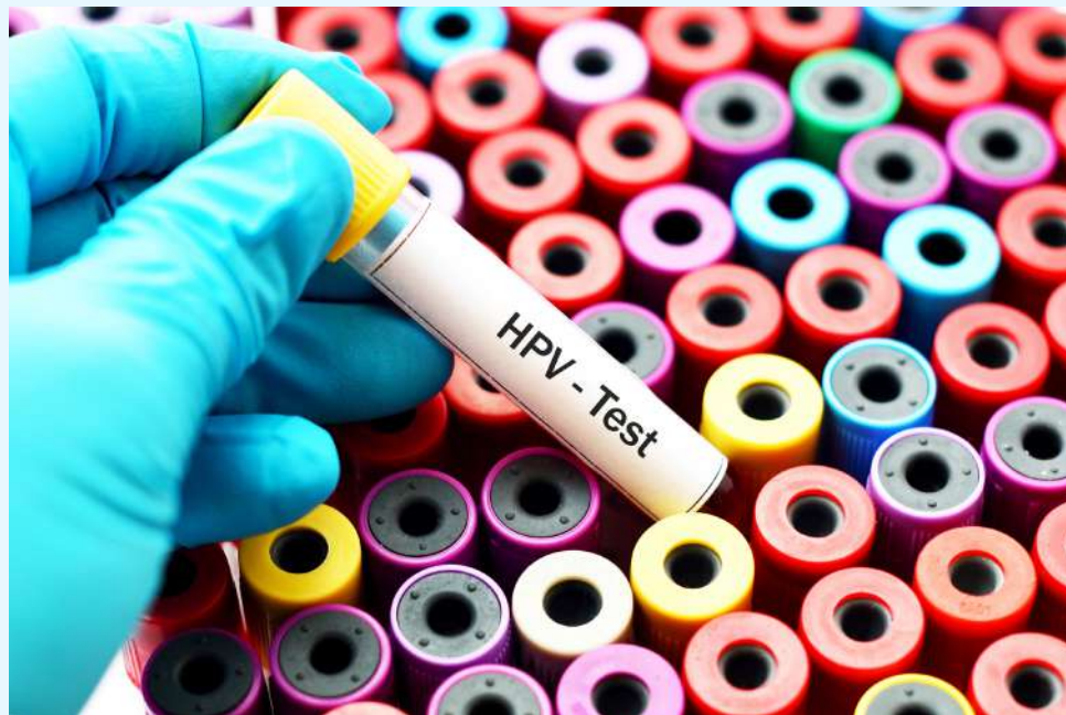
Este proyecto se hará en Neiva y Campoalegre.

la cadena de transmisión. Este virus ya está plenamente identificado como el causante del cáncer de cérvix”, explicó el funcionario.