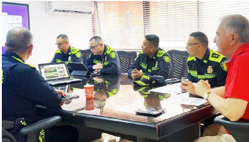
Autoridades avanzaron de manera mancomunada para lograr los proyectos pero no fue posible.

Aunque el departamento insiste en que continuará completando la documentación, los ciudadanos siguen pagando el precio de años de retrasos que ponen en riesgo la seguridad.