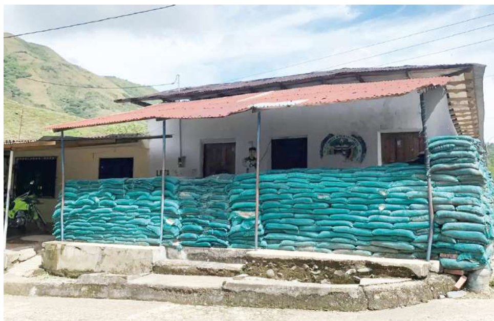
Cuentan con 15 uniformados que se rotan cada tres meses.

proyecto, impulsado por el Gobierno Nacional, no se realizará por falta de “Voluntad del Ministerio del Interior”.