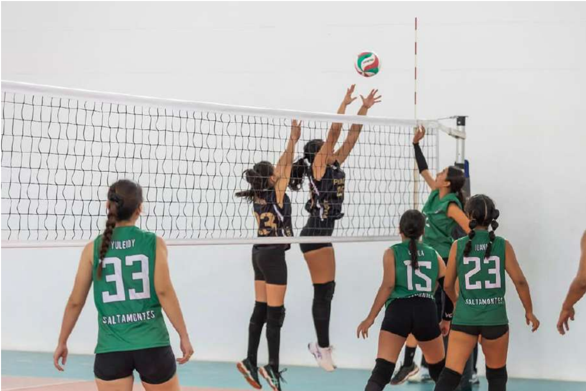
El torneo espera recibir la visita de más de 500 deportistas.

Más allá de los problemas recientes, el Coliseo Menor mantiene su aval técnico y puede recibir una alta afluencia de deportistas y público. “Ese escenario cuenta con tres canchas, es uno de los escenarios más grandes del país, tres canchas con un público de casi mil espectadores”, sostuvo el jefe de la cartera de Deportes. Añadió que el espacio está diseñado para desarrollar torneos tanto nacionales como internacionales, razón por la cual se espera que pueda operar con normalidad una vez entren en funcionamiento el nuevo transformador y el sistema hidráulico. Durante el campeonato, las tres canchas serán utilizadas para la fase de grupos, mientras que los partidos de semifinales y finales se concentrarán en la cancha principal. El personal logístico, los equipos de arbitraje y las delegaciones contarán con zonas destinadas exclusivamente a su preparación y descanso.