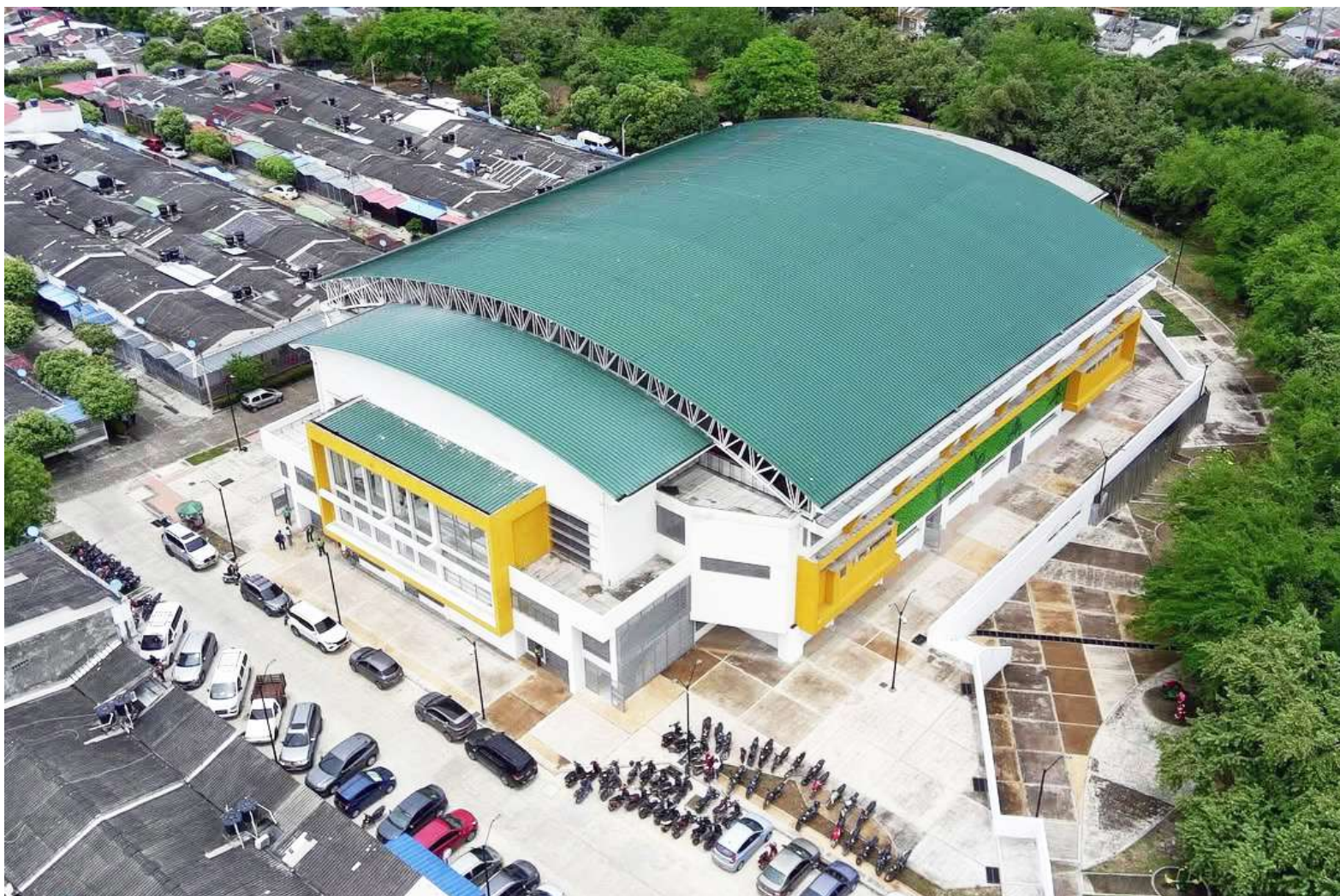
El coliseo menor de voleibol fue puesto en funcionamiento en marzo de 2025.