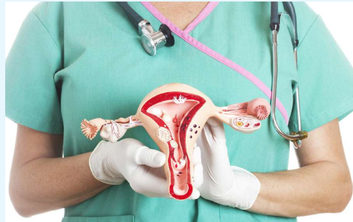
En 2024 se registraron 291 casos de cáncer de cérvix.

Para el segundo semestre de 2025, la cobertura se encuentra en 25,7%, con 5.415 niños y niñas vacunados de una población de 21.068. Al igual que en el periodo anterior, la cobertura en el sexo femenino fue superior (27,9%) en comparación con el sexo masculino (23,6%). Los muni-