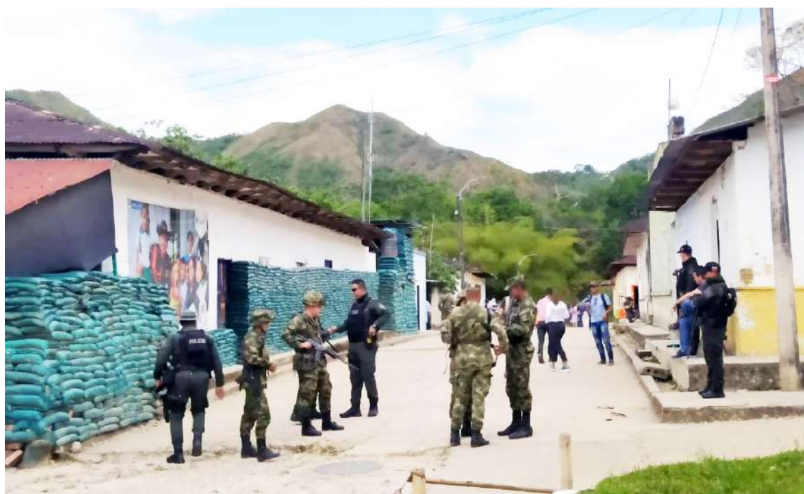
En San Luis los posibles han sufrido muchos hostigamientos.

En una casa de bahareque del corregimiento de San Luis, deberán continuar prestando sus servicios los 15 uniformados de la Policía Metropolitana, luego de que se cancelará la construcción de la subestación policial, el