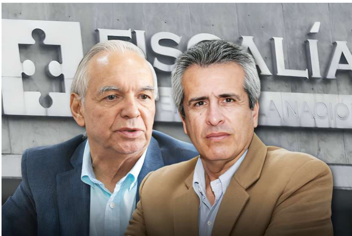
La Fiscalía radicó ante el Tribunal Superior de Bogotá la solicitud de imputación contra los exministros Velasco y Bonilla.