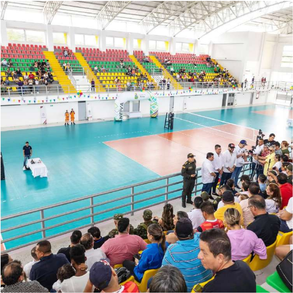
Tiene capacidad para más de 1.300 personas.