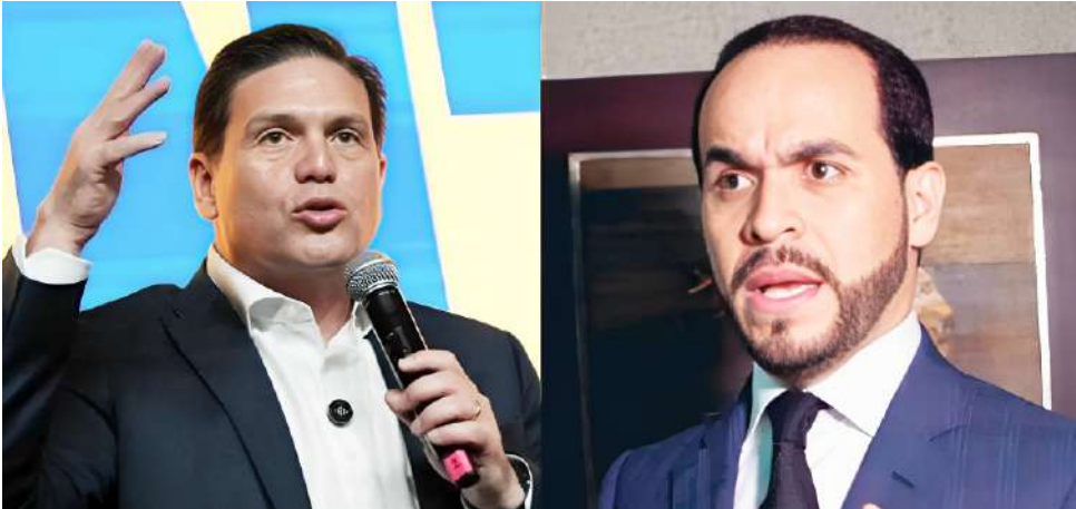
Varios precandidatos ya entregaron firmas y evalúan su continuidad en la carrera presidencial.

competitiva. La fragmentación ha sido uno de los factores que más ha debilitado al sector en contiendas recientes, y esta vez buscan corregir ese error estratégico.