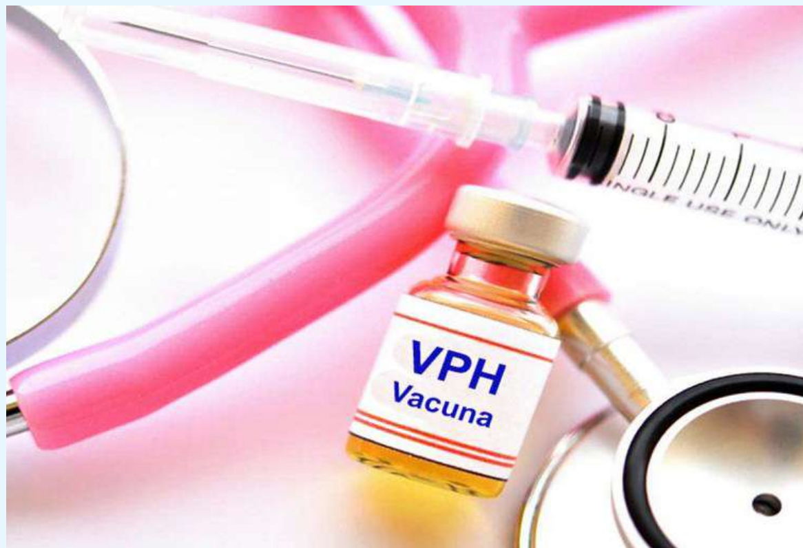
Instan a la vacunación contra el VPH.