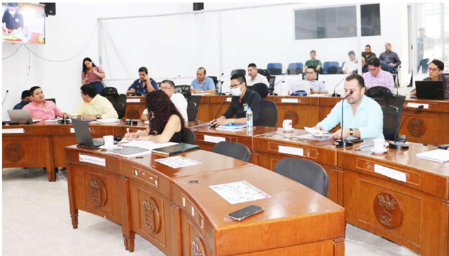
En desarrollo las evaluaciones para definir al secretario general del Concejo en 2026.