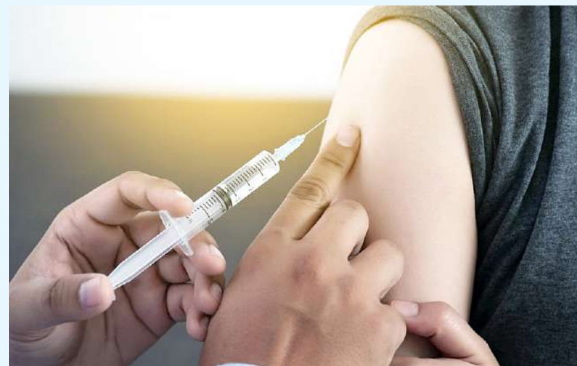
El porcentaje de vacunación de VPH se calcula como el número de dosis aplicadas.

El propósito de la Universidad del Bosque es validar científicamente la confiabilidad de la prueba para que pueda