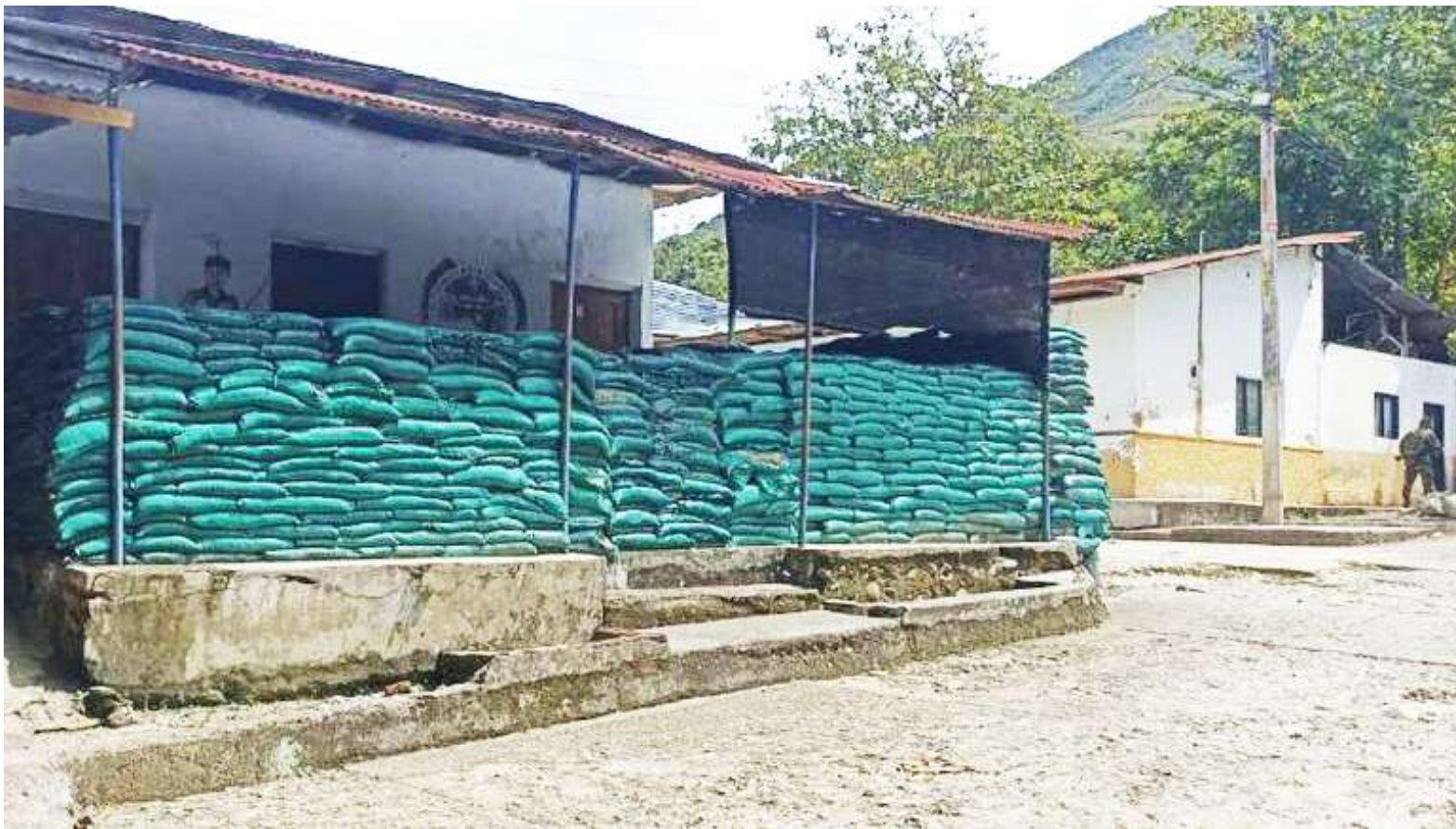
En una casa de bahareque del corregimiento de San Luis deberán continuar prestando sus servicios.