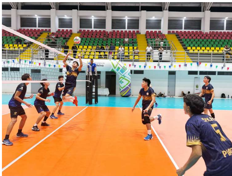
El escenario deportivo está ubicado en el barrio Tercer Milenio, en el norte de Neiva.

Con la falla del transformador, las bombas dejaron de funcionar, lo que imposibilitó el uso de los baños y de otros puntos de suministro. Una de las bombas resultó además dañada por el corto inicial, aunque aún opera parcialmente.