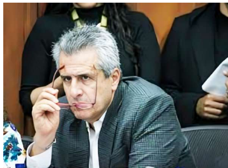
Con estas nuevas imputaciones, ya son seis los exaltos funcionarios del gobierno Petro vinculados al escándalo.

zález, funcionario de la Alcaldía de Sahagún, para avanzar en los