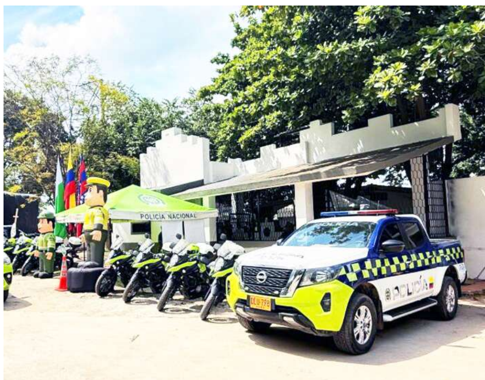
La decisión genera preocupación entre autoridades locales y comunidades.

Proyectos clave para nuevas estaciones y subestaciones de Policía en Zuluaga, El Juncal y La Ulloa quedaron en stand by porque los convenios no se firmaron a tiempo.