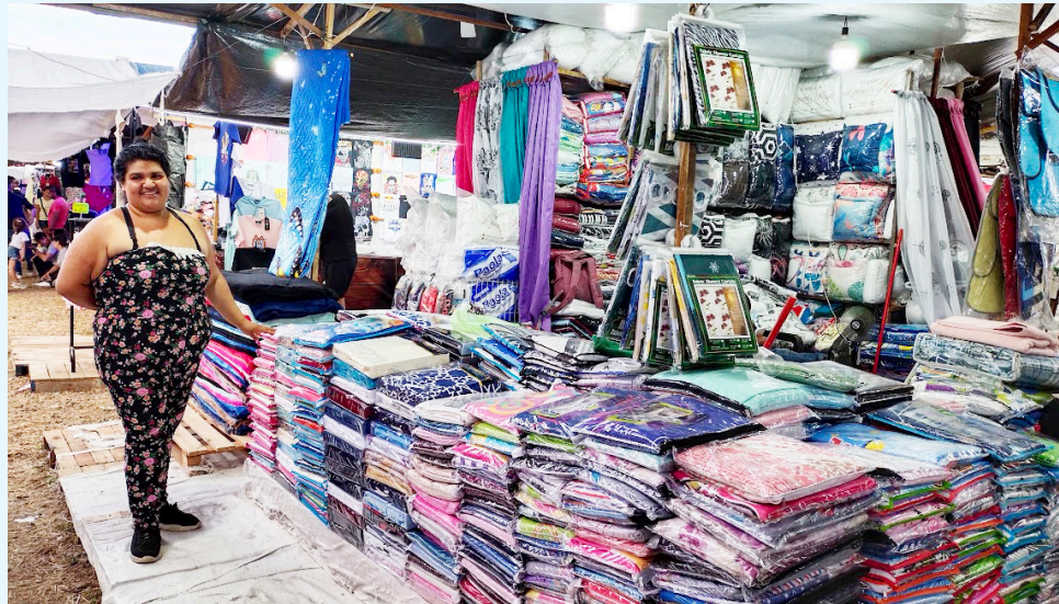
El Huila reportó una caída del 100 % en la creación de empresas, uno de los datos más críticos del país.

La creación de empresas en junio cayó 77 %, el desplome mensual más duro de toda la serie entre 2022 y 2025.