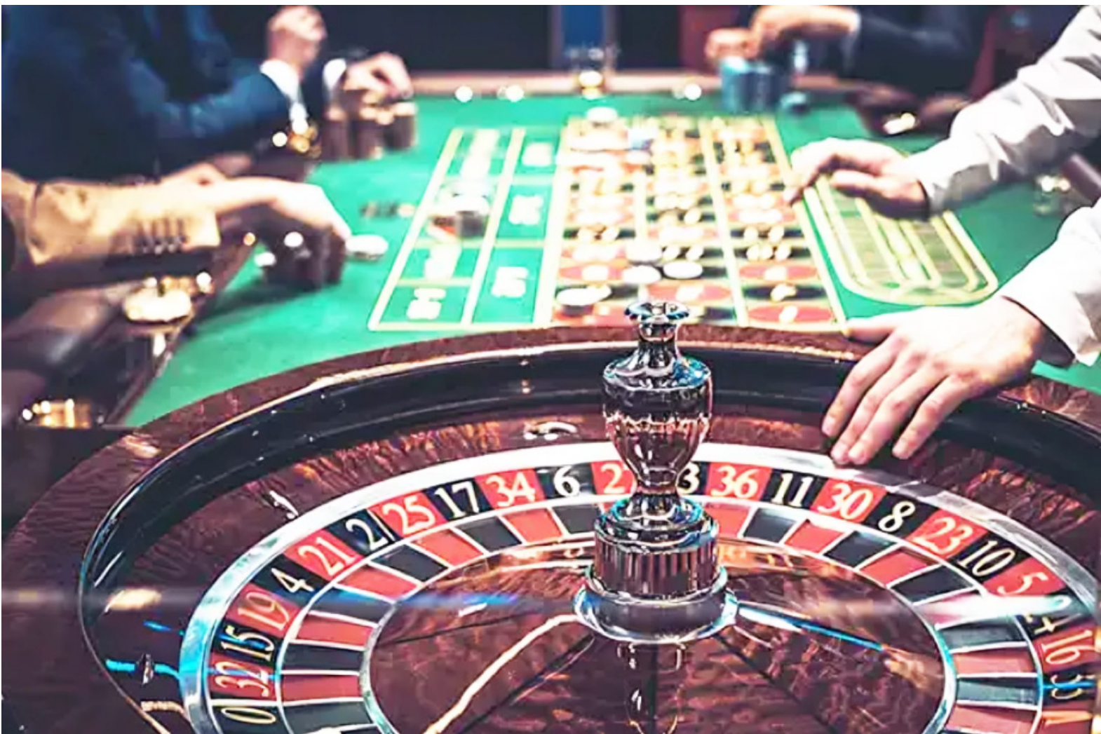
El impuesto a los juegos de suerte y azar en línea se mantendría como una medida permanente desde 2026.