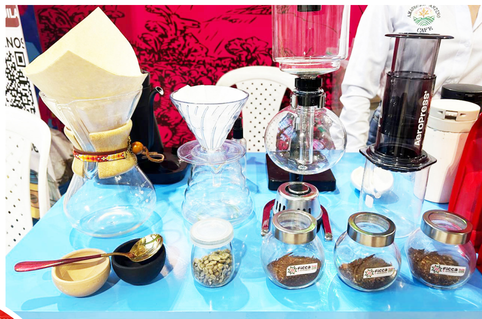
El proceso es completamente artesanal y controlado por ellos mismos.

De acuerdo con el emprendedor, su café se exporta cada dos meses entre 30 y 50 kilogramos de café tostado y sus ventas mensuales alcanzan alrededor de cinco millones de pesos, cifra que se duplica gracias a las exportaciones.