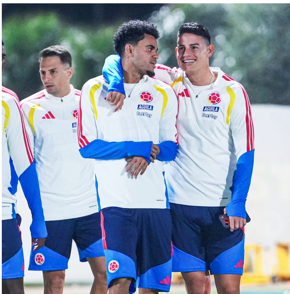
Colombia, por un cierre sólido en su duelo de hoy frente a Australia.

se perfila para iniciar. En el arco podría reaparecer Camilo Vargas, aunque David Ospina sigue en consideración. En defensa, Santiago Arias tomaría el lugar de Muñoz por la banda derecha, mientras Dávinson