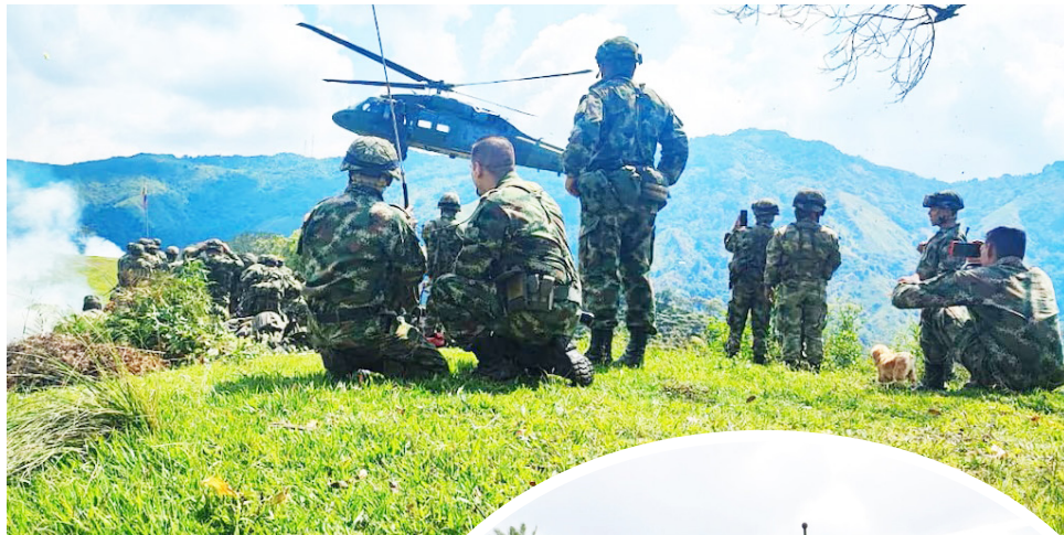
Operativos militares en áreas rurales del sur del país, escenario de los recientes combates.

siete menores en Guaviare, la defensora Iris Marín volvió a dirigirse al presidente Petro y al ministro de Defensa, Pedro Sánchez, alertando que habían llegado nuevos reportes de adolescentes muertos en combates en otras zonas del país.