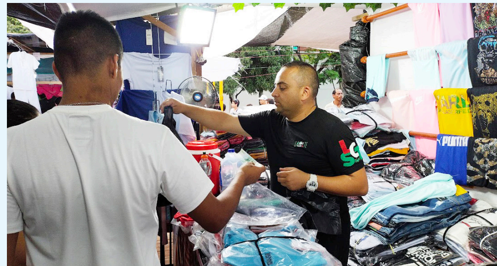
La incertidumbre económica y las dificultades de acceso al crédito continúan frenando el emprendimiento en Colombia.

Para sectores como gastronomía, tiendas al detal y servicios personales, el riesgo de abrir un local en el actual contexto se percibe como demasiado alto.