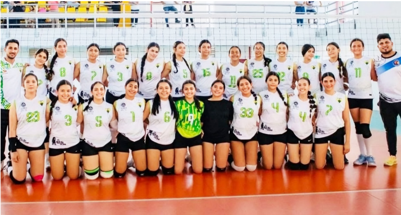
La delegación huilense llega con altas expectativas al campeonato.

El Huila compete con dos equipos en el Nacional Sub-15, reflejo del crecimiento de sus semilleros y del fortalecimiento del proceso formativo en el departamento.