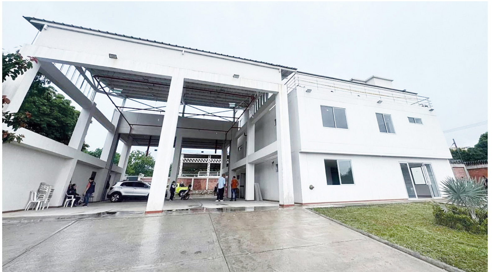
La obra comenzó con un presupuesto base cercano a los $5.200 millones.

Frente a las unidades bomberiles, la directora expresó que vienen adelantando convenios para lograr obtener vehículos en dotación para lograr prestar el servicio en óptimas condiciones en la ciudad de Neiva.