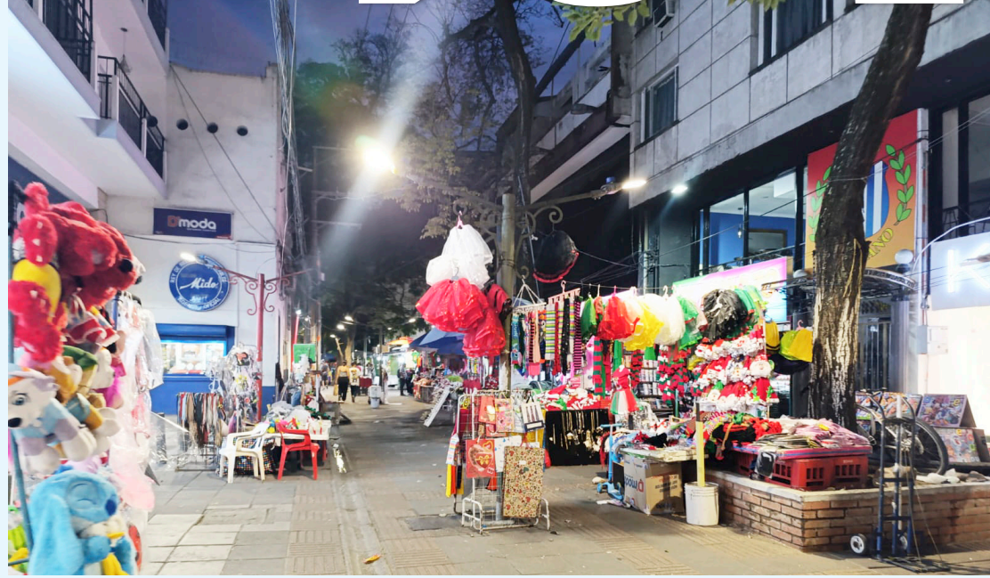
El comercio sigue siendo el sector más golpeado por la reducción en la formación de nuevas unidades productivas.