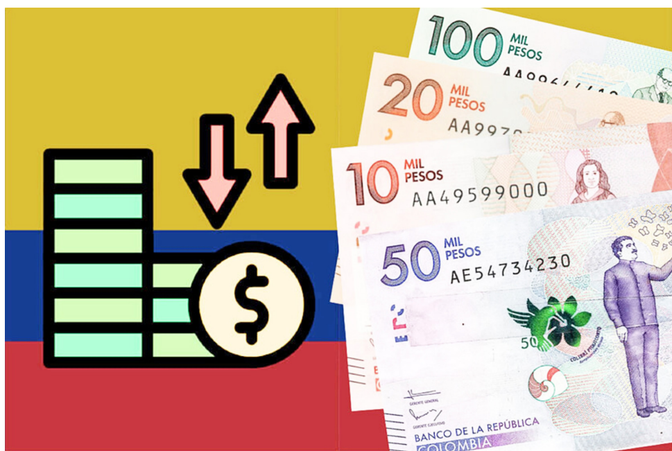
El Gobierno anunció que el aumento del salario mínimo para 2026 superará el IPC proyectado.