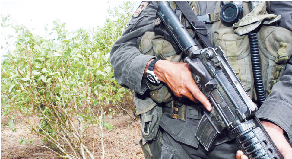
Los municipios donde se han identificado los mayores riesgos se encuentran Tello, Baraya y La Plata.

casos documentados de violencia y asesinatos en contra de líderes sociales que se vienen presentando este año.”