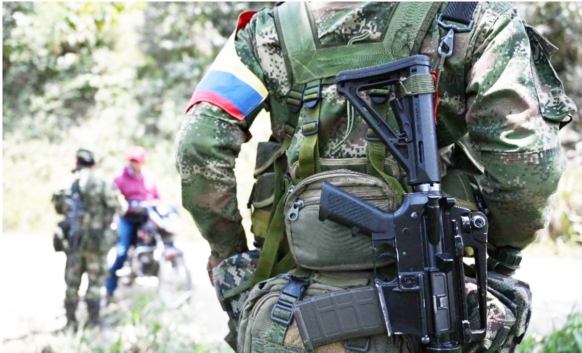
Campamentos en zonas selváticas del Guaviare donde se reporta reclutamiento forzado de menores.

Según datos de organizaciones internacionales, más de 9.000 menores han sido reclutados por grupos armados ilegales en las últimas dos décadas. A pesar de acuerdos, desmovilizaciones y ofensivas militares, esta práctica persiste en al menos 200 municipios del país. Las regiones con mayores riesgos actuales son Cauca, Guaviare, Arauca, Caquetá, Meta y Putumayo.