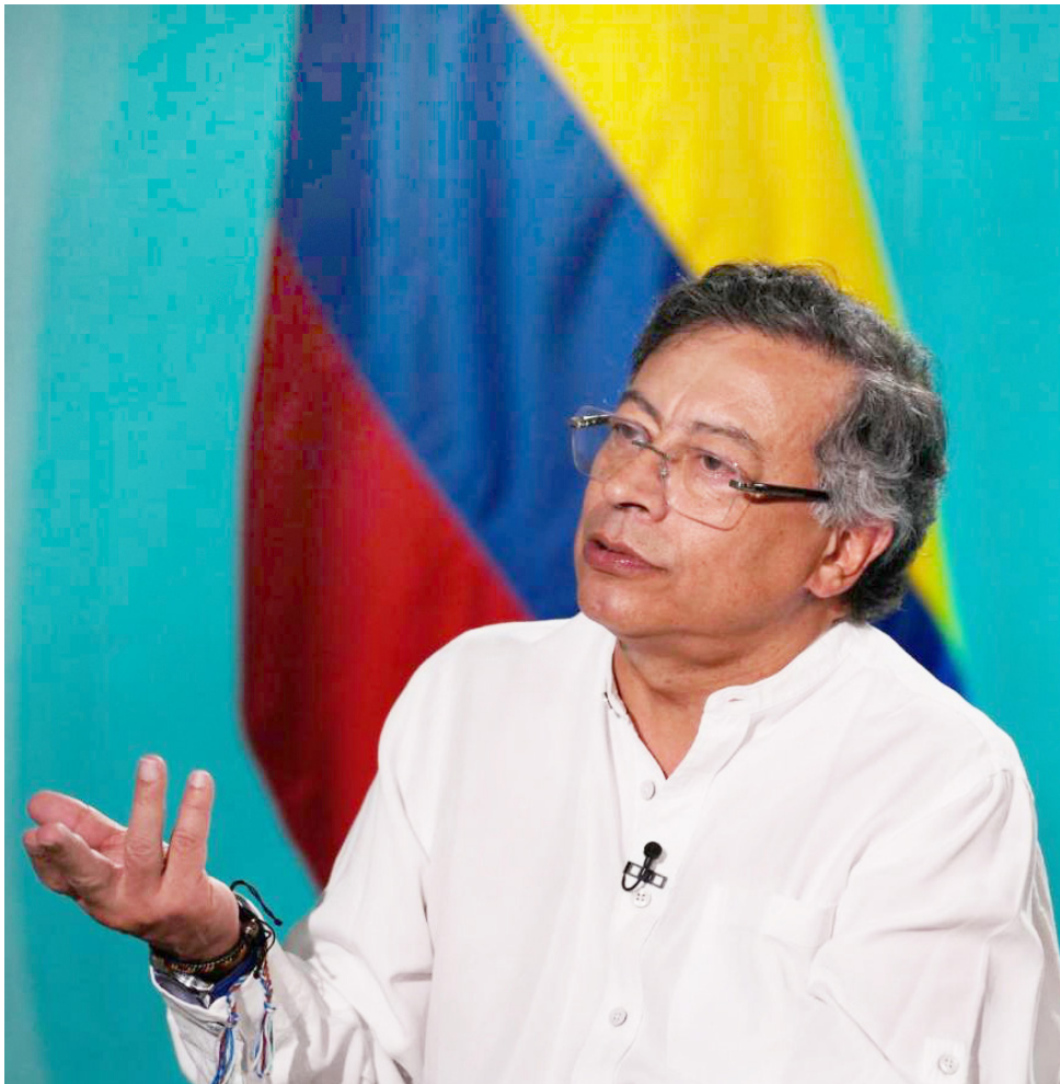
El Gobierno advierte que sin la reforma tributaria podría verse comprometido el Presupuesto General de la Nación para 2026.

La discusión en el Congreso se centra en cómo equilibrar la necesidad de obtener recursos sin afectar de manera desproporcionada a los contribuyentes.