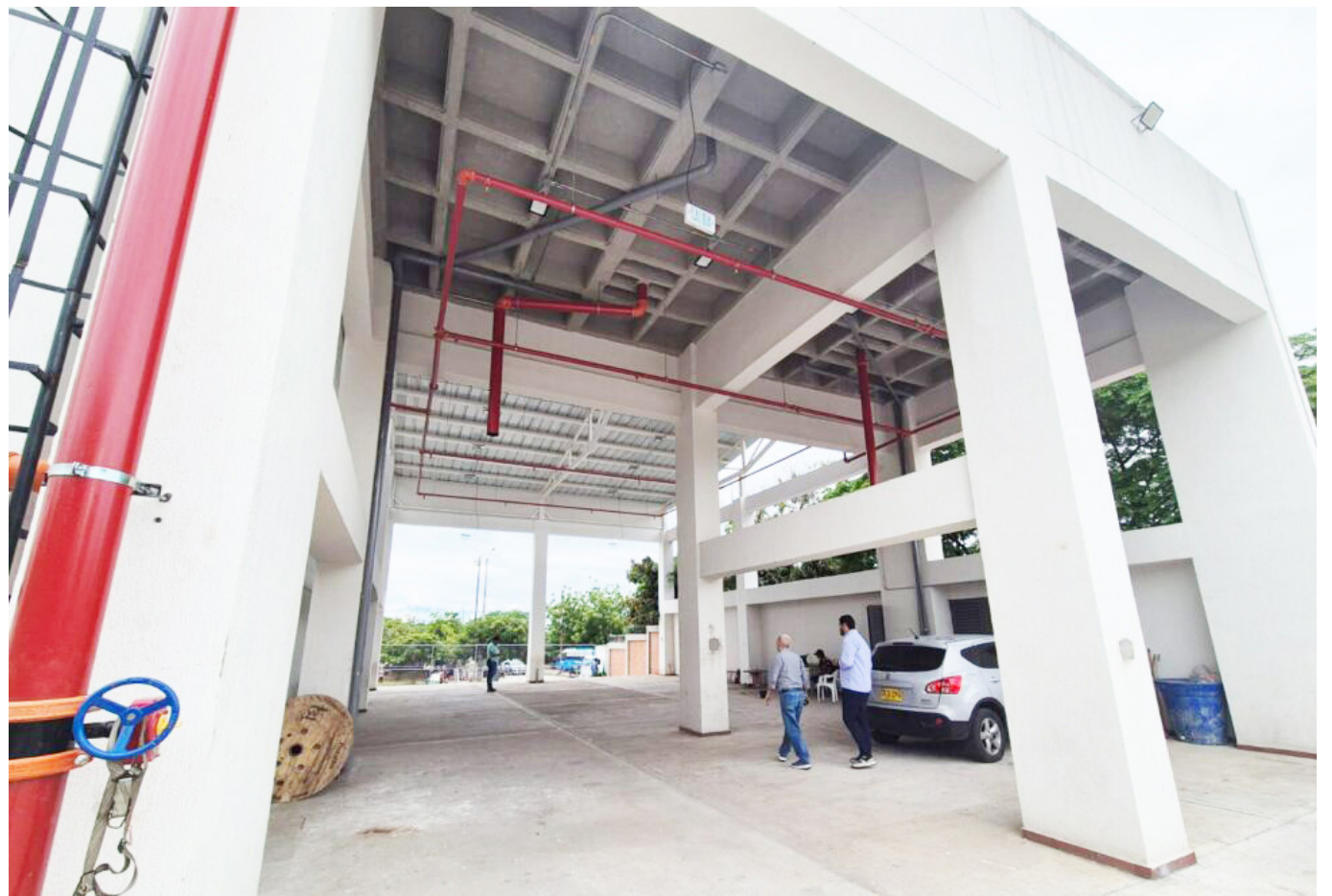
Desde su inicio, la construcción de la subestación enfrentó varios desafíos.

Frente a las unidades bomberiles, la directora expresó que vienen adelantando convenios para lograr obtener vehículos en dotación para lograr prestar el servicio en óptimas condiciones en la ciudad de Neiva.