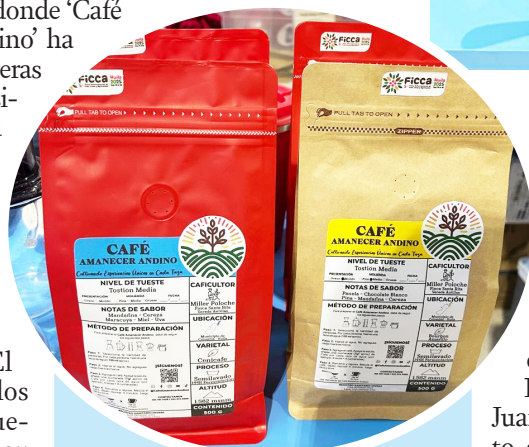
Su café se exporta cada dos meses entre 30 y 50 kilogramos.

Finalmente, entre las montañas, el aroma del Amanecer Andino sigue creciendo. Es más que un café: es una historia de esfuerzo, tradición y orgullo huilense que demuestra que los sueños, al igual que los granos de café, florecen mejor cuando se cultivan con amor.