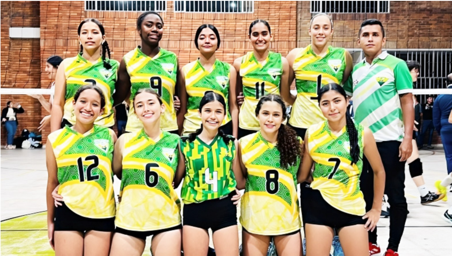
El Huila afronta el Nacional Sub-15 de Voleibol con una doble representación.

El trabajo que hoy respalda la participación huilense tiene origen en clubes que vienen impulsando la formación desde tempranas edades. En la convo-