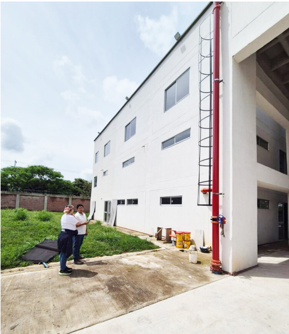
Subestación bomberil de la Comuna 10 de Neiva.

El 20 de enero del año 2022, con la presencia de presidentes