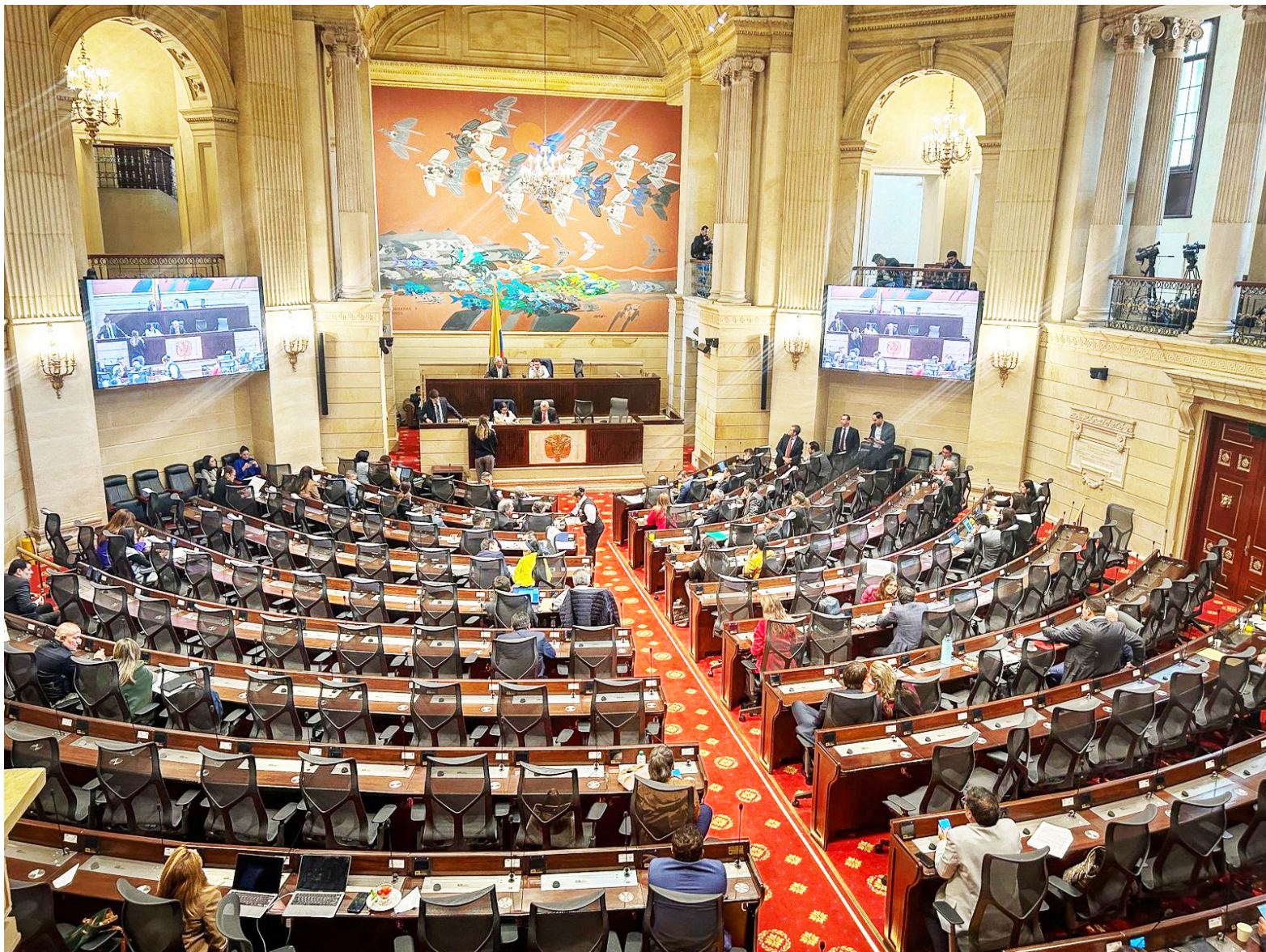
Propuesta de reforma tributaria será discutida en las comisiones económicas del Congreso.

■ La reforma tributaria que el Gobierno presentó con una meta inicial de recaudo de 26,3 billones de pesos fue reducida a 16,3 billones después de las primeras rondas de negociación. Con el recorte también llegó la claridad sobre qué impuestos se mantendrán en el proyecto que será discutido en el Congreso. La apuesta es crucial para sostener el Presupuesto General de 2026, estimado en 530,6 billones de pesos.