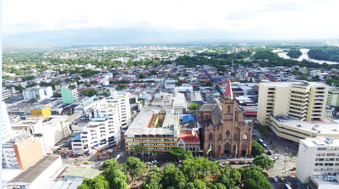
En junio se registró la mayor caída mensual en la creación de empresas desde 2022, según Informa D&B.