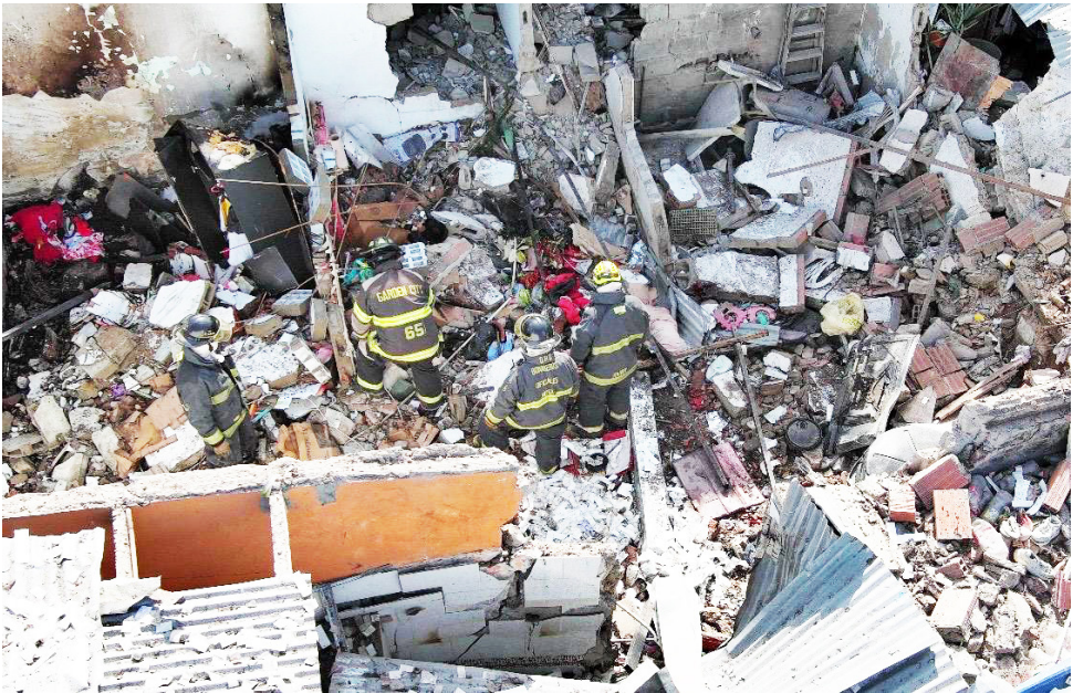
Cuentan con 49 unidades de las cuales tres son los jefes de turno.

Además de su importancia operativa, la comunidad ha depositado grandes expectativas en esta obra, dado el impacto positivo que representará en términos de tiempo de respuesta y atención a emergencias. Sin embargo, los reiterados aplazamientos han minado la confianza en la gestión de la construcción, lo que obliga a las autoridades municipales y contratistas a priorizar su finalización y aunque ya la obra fue entregada, aun no esta en funcionamiento debido a que trabajan en la gestión de la dotación, se espera que para el 2026 el oriente de Neiva ya tenga al servicio esta subestación.