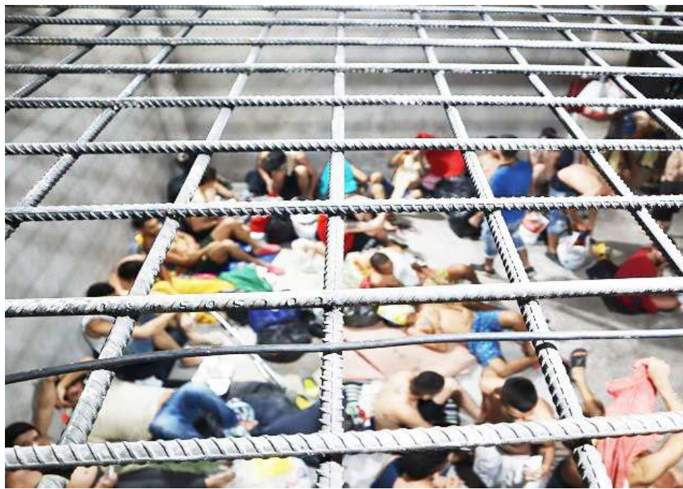
Actualmente este lugar registra doce casos de tuberculosis.