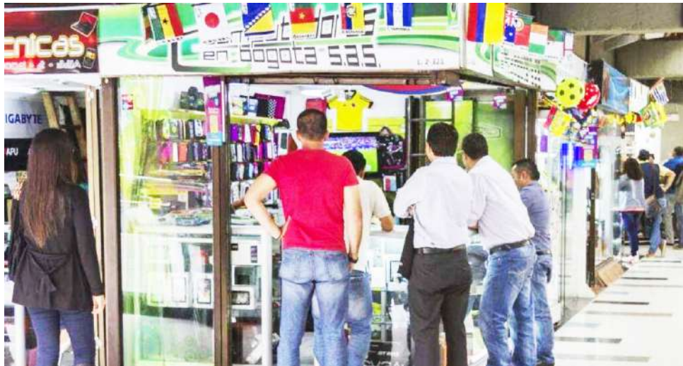
Córdoba fue el único departamento que registró crecimiento en creación de empresas durante el primer semestre del 2025.

namismo debido a la planificación anual y a las obligaciones tributarias, este comportamiento no logró compensar la tendencia decreciente que se ha acentuado mes a mes. De hecho, mientras en el primer trimestre del 2022 se crearon 88.866 empresas, en el mismo periodo del 2025 la cifra cayó a 59.640, una disminución