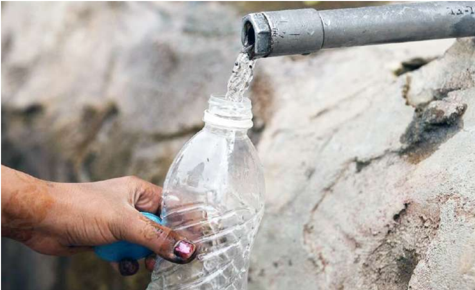
Las Ceibas E.S.P. cuenta con 135.000 suscriptores en acueducto.

Se enfatizó en la necesidad de criterios de focalización claros, articulados con el Sisbén y con la caracterización socioeconómica municipal. Las Ceibas reafirmó su compromiso con el proceso y aclaró el alcance legal sobre la prestación del servicio.