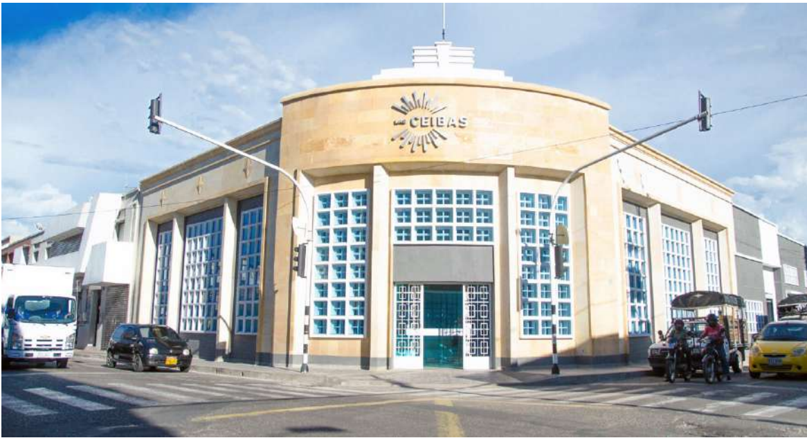
Las Ceibas reafirmó su compromiso con el proceso.

El derecho fundamental al agua tiene rango constitucional y ha sido desarrollado ampliamente por la Corte Constitucional, que en múltiples fallos (T-410/03, T-717/10, T 091/10, T-552/13, entre otros) estableció el estándar de 6 metros cúbicos por hogar al mes como dotación mínima para garantizar la vida digna. Más recientemente, el Decreto 0776 de 2025 reglamentó la implementación progresiva del mínimo vital de agua, definiendo como referencia 50 litros por habitante por día, lo cual introduce un parámetro diferenciado según el número de personas en cada hogar. En ese marco, es fundamental precisar que: • La competencia para implementar el programa de mínimo vital corresponde al Municipio, conforme a los artículos 6, 9, 10 y 11 del Decreto 0776 de 2025 y a la Ley 1176 de 2007, que establece que los subsidios y ayudas