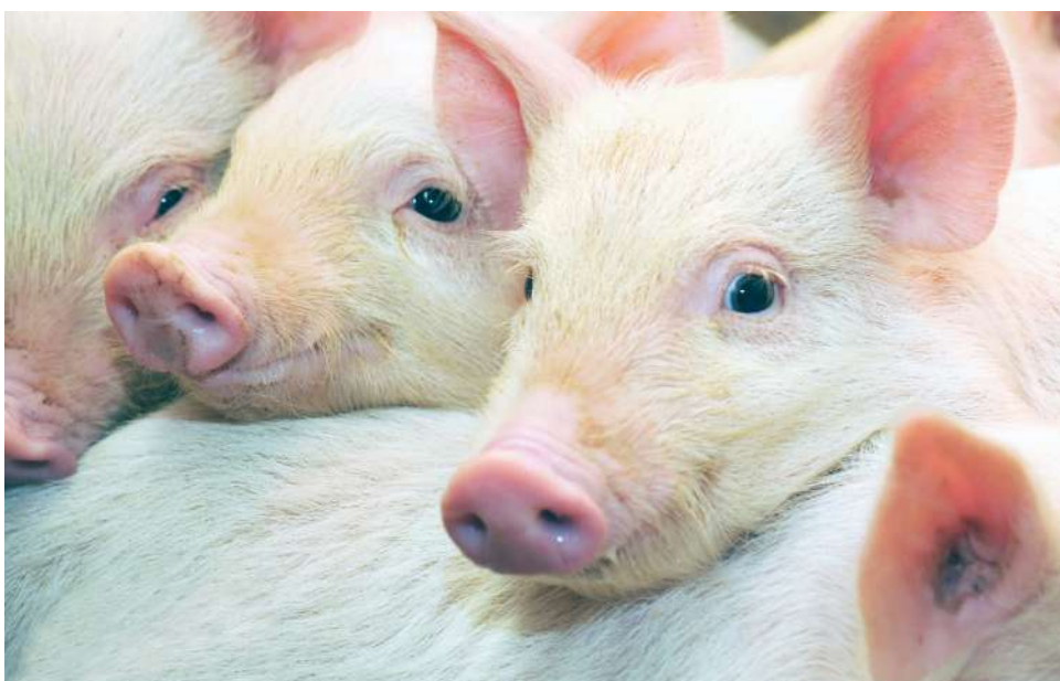
Más de 4.500 productores en el sur del país trabajan por debajo del punto de equilibrio.

“Con un precio de 7.500 pesos por kilo en pie, cientos de poricultores trabajan a pérdida y podrían cerrar sus granjas”