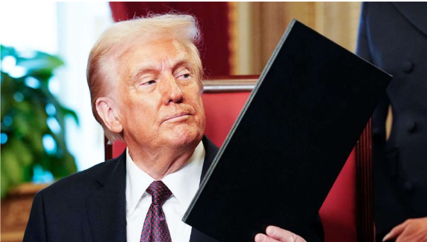
La orden ejecutiva de la Casa Blanca aplica de manera retroactiva desde el 13 de noviembre.

plementó con crecimiento en otros productos agrícolas, también incluidos en el levantamiento del arancel. El banano subió 64% (US$127,6 millones), las rosas aumentaron 1% (US$139,2 millones), las puertas y marcos de aluminio se incrementaron 5% (US$261,6 millones), los crisantemos crecieron 10% (US$62,5 millones) y los claveles 8% (US$61,9 millones).