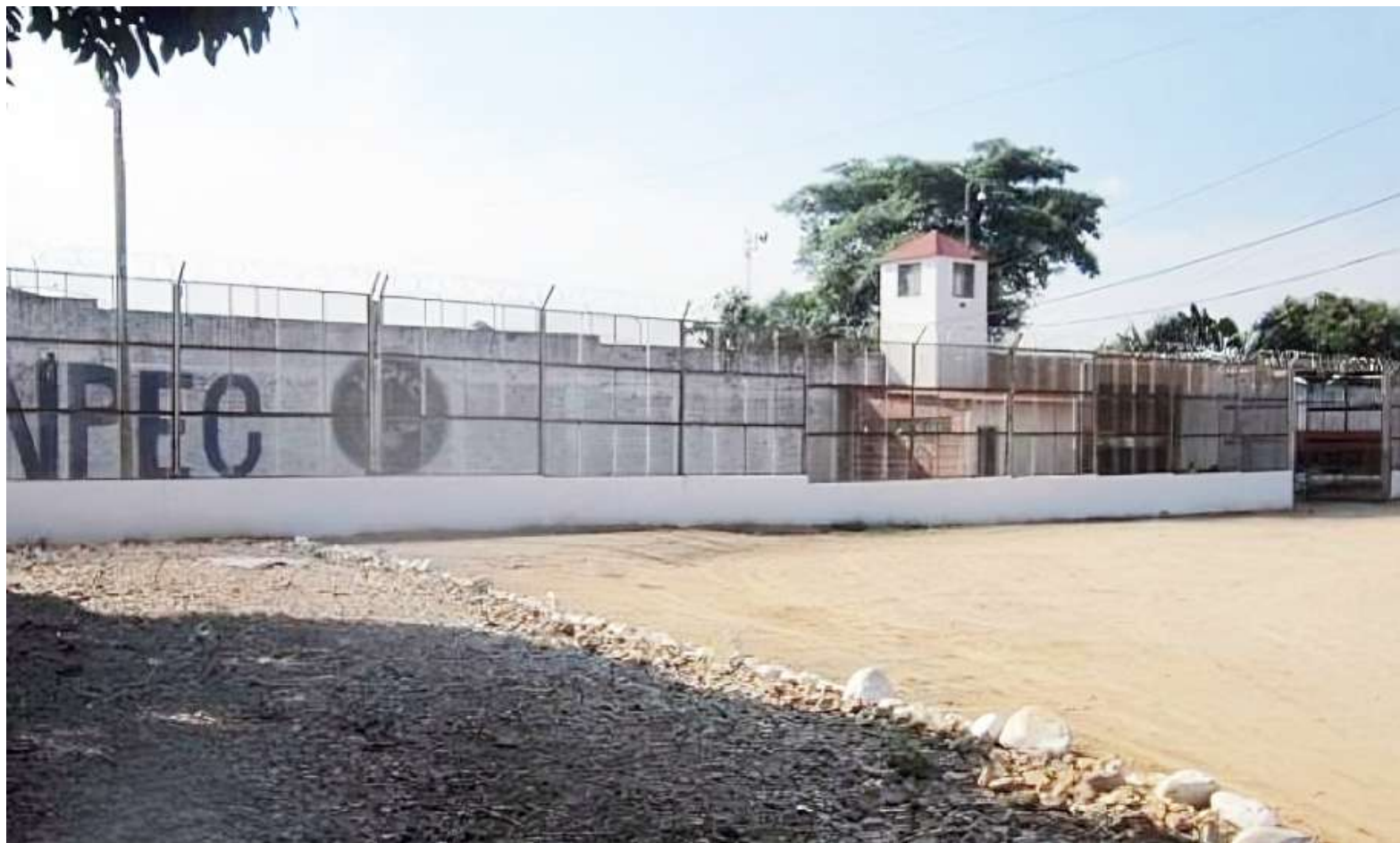
Esta es una situación permanente, por las condiciones de aglomeración.