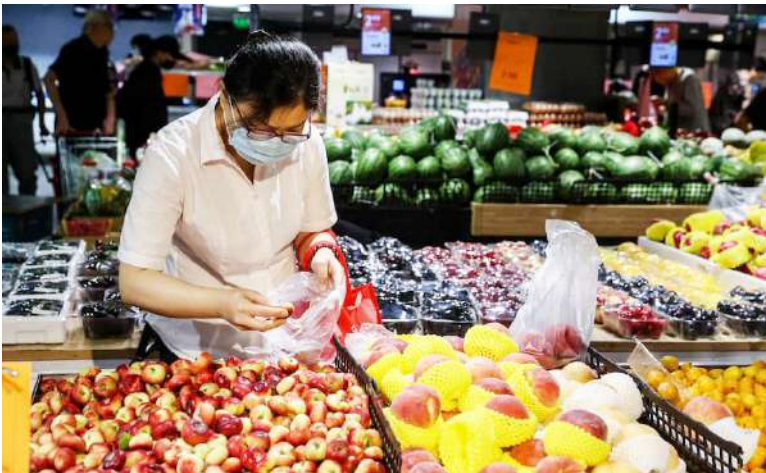
Las regiones del sur del país presentaron caídas del 100 %, reflejando un deterioro sin precedentes en la actividad empresarial.

La creación de empresas cayó un 77 % en junio, el mes más crítico del 2025, evidenciando un freno abrupto del emprendimiento en Colombia.