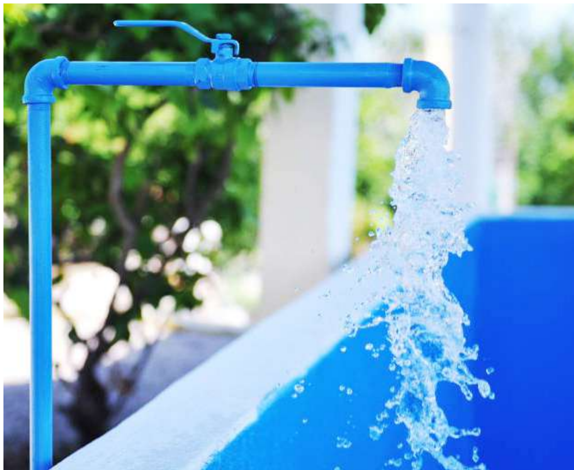
La implementación exige un acto administrativo del Concejo Municipal.

Por otro lado, Serna, resaltó la presencia del gerente de Empre-