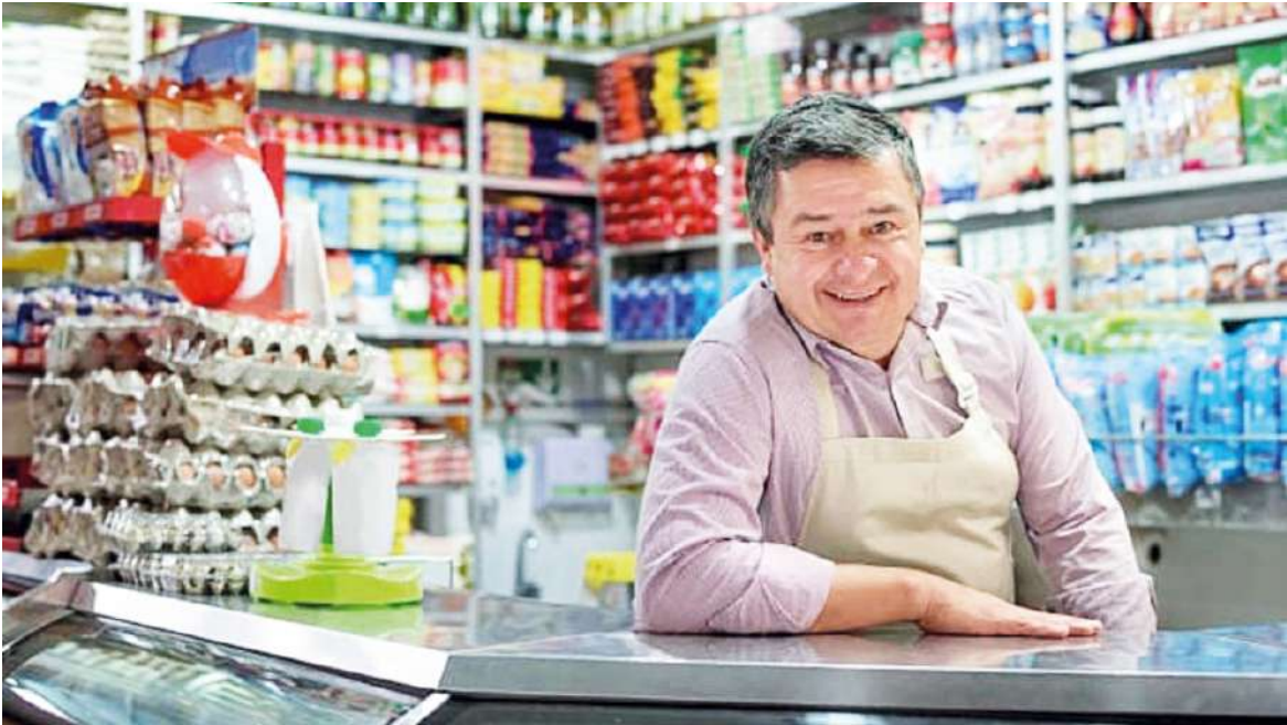
El comercio fue el sector más afectado, con más de 15.000 empresas menos frente al año anterior.

La dinámica empresarial en Colombia atraviesa uno de sus momentos más complejos de los últimos años. De acuerdo con un informe de Informa D&B, entre enero y junio del 2025 se constituyeron 91.992 empresas, cifra que representa una caída del 32 % frente al mismo periodo del 2024, cuando se registraron 135.070 nuevas unidades productivas. El dato más crítico se evidenció en junio, mes en el que solo se crearon 4.038 empresas, una disminución del 77 % frente al año anterior. La tendencia se había empezado a delinear desde abril, con 15.641 nuevas firmas (-31 %), y se acentuó en mayo, cuando apenas surgieron 12.673 unidades productivas (-36 %). Aunque los primeros meses suelen concentrar un mayor di-