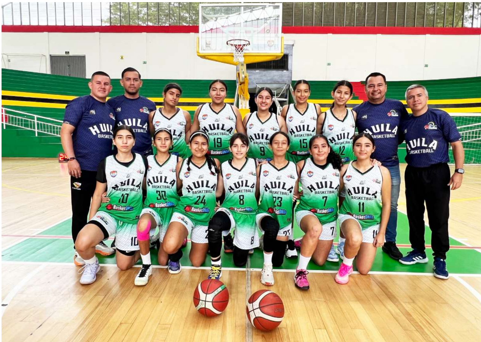
Huila A compite con una base experimentada y pelea su clasificación en el Interligas Sub 14.

Por este motivo, el Interligas Sub 14 no solo mide resultados; permite evaluar la evolución técnica, la madurez competitiva, la capacidad de respuesta ante rivales exigentes y el trabajo realizado por los departamentos en la construcción de semilleros. El torneo es además un espacio en el que se identifican estilos de