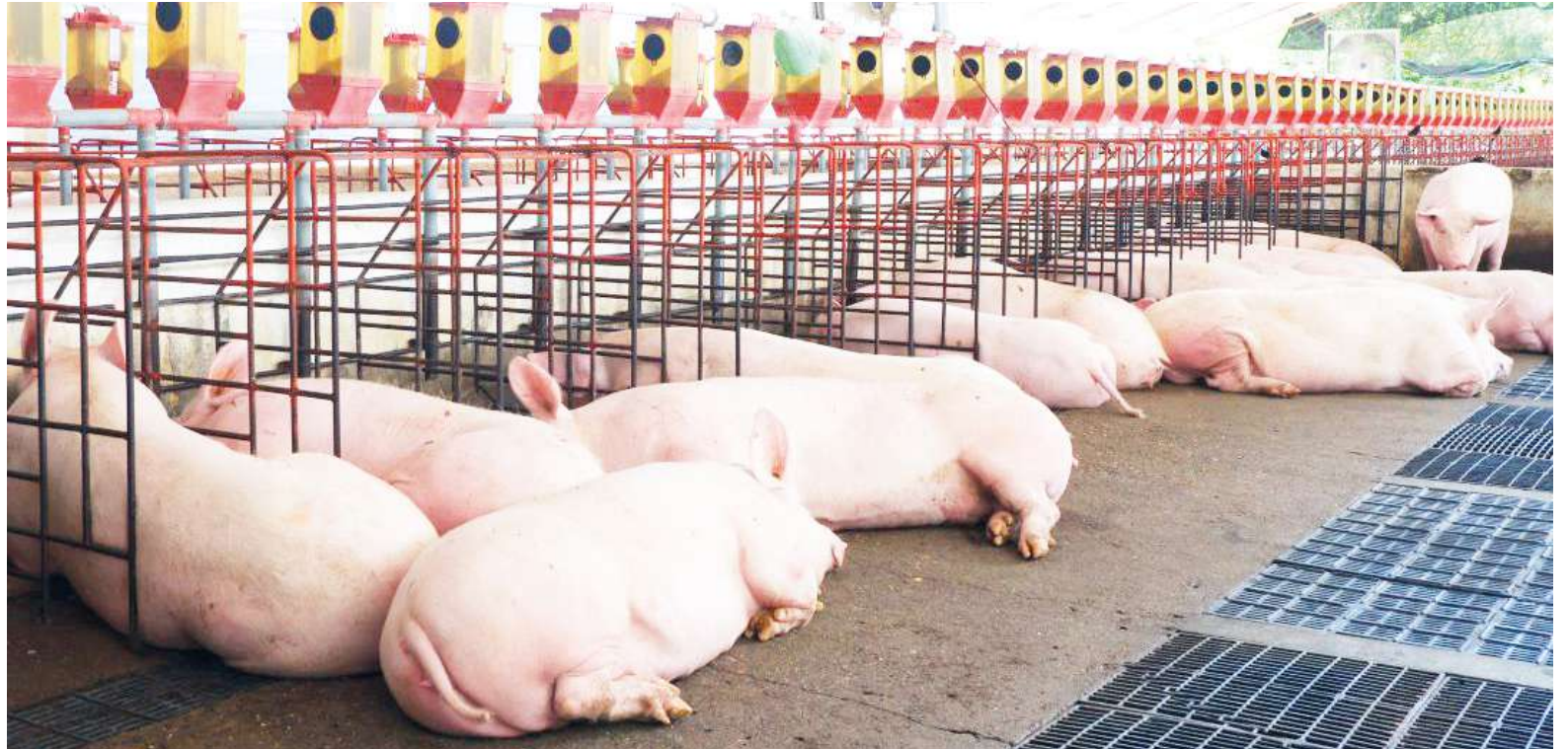
Pequeños poricultores del Huila advierten que los bajos precios los tienen al borde del cierre.

■ La caída histórica en los precios, la sobreoferta nacional y la llegada masiva de carne importada tienen al borde del cierre a miles de poricultores en el sur del país. Productores advierten que, de no aplicarse medidas urgentes, la región perdería una de sus actividades pecuarias más arraigadas.