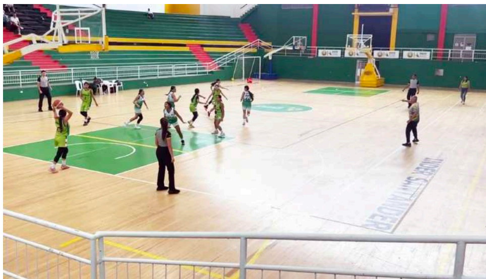
El Huila fortalece su proceso deportivo con dos equipos en competencia.

Este torneo es el inicio de la competencia para los deportistas de 14 años que ingresan al ciclo olímpico