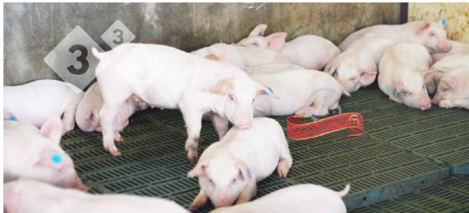
La llegada de carne de Antioquia y de otros países ha saturado el mercado local.

ecuación es simple: “con esos precios, nadie gana; todos perdemos”.