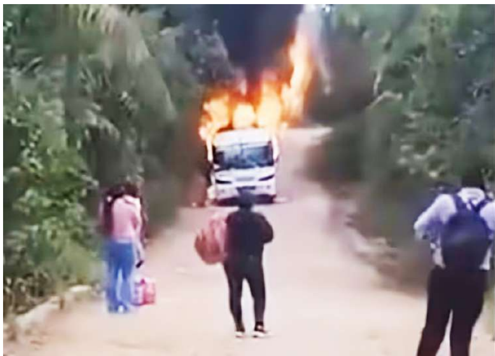
En Gigante, un bus de servicio público fue incinerado en zona rural, aumentando la preocupación por el avance de los grupos armados.