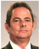
Germán Vargas Lleras

Hace apenas quince días nos referíamos en estas notas dominicales a la importancia de avanzar con acciones concretas hacia la muy referida “unidad” que el país reclama para la elección presidencial del 2026, con el propósito de enfrentar al señor Petro en su intención de perpetuarse en el poder. Varias reuniones de los líderes de los partidos tradicionales hicieron ver la situación con un relativo optimismo, tanto que me animé a proponer un mecanismo vinculante de depuración, antes de finalizar el año, que permitiera llegar al escenario de una gran consulta en las parlamentarias de marzo. Pero advertí que uno de los peligros de la atomización era el indeseable enfrentamiento entre candidatos y partidos llamados a unirse por su origen y propuestas. Lo dicho se cumplió, y de qué manera. La gran encuesta del Centro Democrático, ejemplo concreto de lo que todos deberían estar haciendo, sucumbió inexplicablemente en medio de reclamos entre sus aspirantes. En el Partido Conservador salieron también a flote las disputas internas. Ni qué decir de la crisis en la Fuerza de las Regiones o del renaciente enfrentamiento entre el liberalismo y el Nuevo Liberalismo, que aleja cualquier posibilidad de en-