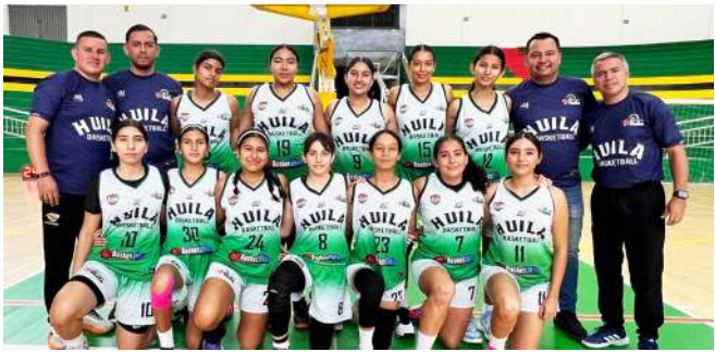
Doble presencia del Huila en el Interligas Sub 14 De baloncesto