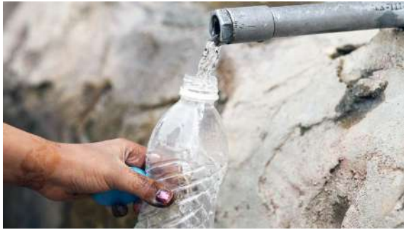
Buscan implementar el mínimo vital de agua en Neiva