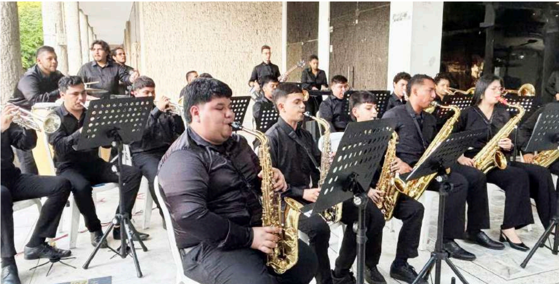
La Big Band de la Banda Sinfónica Metropolitana llenó de ritmo y energía la plazoleta de la Alcaldía de Neiva, marcando el inicio de una temporada navideña llena de música y encuentros culturales.