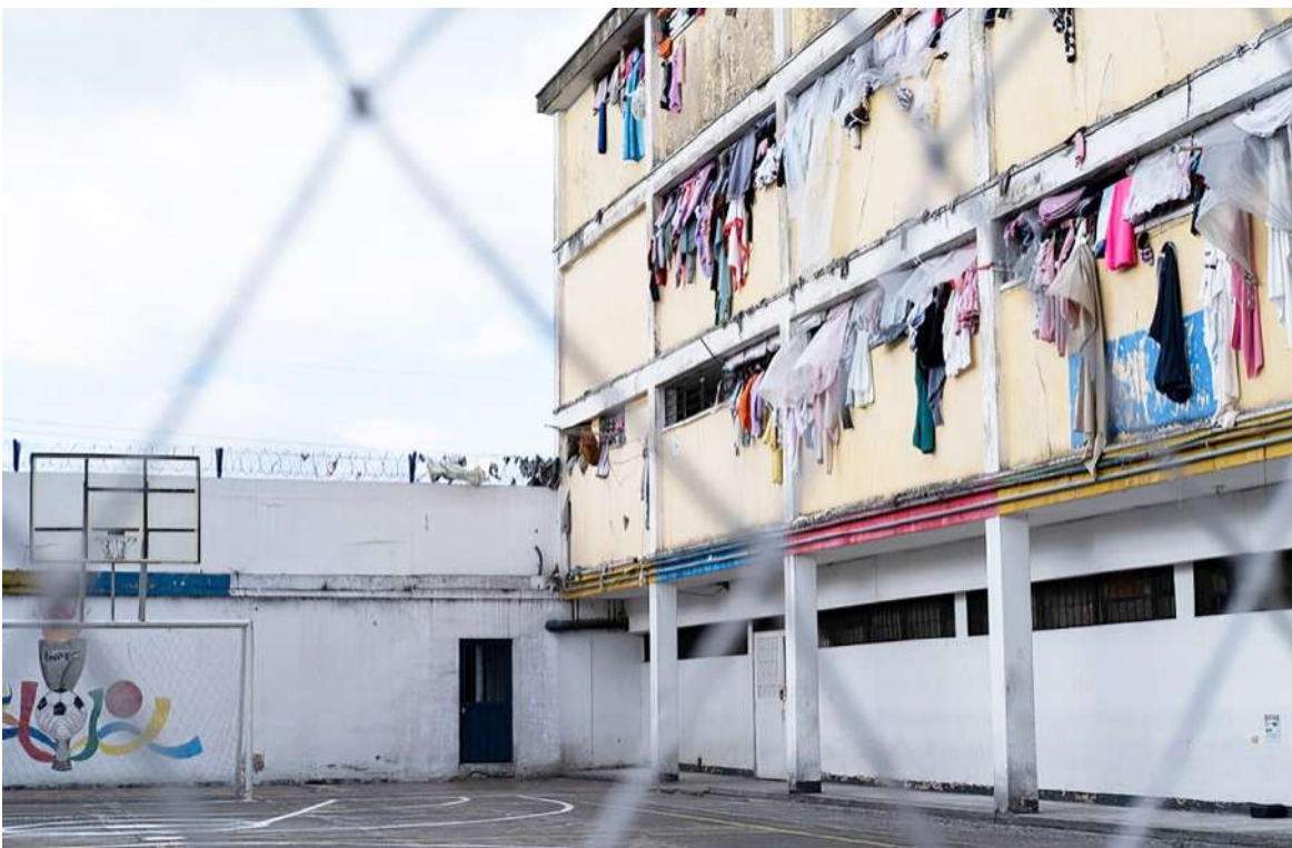
Este panorama tiene en alerta a las autoridades.

Neiva ha venido padeciendo en los últimos años un problema de hacinamiento en los centros de detención transitorio, actualmente el hacinamiento supera el 250%, autoridades municipales han anunciado que antes que culmine el año las personas privadas de su libertad serán trasladadas a un lugar más amplio que las antiguas bodegas de Alpina. “Es uno de los requerimientos constantes que tanto la Procuraduría en las mesas departamentales como la personería a nivel de las mesas penitenciarias municipales y en el ejercicio cotidiano de control que ejercemos, hemos venido solicitando,