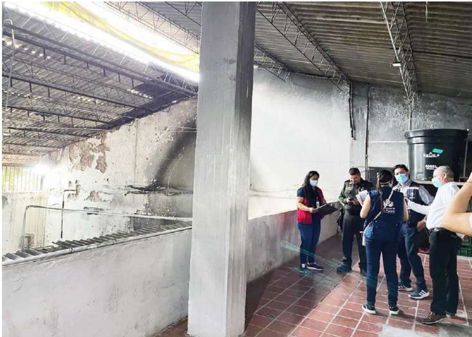
Esto complica la estadía de los cientos de reclusos que allí reposan.

El caso del centro penitenciario de Rivera refleja una problemática estructural del sistema carcelario colombiano, donde la sobrepoblación y las condiciones precarias de infraestructura afectan no solo la salud de los internos, sino también la del personal de custodia y administrativo.