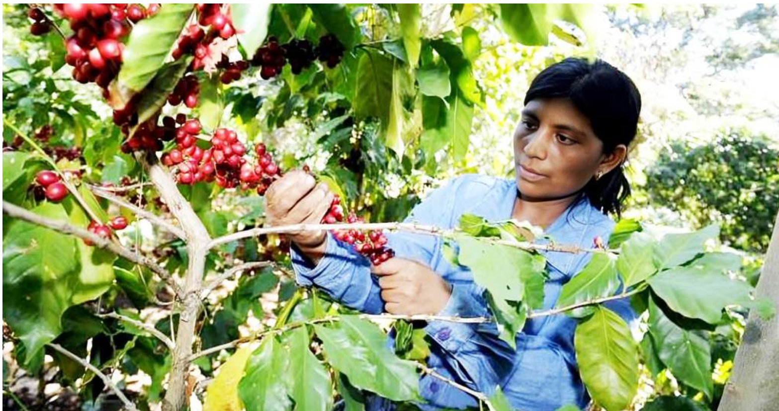
Productores de café del Huila cerraron 2025 con el primer lugar nacional en producción.

■ La decisión del gobierno estadounidense, anunciada mediante orden ejecutiva, elimina el arancel recíproco de 10% para bienes como café, té, frutas tropicales, cacao, especias, carne y fertilizantes. El gerente de la Federación Nacional de Cafeteros, Germán Bahamón, destacó que la medida representa un alivio técnico y comercial para el país y para los consumidores en ese mercado.