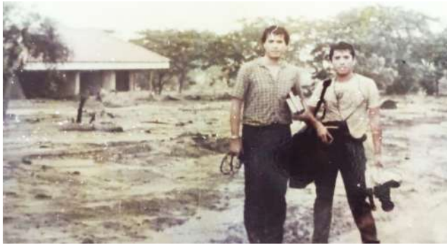
ARMERO: Una tragedia que pudo evitarse