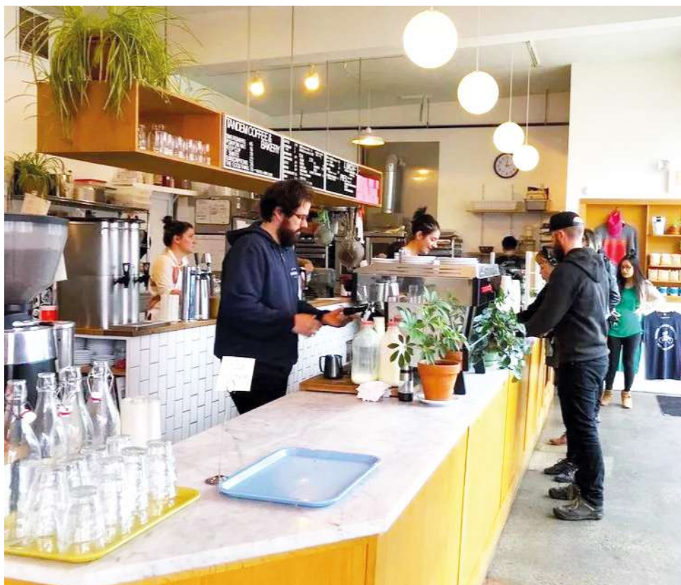
Estados Unidos continúa siendo el mayor comprador de café colombiano en 2025.

El retiro del arancel del 10% deja libre de gravamen al 13% de la canasta exportadora agrícola de Colombia.