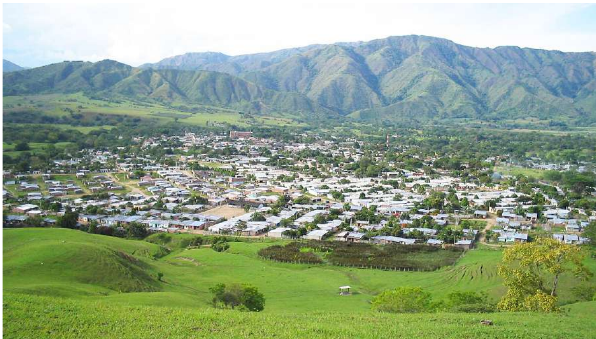
En la vereda Bellavista, dos ciudadanos fueron atacados a tiros mientras se desplazaban en motocicleta, uno de los hechos que alertó al congresista.

presencia para intentar frenar la cadena de acciones violentas que se ha vuelto recurrente en varias zonas del departamento.