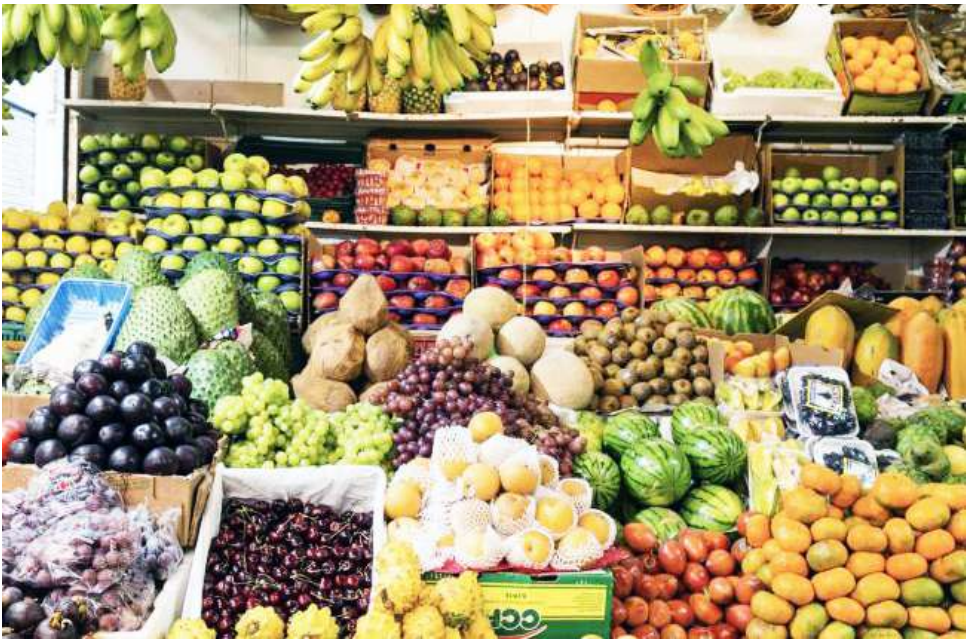
Los productos agrícolas colombianos recuperan competitividad con la eliminación de los aranceles en Estados Unidos.

El Huila, por su parte, cerró el año cafetero 2025 como el primer productor del país, con