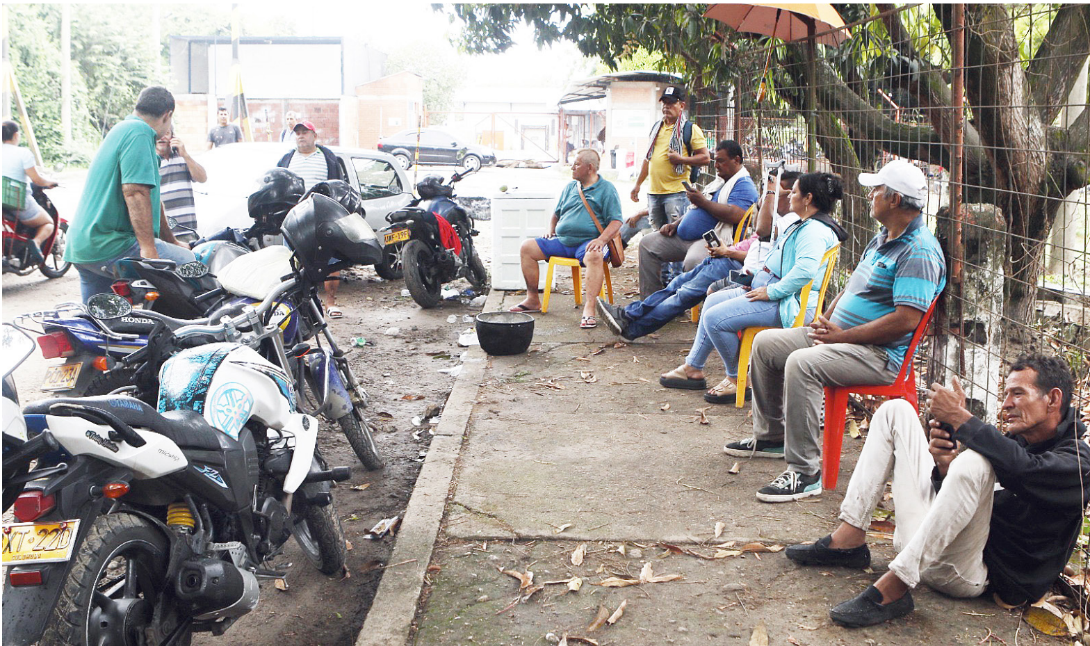
Voceros del gremio preparan sus argumentos para la mesa de concertación convocada por la Secretaría de Salud.

Pese al clima de tensión, para hoy a las 10:00 a.m. está progra-