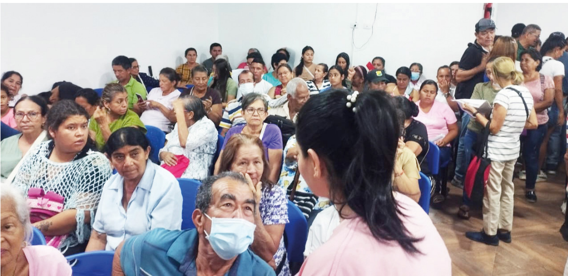
Este dispensador entrega medicamentos de diferentes EPS.

La Personería registró casos donde Discolmets aseguraba no