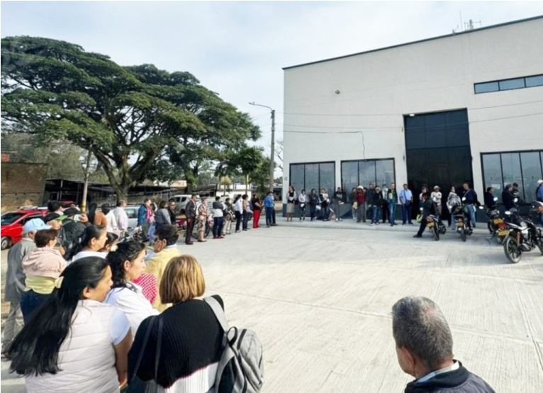
Las mayores quejas se dan en Discolmets.