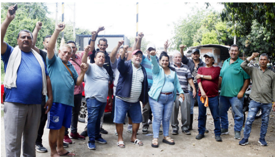
Paro en Ceagrodex amenaza el suministro de carne en Neiva