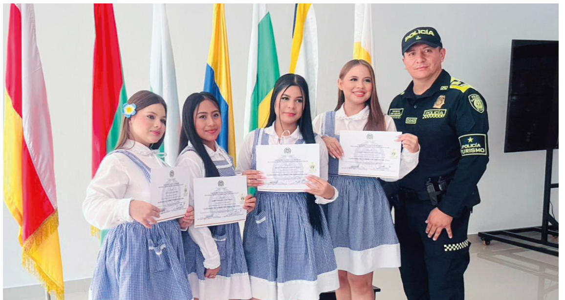
Estudiantes del Liceo Santa Librada reciben sus certificados como parte del programa “Guardianes del Turismo y Patrimonio Nacional”, en una ceremonia liderada por la Policía Nacional en Neiva y acompañada por padres de familia.