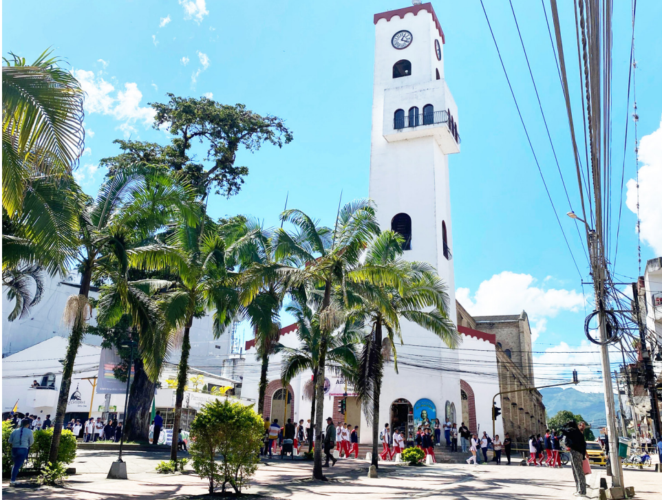
Grave crisis de salud en Pitalito.

Durante la temporada de lluvias o en días de sol intenso, la bodega cierra parcialmente la puerta, lo que reduce todavía más el espacio de evacuación.