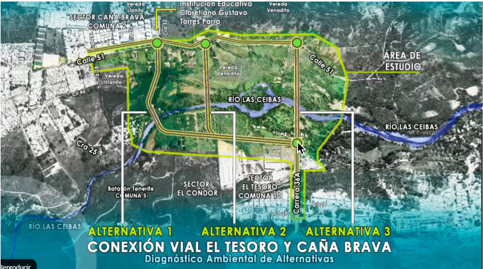
Las alternativas presentadas para el puente Caña Brava - El Tesoro.