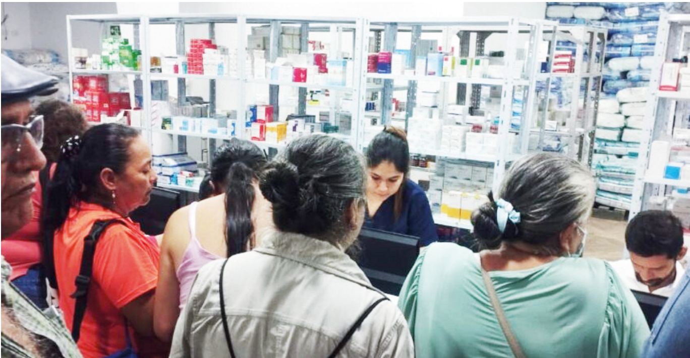
Usuarios intentando reclamar sus medicamentos.

Lo que ocurre en Pitalito es el reflejo de un sistema de salud que está al borde del colapso, pero también es evidencia de la falta de articulación entre los actores que deberían garantizar un derecho fundamental.