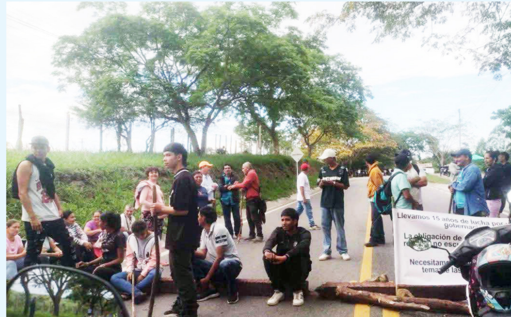
Por más de 24 horas duró el bloqueo intermitente.

Al cierre de la edición se conoció que sobre las 6:00 p.m. de ayer jueves los jorna-