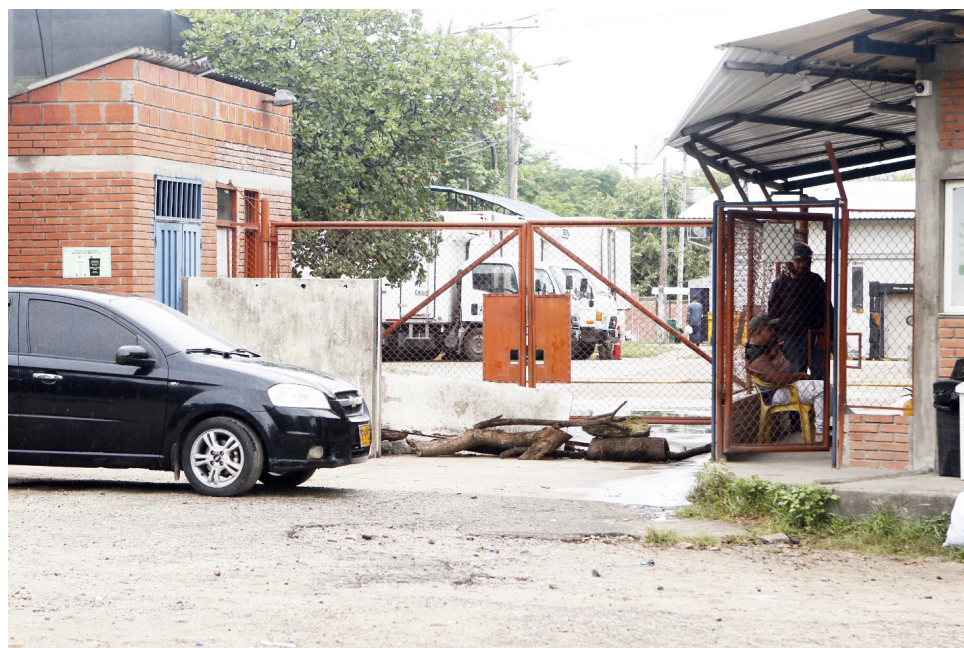
Expendedores de carne y porcicultores permanecen en la entrada de la planta, donde se concentran desde hace dos días.

Aunque hoy se instalará una mesa de concertación, los expendedores advirtieron que no levantarán el bloqueo hasta que existan soluciones concretas.