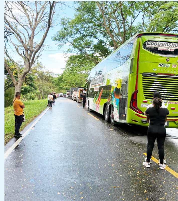
La situación afectó a transportadores que se dirigían hacia el sur del país.

“El gobierno nacional ha hecho un avance grandísimo que no lo había hecho ningún gobierno, este gobierno sí