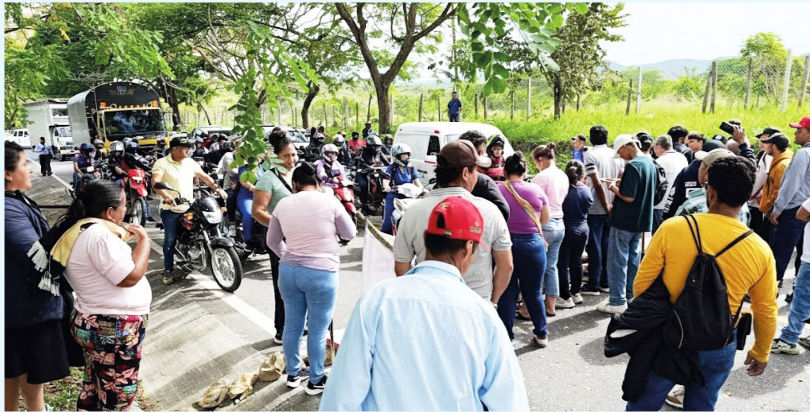
Más de 300 personas hacían presencia en el bloqueo.

La protesta, que comenzó en horas de la mañana del pasado miércoles tuvo como objetivo presionar a las autoridades nacionales y a la compañía para que se reactive el diálogo y se adopten