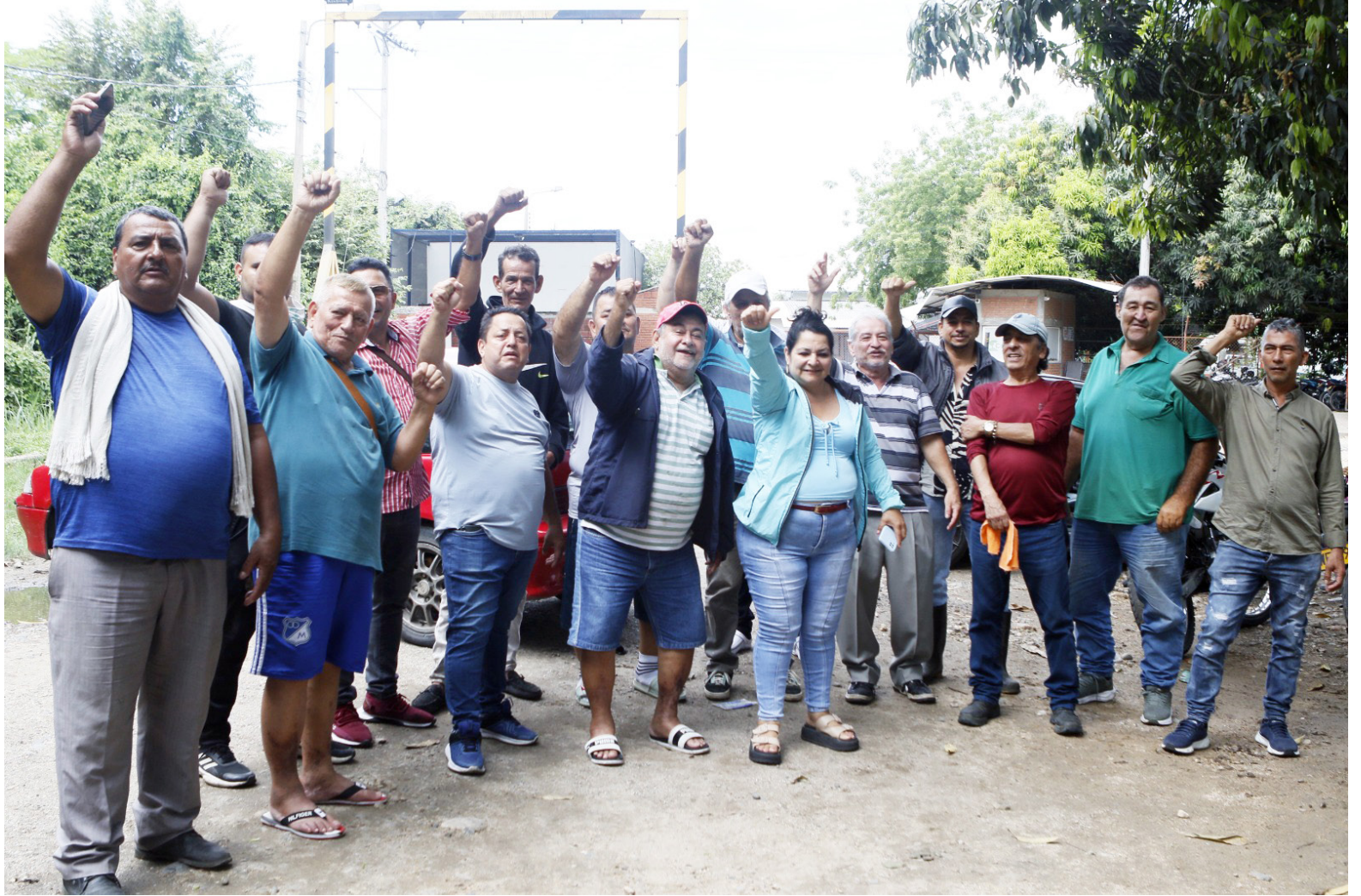
Manifestantes mantienen bloqueados los accesos a Ceagrodex mientras avanza el paro indefinido en Neiva.

Aunque hoy se instalará una mesa de concertación, los expendedores advirtieron que no levantarán el bloqueo hasta que existan soluciones concretas.