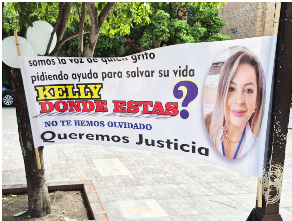
Este viernes se llevará a cabo otra audiencia.

El impacto emocional también lo padecen sus nietas. “Hemos estado en psicólogos. Están muy afectadas”, contó, lamentando la falta de acompañamiento institucional. Aun así, insiste en participar en cada plantón convo-