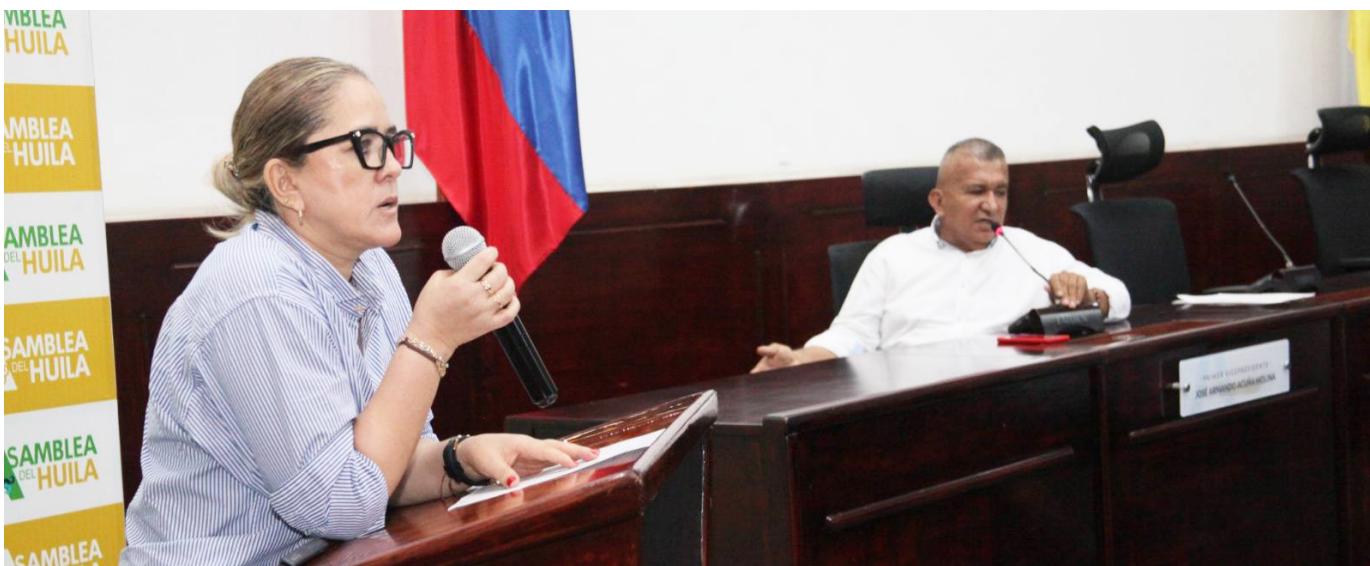
El proyecto busca mejorar la movilidad de más de 400.000 habitantes y abrir nuevas alternativas de conexión para la ciudad de Neiva.

Diputados advirtieron que Neiva no puede permitirse otra obra inconclusa: exigieron estudios y diseños sólidos, articulación con el Gobierno Nacional y celeridad en el licenciamiento ambiental para iniciar la construcción.