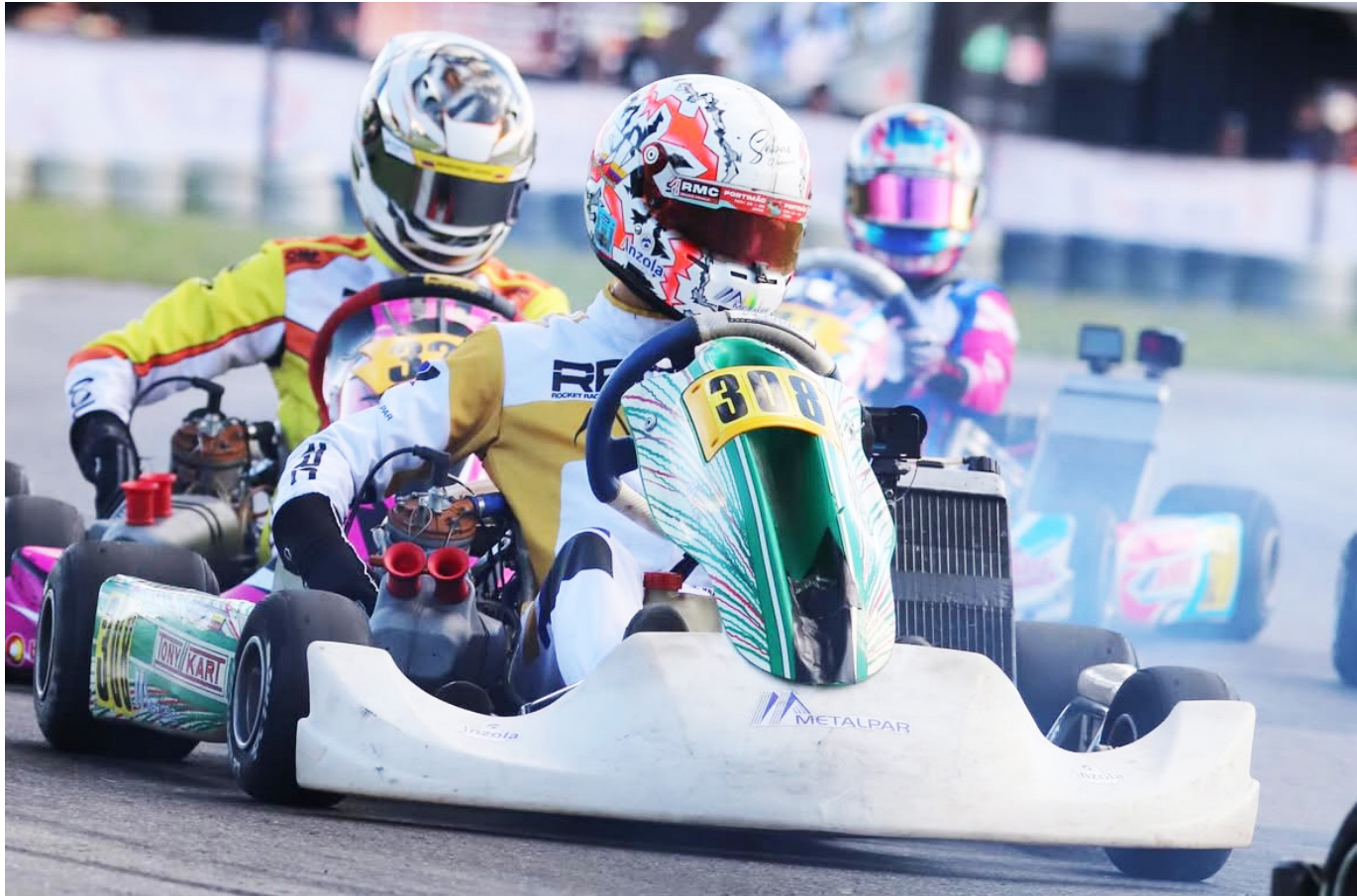
Los dos pilotos se preparan en el paddock para afrontar su última presentación del año.

La carrera final del evento está programada para este domingo y definirá el cierre de temporada para ambos corredores.