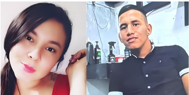
Pareja fue atacada en zona rural de Algeciras