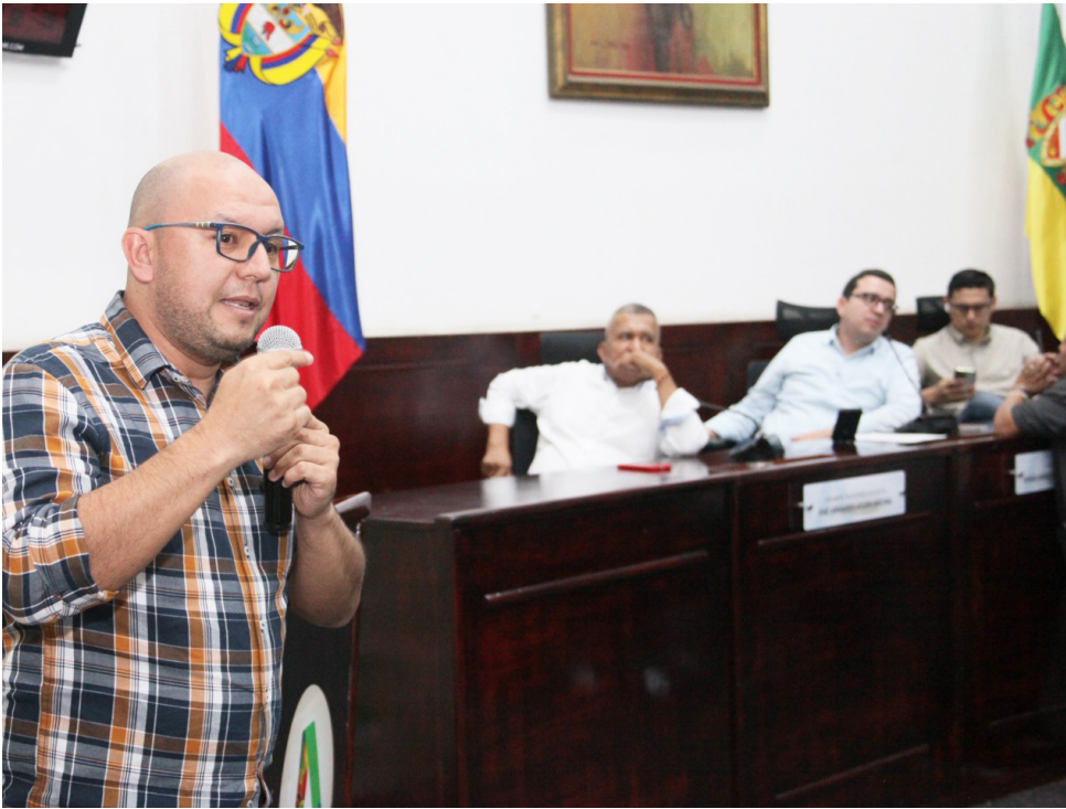
Autoridades municipales y departamentales explicaron los avances en estudios y diseños del proyecto de conexión vial en Neiva.

lidad del proyecto y la protección de las viviendas y ecosistemas cercanos. La obra se ejecutará por fases, debido a su alto costo. En una primera etapa se construirá una sola calzada y un solo puente con tres carriles, dejando completamente diseñados, aprobados y viabilizados los elementos requeridos para una segunda calzada y un segundo puente que podrán ejecutarse en futuras administraciones. La alternativa 2 también se adaptó a la realidad predial: en el sector Tesoro existen áreas a nombre del municipio, y en Caña Brava el propietario ha manifestado disposición para la cesión a título gratuito. Sin embargo, el principal reto del cronograma no está en los predios sino en el licenciamiento ambiental, que por normatividad puede tardar entre seis y ocho meses y es requisito indispensable para iniciar la contratación. Este corredor, aunque no permite ejecutar la Circunvalar del Oriente completa, sí constituye un tramo funcional y técnicamente coherente con su trazado preliminar, generando conectividad, acceso y descongestión para una zona de crecimiento acelerado en Neiva.