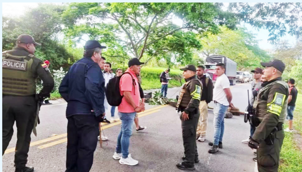
Autoridades estuvieron monitoreando la situación.

medidas concretas frente a las afectaciones que según los campesinos persisten desde la construcción de la hidroeléctrica.