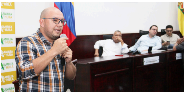
Asamblea le pone 'lupa' a puente Cañabrava-Tesoro