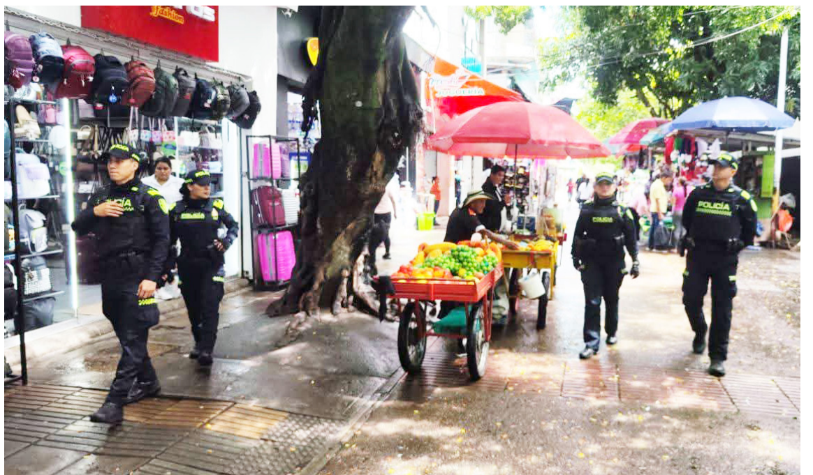
Los planes de seguridad que adelanta la Policía de Metropolitana en el parque Santander.