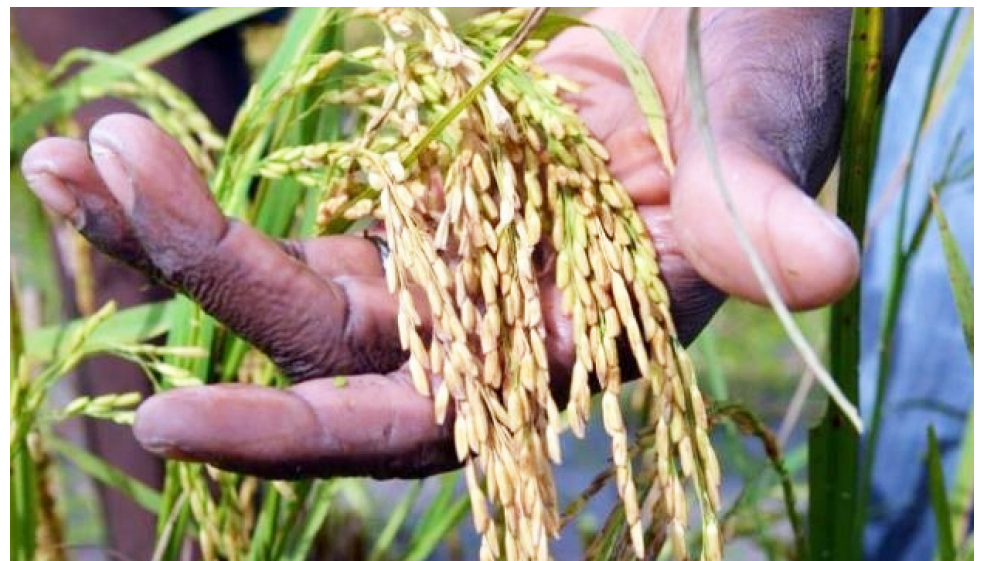
La prórroga de los precios garantiza la estabilidad de los ingresos para los arroceros, pero el contrabando sigue siendo una amenaza para el mercado interno.

El arroz sigue siendo un pilar fundamental en la economía del Huila. No solo por su impacto económico, sino también por la relevancia social del cultivo. Miles de familias dependen directamente de la actividad arrocera para su sustento, y la estabilidad en los precios es vital para que puedan seguir adelante con su labor. Sin embargo, el sector no puede descansar en los logros alcanzados; la vigilancia y el compromiso continuo del Gobierno son esenciales para garantizar la continuidad de la producción de arroz en la región y en el país.