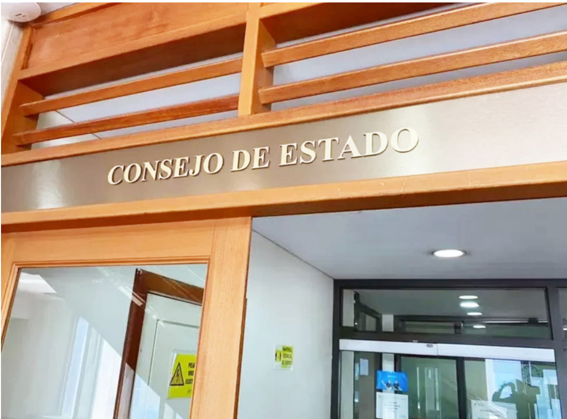
Sala del Consejo de Estado en Bogotá, donde se profirió la sentencia que revocó el fallo del Tribunal Administrativo del Huila.

juicios morales, materiales y por daño a la vida de relación. En primera instancia, el Tribunal Administrativo del Huila negó las pretensiones en 2016, argumentando que la atención había sido adecuada y respaldándose en un informe del Instituto Nacional de Medicina Legal.