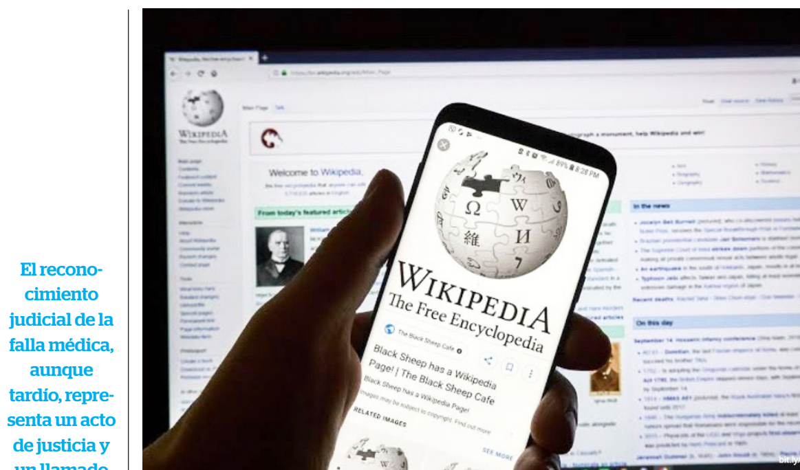
Medicina Legal acudió a Wikipedia para sustentar un informe pericial.