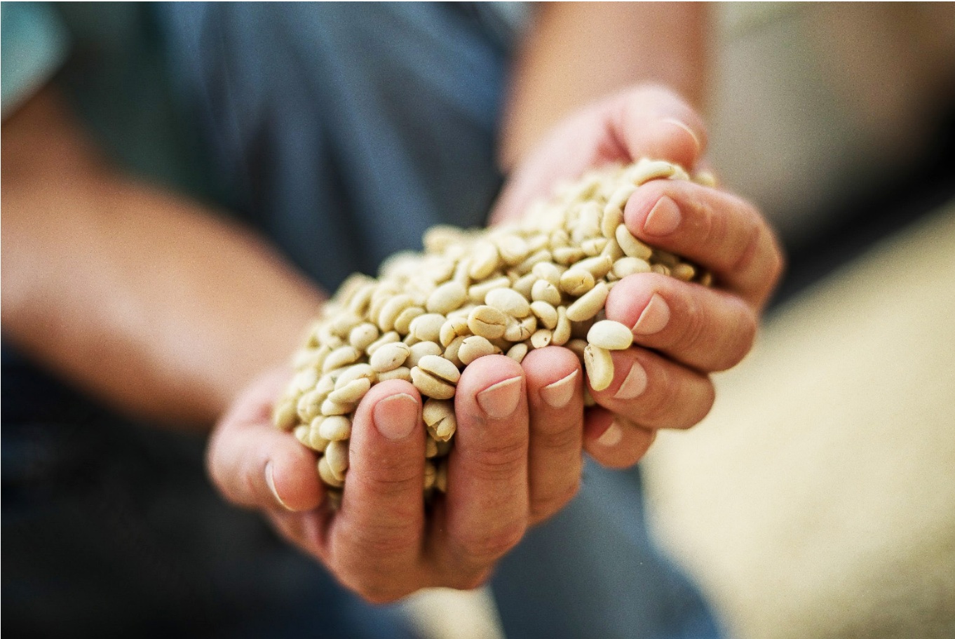
El Huila concentró el 19,65% de la producción nacional de café en 2025.

a las condiciones climáticas, factores que han sido determinantes en los resultados de 2025.