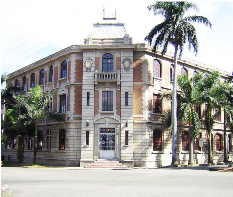
Facultad de Medicina de la Universidad de Antioquia, institución que elaboró el dictamen pericial determinante en el proceso.

a la Facultad de Medicina de la Universidad de Antioquia.