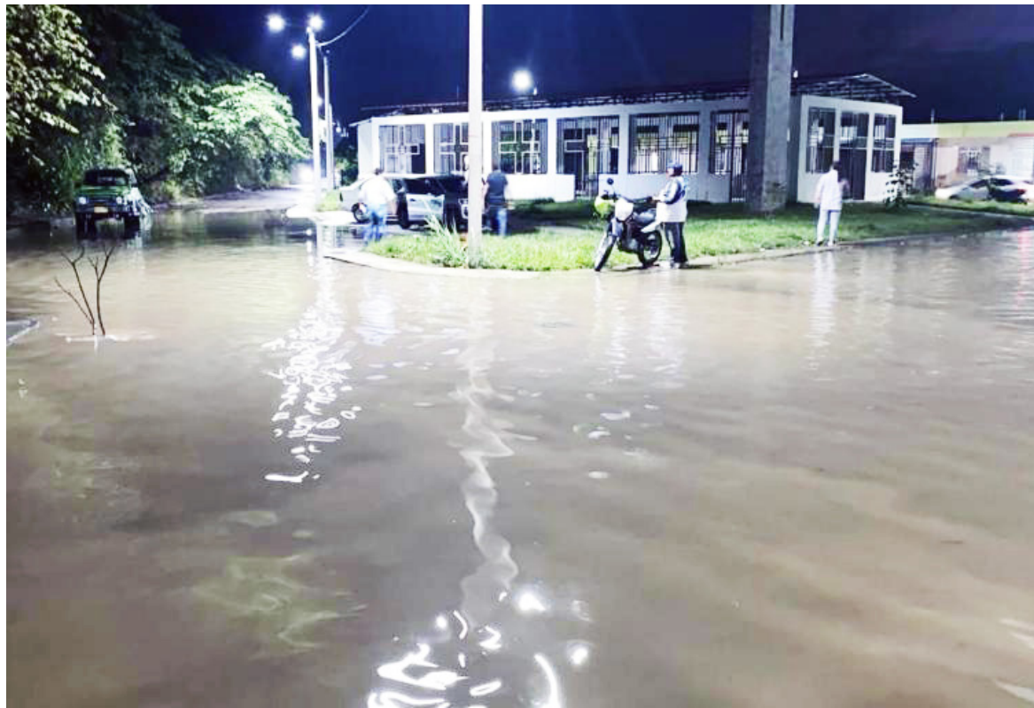
La comunidad denuncia irregularidades con la Planta de Tratamientos de Aguas Residuales (PTAR).