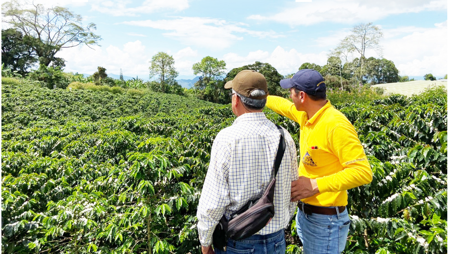
El café del Huila mantiene su reconocimiento por la calidad y el perfil de taza en mercados internacionales.