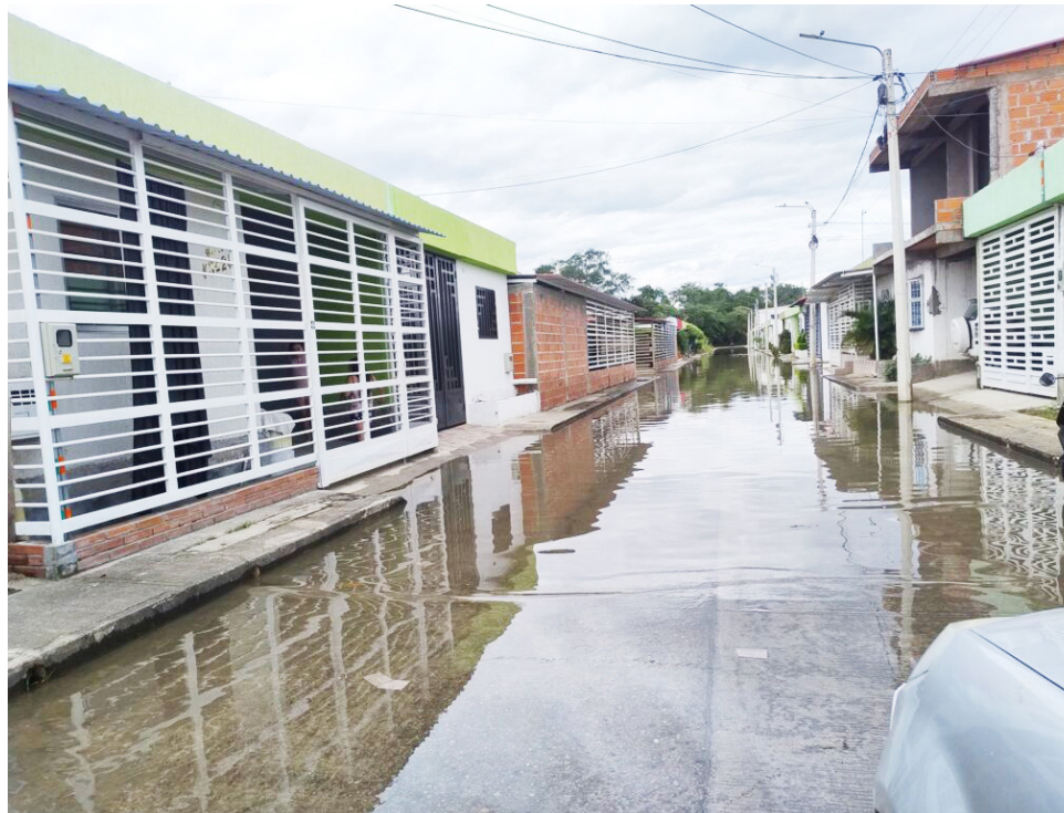
El 03, 04 y 05 de junio se presentaron las inundaciones en el barrio Alcalá.

Palermo (Huila), resume la situación con una frase bastante cuestionable: