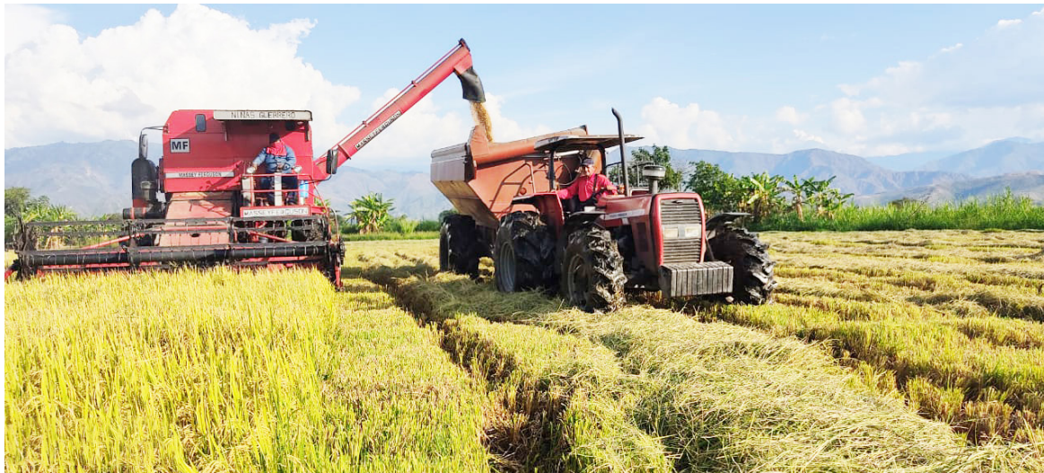
El sistema de riego por gravedad permite una producción constante de arroz en el Huila, incluso fuera de la temporada de lluvias.