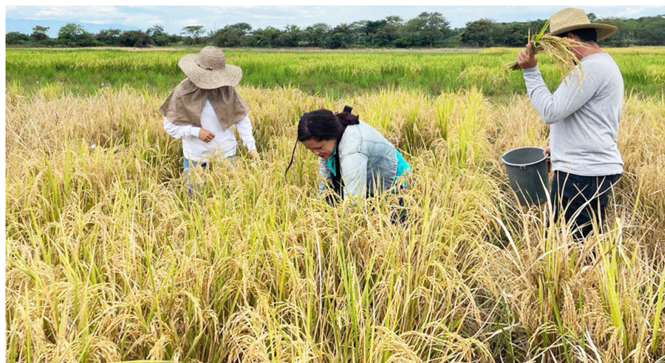
Más de 35.000 hectáreas en el departamento se siembran de arroz de manera permanente, involucrando a más de 15.000 productores.

La prórroga de los precios hasta 2026 brinda un respiro a los arroceros del Huila, quienes aseguran que, aunque la medida garantiza estabilidad, el control del contrabando sigue siendo clave para la sostenibilidad del cultivo.